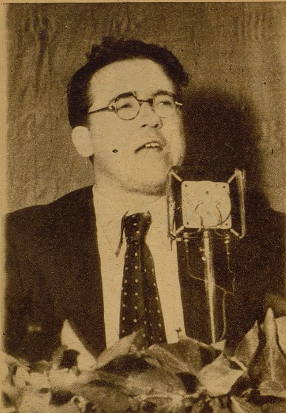
En Santiago Carrillo, secretario general de las Juventudes Socialistas Unificadas, la juventud que quiere arrojar de nuestro suelo a los invasores ve el gran forjador de su unidad, el firme timonel de la línea que nos conducirá a la victoria, a pesar de los ataques más o menos encubiertos que contra él dirigen los enemigos de la unidad.

Los trabajadores del taller "Pasionaria" desfilan armados ante el general Riquelme. No han olvidado la instrucción militar, y hoy están en condiciones de combatir si fuese preciso, como lo hacen nuestros mejores soldados