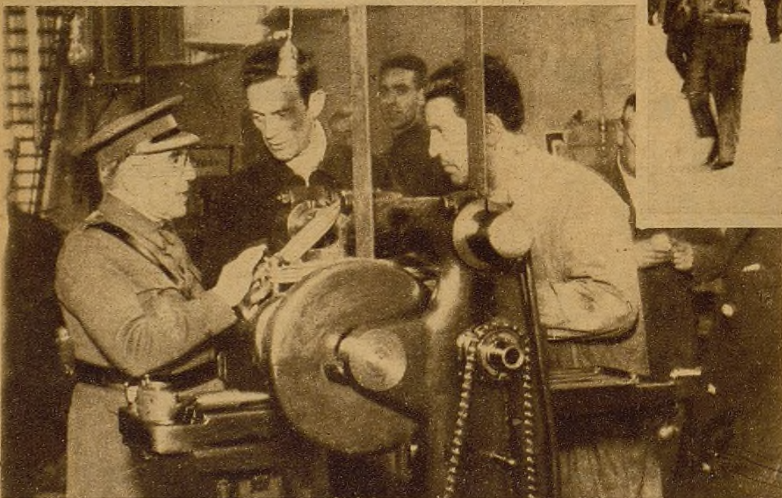
El inspector general del Ejército, general Riquelme, ha visitado los talleres "Pasionaria". A lo largo de esta visita ha podido comprobar cómo el heroísmo de nuestros soldados está respaldado por el esfuerzo de los combatientes del frente de la producción, de una retaguardia activa, que asegura la consolidación de las victorias de nuestro Ejército. Sólo la intensificación de la producción en todos los talleres, el apartamiento de todo lo que divide en la retaguardia, puede hacer una retaguardia digna del sacrificio de nuestros soldados