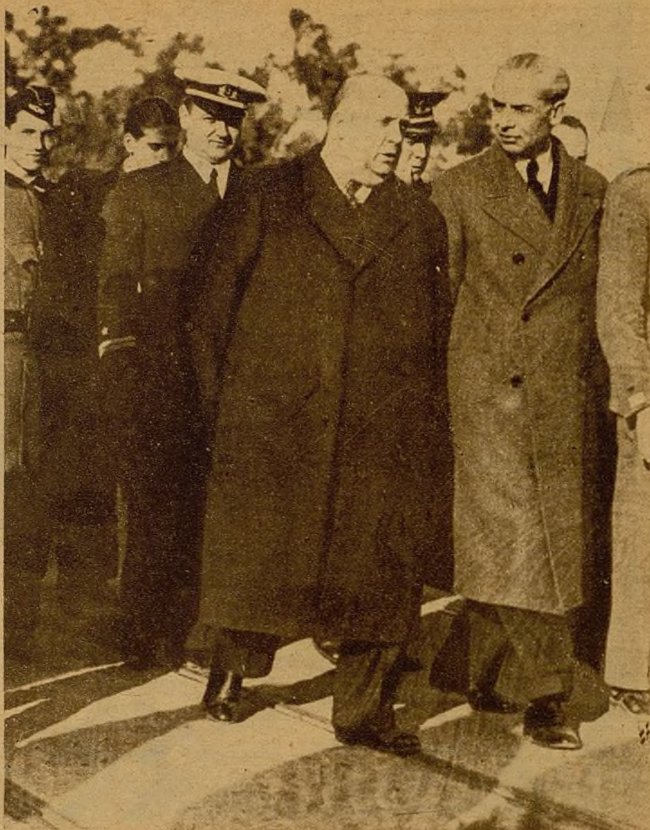
El ministro de Marina y Aire, Indalecio Prieto, ha creado esta gran Aviación que enorgullece a nuestro pueblo, y que junto con nuestra Marina asegurará a nuestros barcos la protección necesaria para impedir las agresiones de la piratería fascista