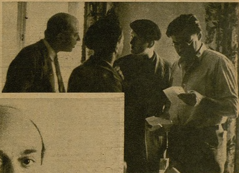
De izquierda a derecha: John Dos Passos, Joris Ivns, famoso cineasta holandés; Sidney Franklin, el torero yanqui antifascista, y el novelista Hemmingway, huéspedes de honor del Madrid en guerra

John Dos Passos, el novelista americano que recorrió España a pie para escribir su famoso libro "Rocinante vuelve al camino", que ha venido a España "a torear obuses" (como él dice) y a filmar una película de la que no falta más que la última escena: la gran batalla final