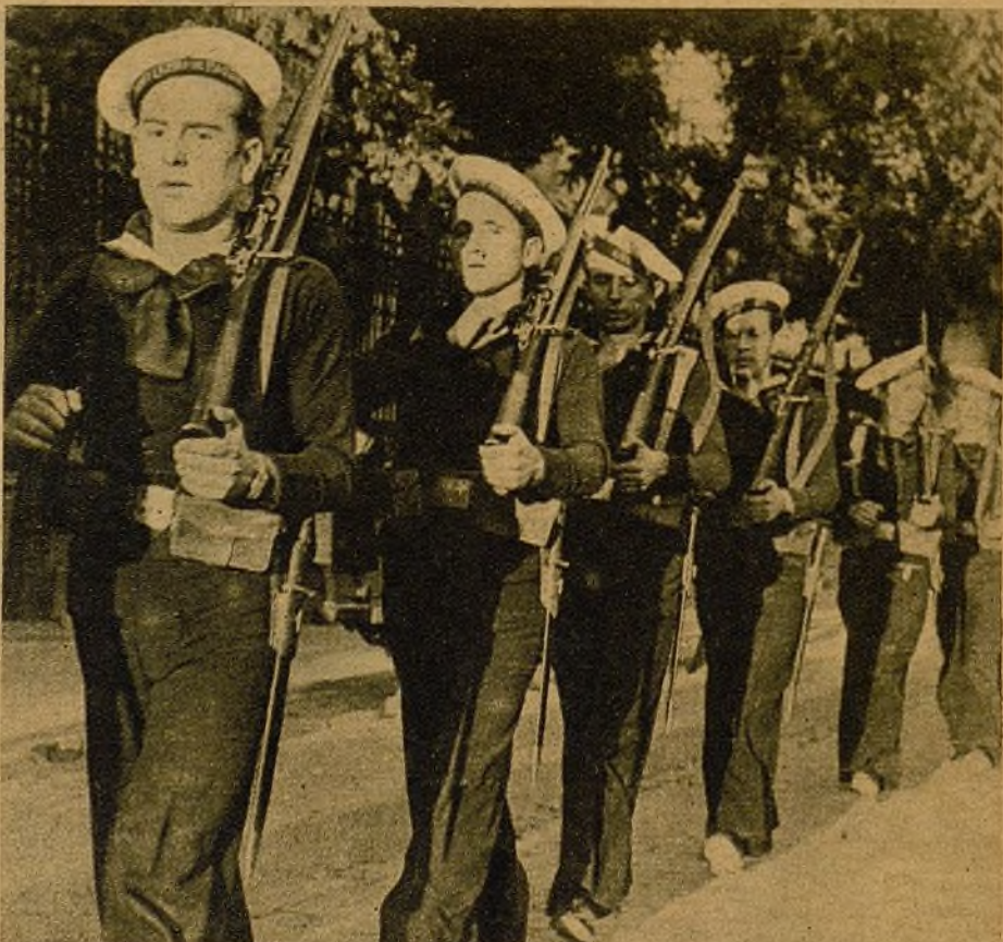
Nuestros heroicos marinos han respondido a la nota del ministro de Marina y Aire como todo el pueblo esperaba. Han dicho: "Lucharemos mientras quede un barco a flote y un solo marinerito con vida"