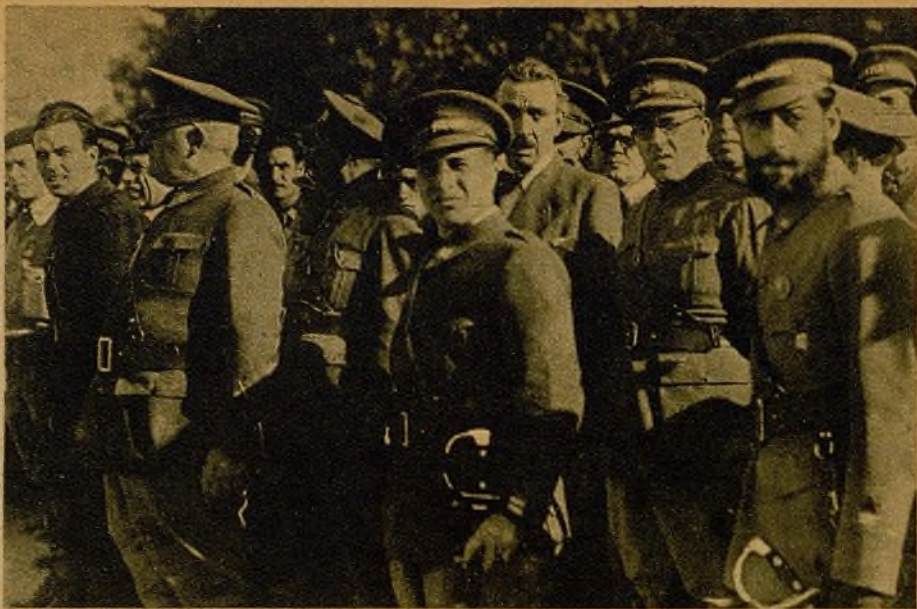
El general Miaja, el coronel Rojo, el comisario general del Ejército del Centro, camarada Antón, y otros jefes militares, presenciando el desfile de la heroica 28 Brigada—constituida por los antiguos batallones Martínez Barrio—, a la que fué entregada una bandera, que ellos prometieron llevar hacia adelante hasta la victoria