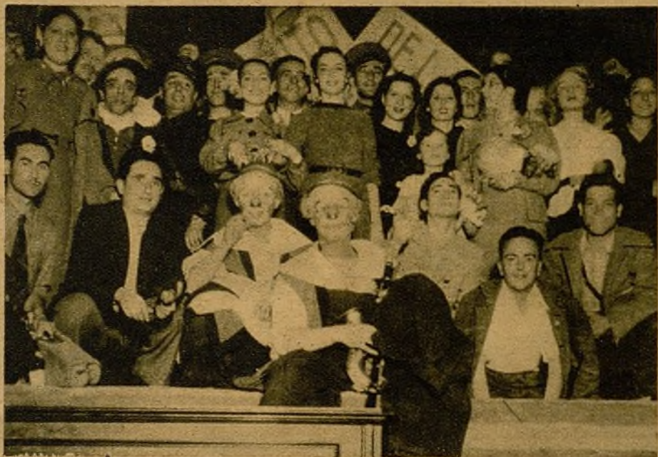
En segunda línea, en el Hogar del Combatiente de la 36 Brigada, los heroicos veteranos de Uusera, que acaban de convertir un golpe de mano fascista en un avance leal, celebran una fiesta—organizada por su comisario—en la que el buen humor está a la orden del día