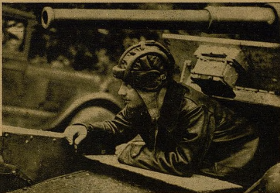
Dispuesto para lanzarse al asalto con su máquina, abatiendo cuantos obstáculos se opongan