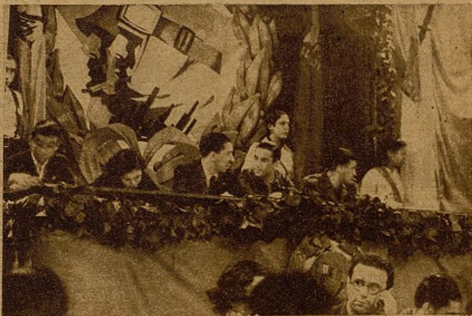
La presidencia de honor del acto. Militantes destacados de "Alerta", del Ejército del Pueblo y dirigentes de las organizaciones del Frente Popular, demostraron con su presencia la simpatía que en todos los sectores se siente por la gran organización de educación premilitar