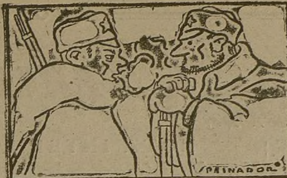
—Queipo ha amenazado a Inglaterra. —No lo creas, ha sido von Faupel.