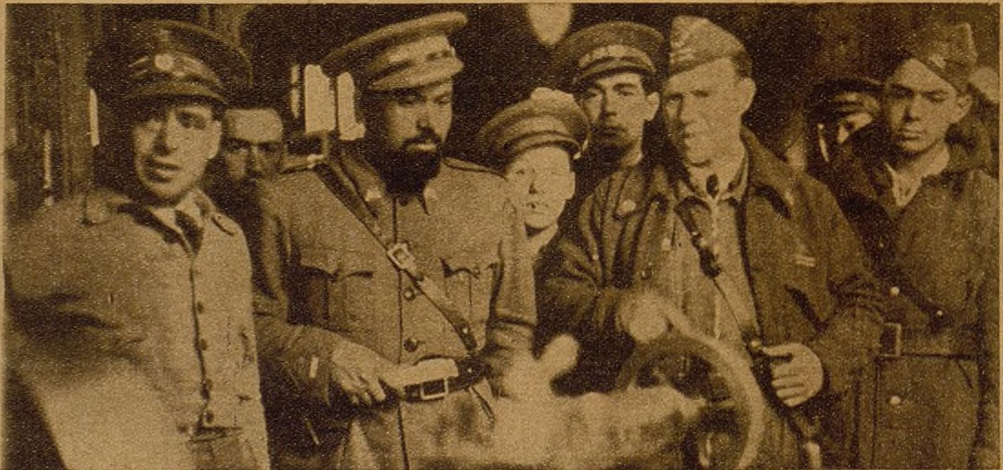
El glorioso jefe de la Brigada móvil de Choque ha visitado los talleres de Sanidad Militar, que tan grandes servicios han prestado a la causa del pueblo. "El Campesino" ofreció una comida a los obreros que realizan estos trabajos, cooperando así a que nuestro Ejército tenga una Sanidad digna de su heroísmo y de su sacrificio