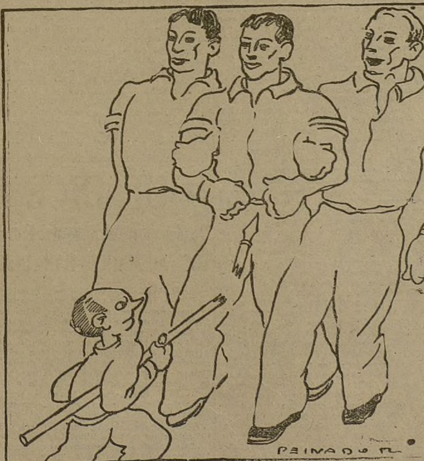
El enemigo de la unidad juvenil rompe una lanza y se le rompe la lanza

La Comisión ha comunicado posteriormente a Ginebra, que los sitiados han respondido que no tienen autorización para adoptar ninguna decisión.—Fabra.