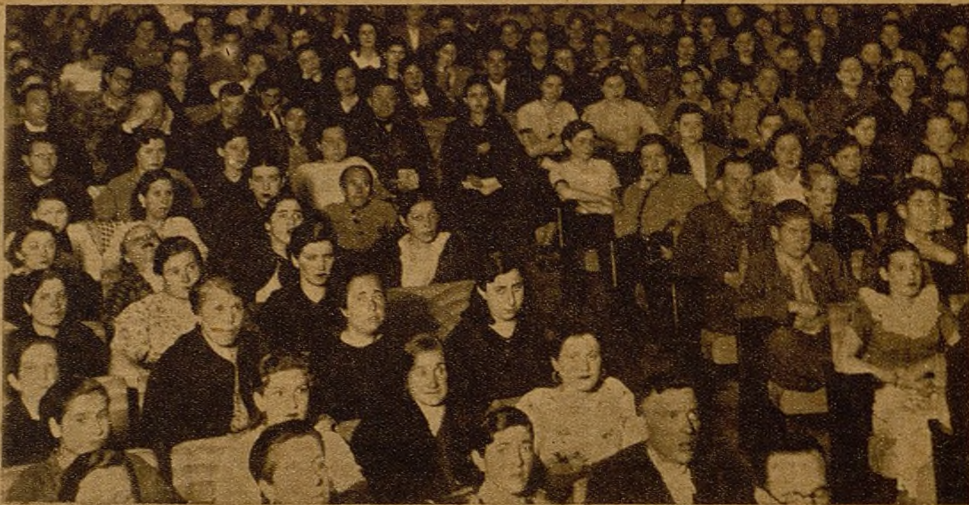
Los chicos madrileños, que también se han ganado la admiración de todos los jóvenes de España, escuchan con atención las palabras de los camaradas que informan sobre las actividades femeninas en relación con la guerra. En todos ellos, que ayudan a los combatientes trabajando en las fábricas, al terminar el mitin-festival se ha afirmado su voluntad de luchar, produciendo, hasta vencer