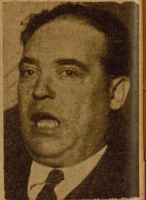
En el mitin socialista del domingo intervino un gran amigo de nuestras Juventudes, el camarada Wenceslao Carrillo, director general de Seguridad