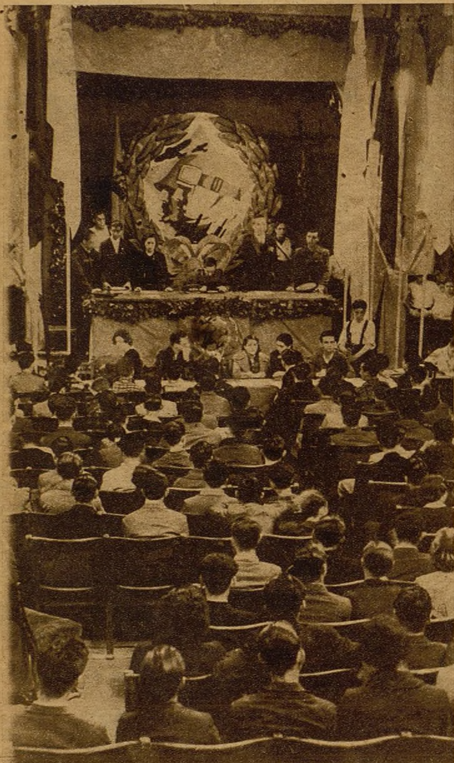
El domingo se ha celebrado en el Ateneo el I Congreso de "Alerta". A él asistieron representantes de todas las escuelas de Madrid. En él se dirigieron a los jóvenes militantes de "Alerta" los dirigentes más destacados de la juventud madrileña