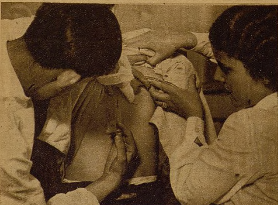
La orden de vacunarse contra el tifus es acatada por todos los madrileños. De todas partes se acude a los centros destinados a este fin. Todos saben que velar por su estado sanitario es contribuir también a ganar la guerra al fascismo