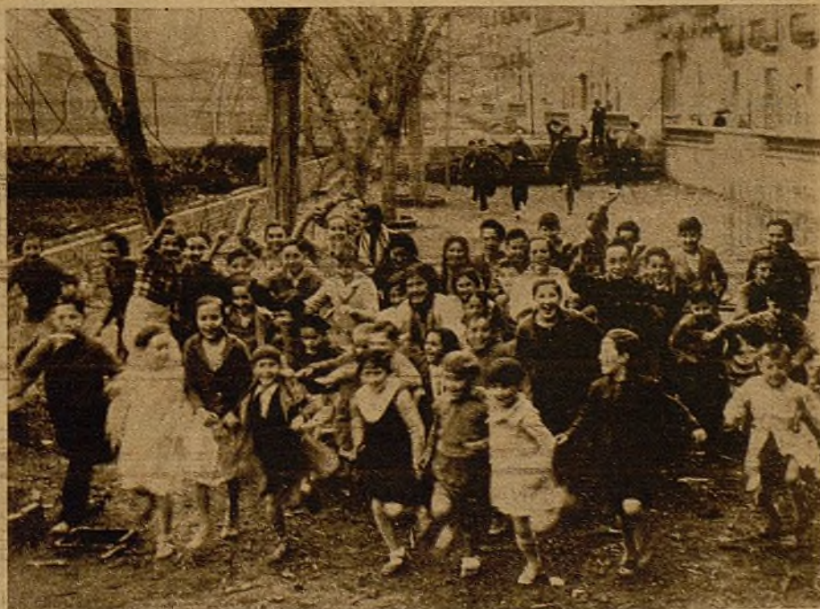
Verdad, mujeres, que estos chicos que han sufrido el horror de la metralla asesina ahora no tienen cara de pasarlo mal?