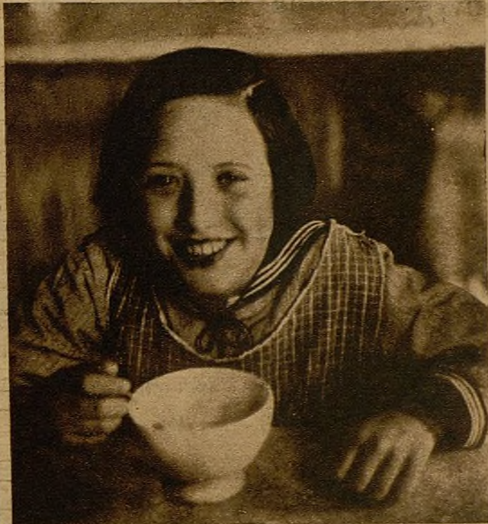
Vedles en sus juegos, en sus charlas, en la comida. Vedles alegres. Esta risa es más elocuente que todas las palabras que podamos oír sobre la vida de los pequeñines en Levante y en Cataluña

Sabemos mujeres, sabemos madres, que este sacrificio que os impone la guerra es uno de los más dolorosos.