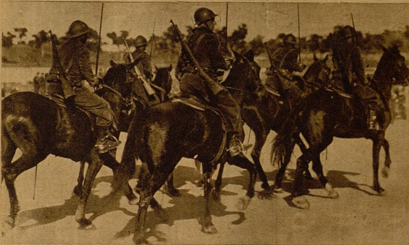
La Caballería del Ejército popular, probada en el fuego de tantos combates, se dispone a reforzar su heroísmo en todos los frentes ←