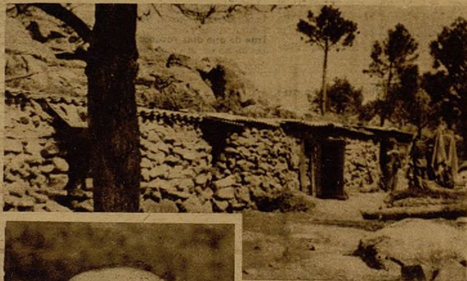
En las posiciones de las alturas, la guerra larga ha hecho nacer carreteras y calles de piedra, donde viven los soldados ignorados y anónimos de la Sierra. Esta calle se llama "la Gran Vía", porque los obuses silban a diario sobre sus chozas...