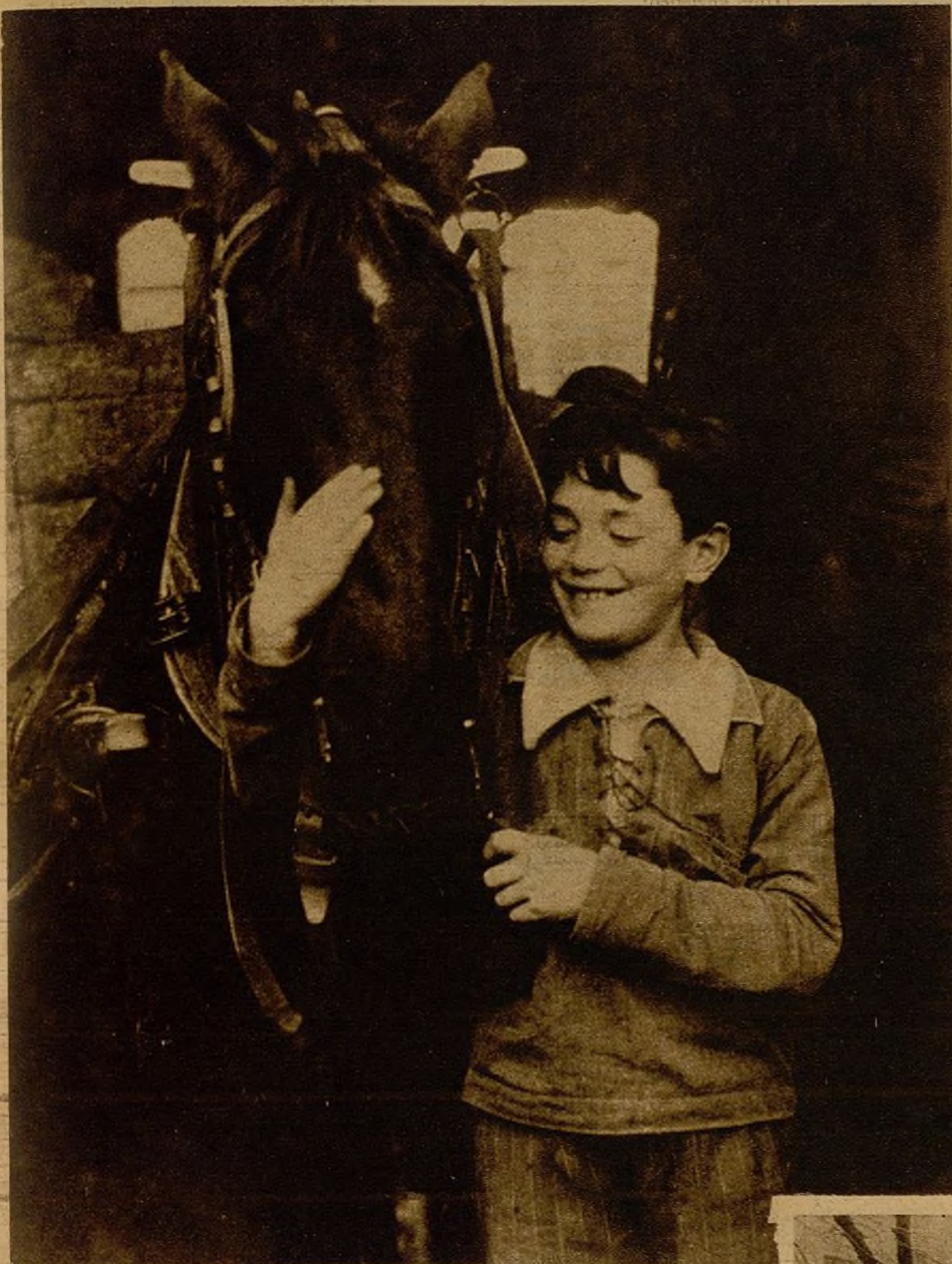
En las guarderías infantiles de Levante los chicos, libres de las explosiones de los obuses asesinos, rien satisfechos. Allí han encontrado compañeros abnegados y campesinos, que han alejado de su imaginación los horrores de la guerra