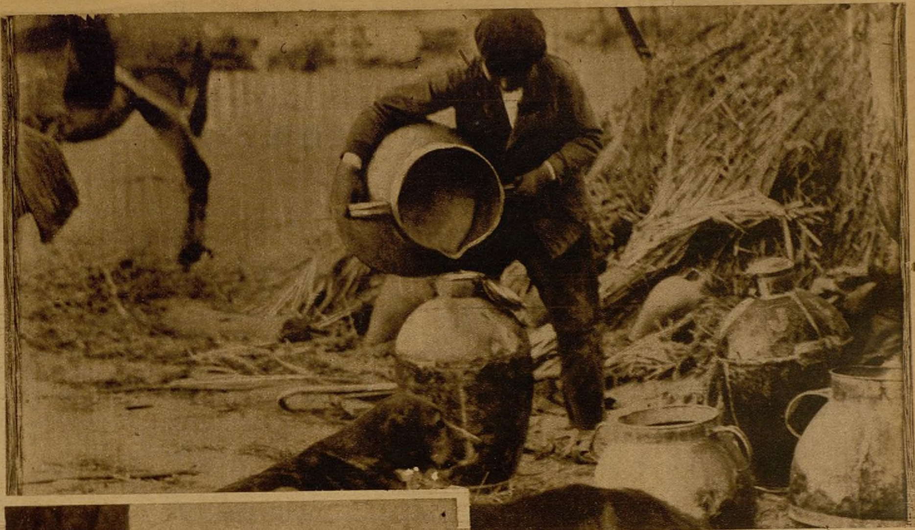
Las tareas del campo no podían abandonarse; los combatientes de las trincheras, los hospitalizados, lo precisan...