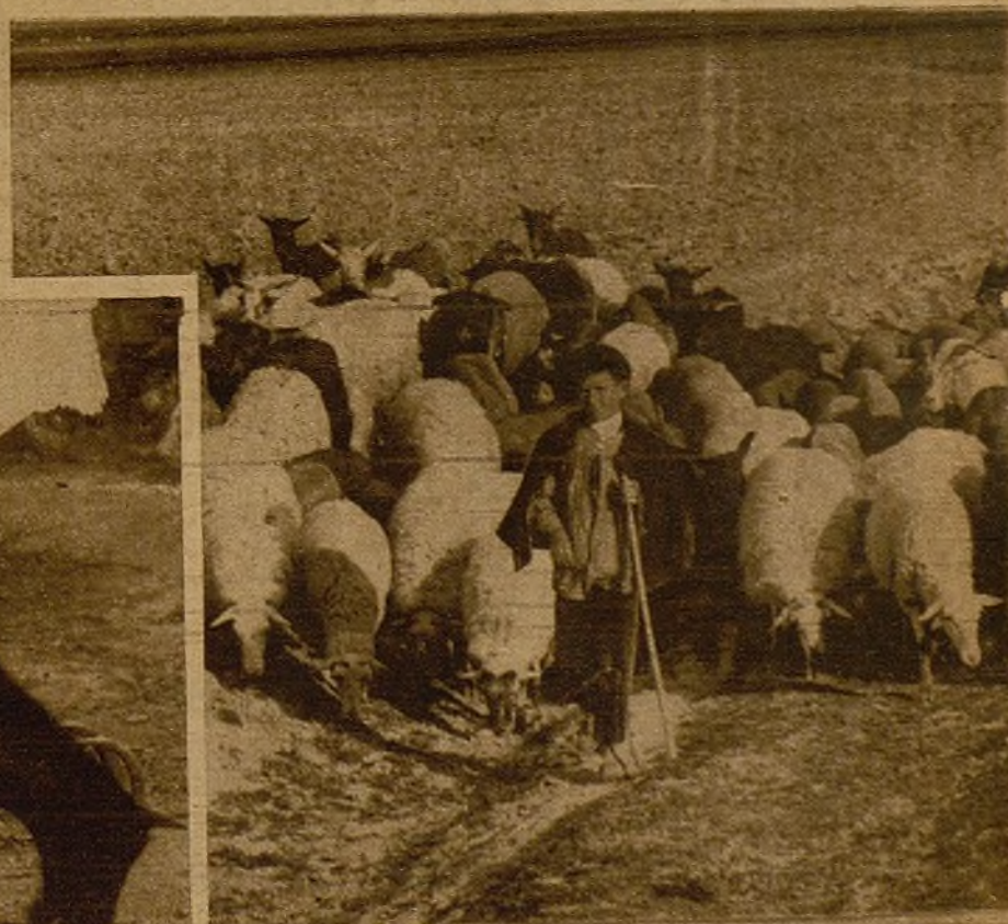
Los rebaños, conducidos hoy por estos rapaces, garantizan el abastecimiento de nuestros frentes

Hijos y hermanos de los combatientes realizan las tareas del campo