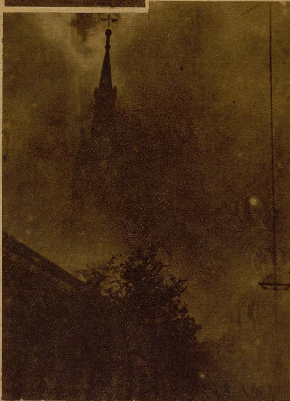
En Chamberí se ha producido un incendio casual, que ha destruido gran parte de la iglesia. Nuestro fotógrafo ha recogido esta visión del edificio, envuelto en llamas y en humo