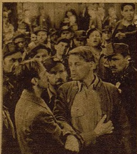
El genial actor Paul Muni en "Infierno negro"

T I V O L I ¡CUARTA SEMANA! MADRE ALEGRIA EXITO SIN PRECEDENTE