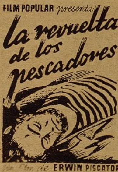
Film de ERWIN PISCATOR

HOY ESTRENO RIGUROSO FORMIDABLE PRODUCCION SOVIETICA