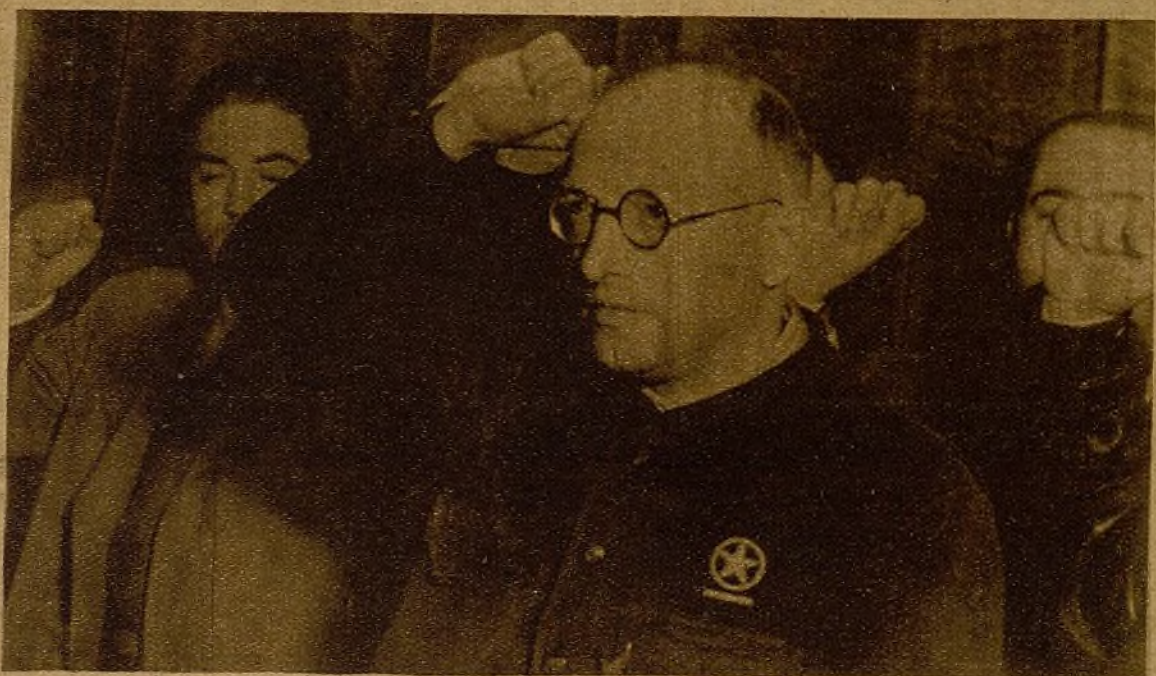
Pietro Nenni, destacada figura del movimiento socialista internacional y comisario de nuestro heroico Ejército, en el mitin de ayer