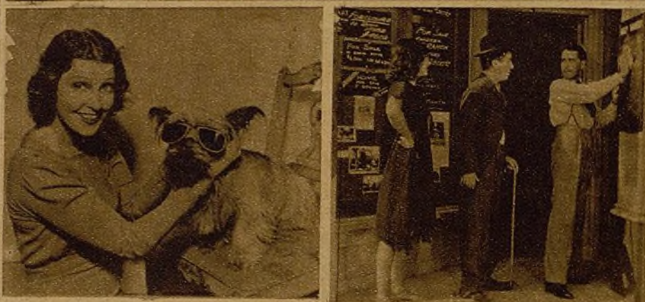
Jeannette Mac Donald en su magnífica Una escena de la película "Tiempos modernos"