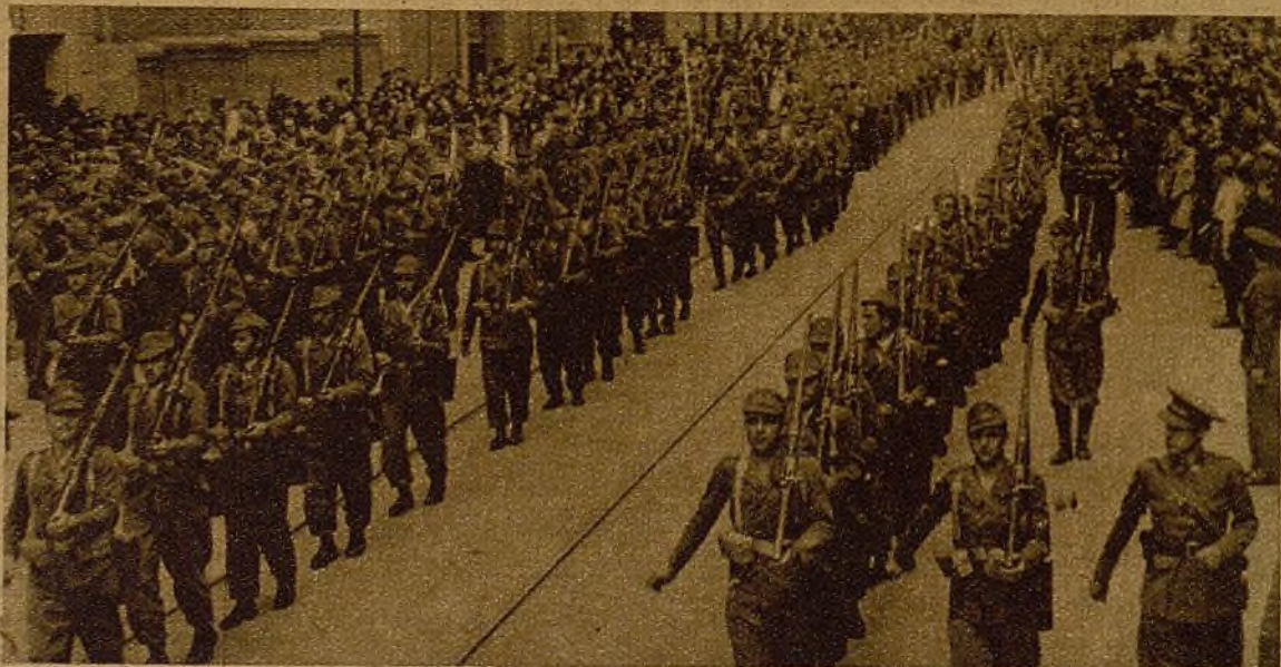
Soldados de la defensa de Madrid... Héroes de duras batallas y de trincheras avanzadas que desfilan —entre gritos alegres de entusiasmo— despues de prometer, al recibir su nueva bandera del 2 de mayo, que no descansarán hasta arrojar de España al invasor extranjero