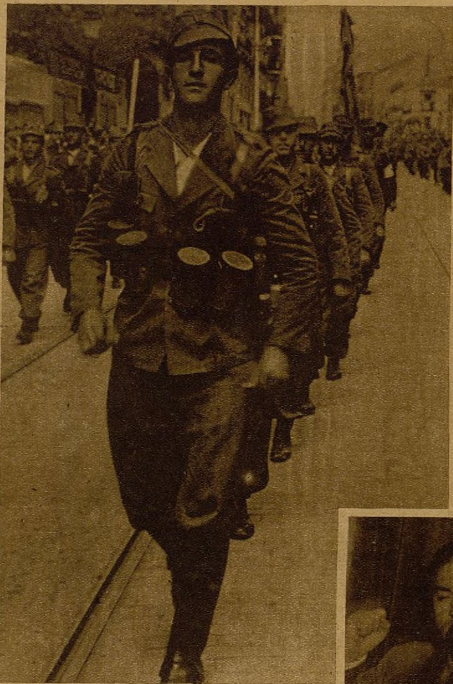
Veteranos heroicos de la 43 Brigada desfilando, como saben hacerlo los hombres del frente, despues de recibir su nueva bandera