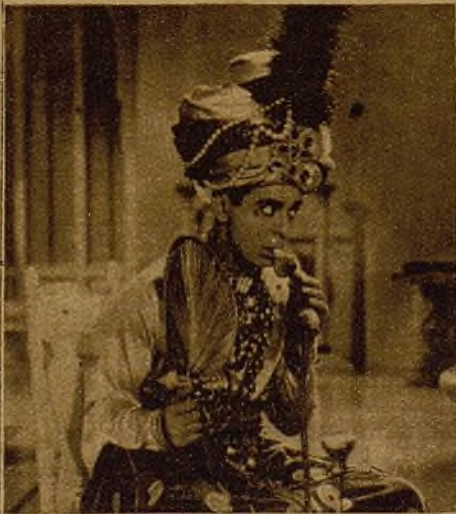
Eddie Cantor en su graciosa película "Hombre o ratón"

LA PELICULA ESPAÑOLA AMOR GITANO POR LA YANKEE y MAPY CORTES