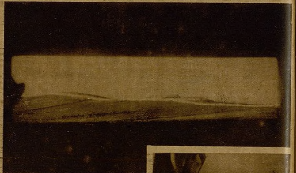
Aquí está, defendida por una loma bordeada de trincheras, la célebre Casa de Labor, escenario de los violentos combates del 25 de febrero...