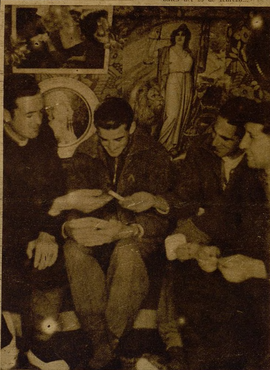
Cromos alegres, tapices y estampas de la República... Los veteranos del frente de la carretera de Extremadura han convertido sus chavolas en "villas" subterráneas, en las que se vive confortablemente...