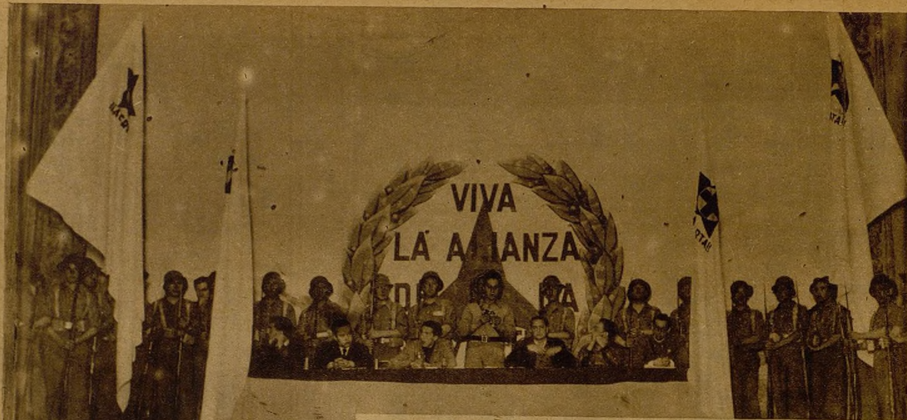
El Frente de la Juventud celebró en un acto la conmemoración de la independencia de España. Las banderas de todas las juventudes se alzaban en el local, en un común deseo de unidad