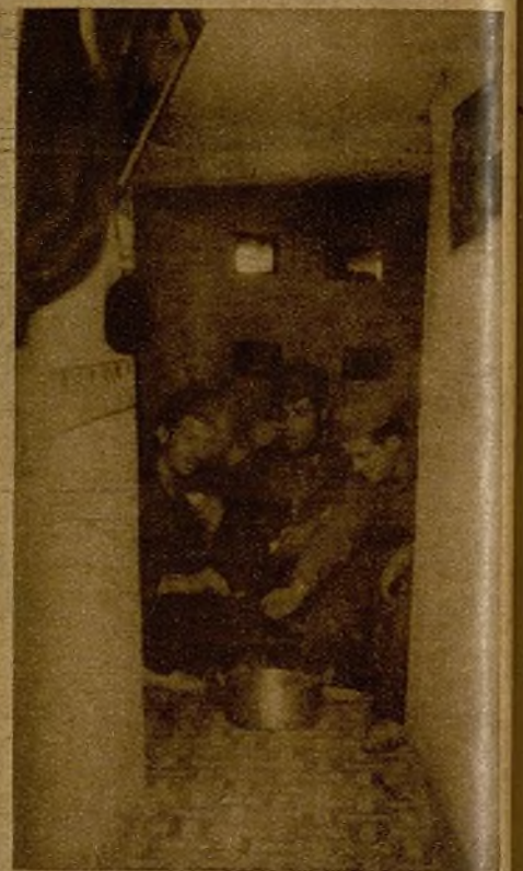
Esto parece una apacible casa de pueblo, pero es una chavola de primera línea construida por los soldados de la 43 Brigada... En vez de ventanas hay troneras por las que se ve—sólo a unos metros—al enemigo