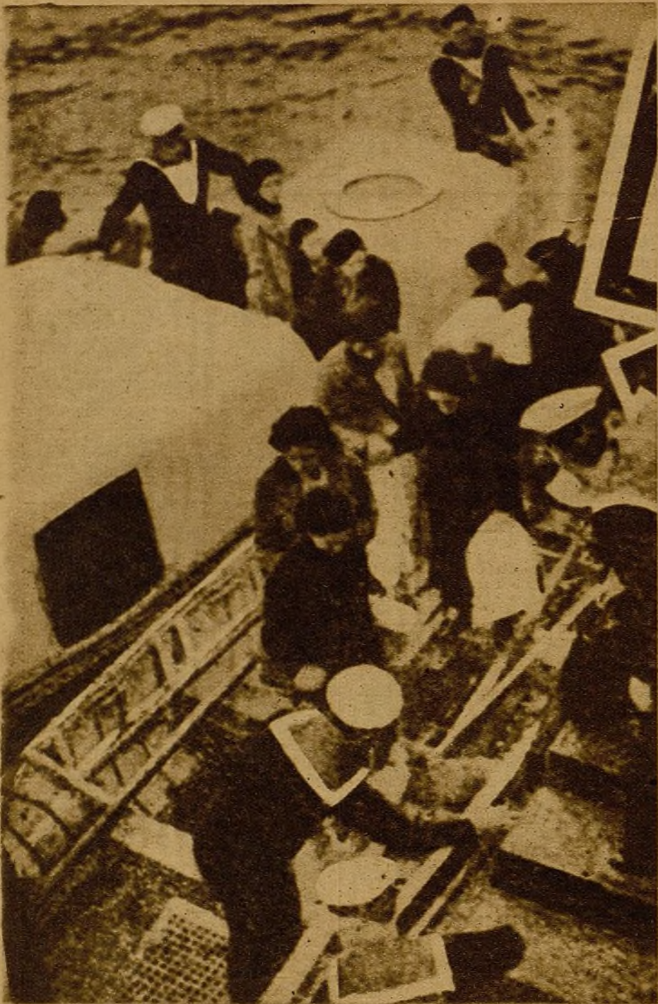
Los marinos ingleses del acorazado "Oak" ayudan a evacuar a las mujeres y niños de Bilbao, víctimas de los bombardeos criminales de la Aviación alemana e italiana