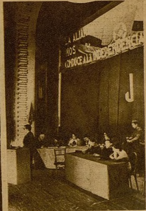
La presidencia de la Mesa. El camarada Santiago Carrillo explica la única línea justa que debe seguir la juventud española en estos momentos para acelerar la victoria.