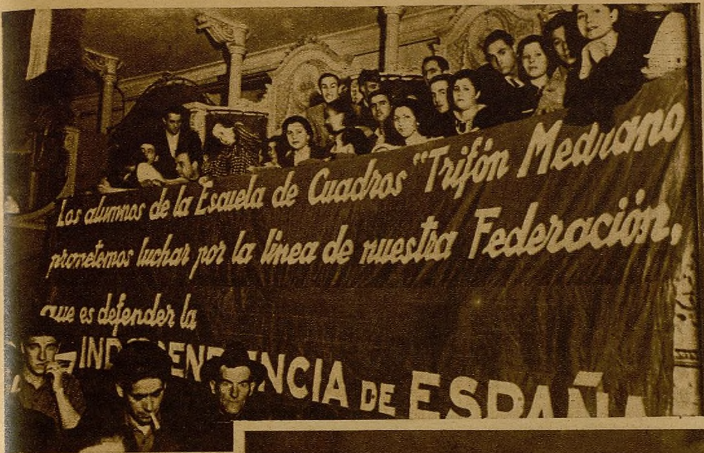
Las Juventudes Socialistas Unificadas, vanguardia de la juventud española, celebran un grandioso mitin en Valencia, donde prometen una vez más "luchar por la línea de nuestra Federación", que es luchar por la independencia patria.