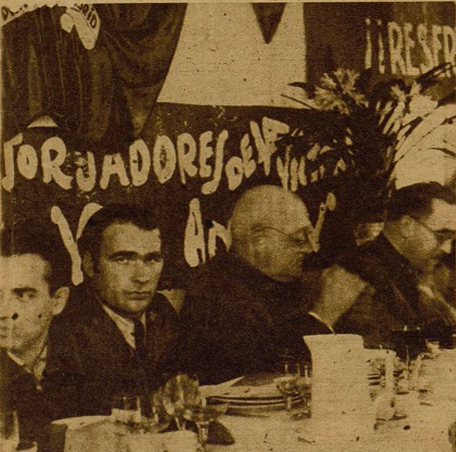
El personal obrero de los Almacenes Quirós—modelo de trabajadores antifascistas—obsequió con un "lunch" a los gloriosos jefes de la defensa de Madrid, general Miaja, Antón, teniente coronel Rojo y comandante Enrique Lister