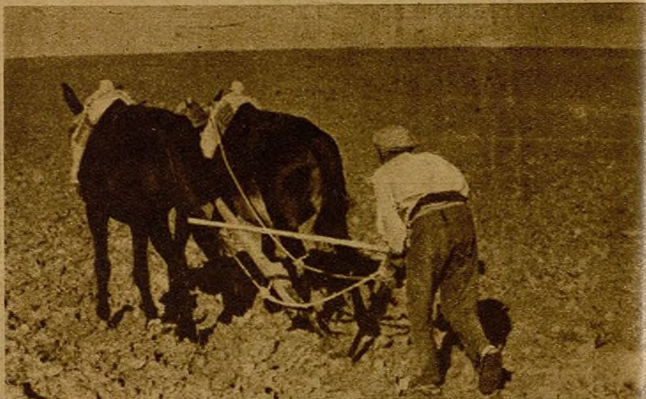
Mientras sus hijos luchan en los frentes por la tierra, el pan y la libertad, el campesino pobre trabaja desde el amanecer hasta el oscurecer, ayudando con su esfuerzo constante a ganar la guerra