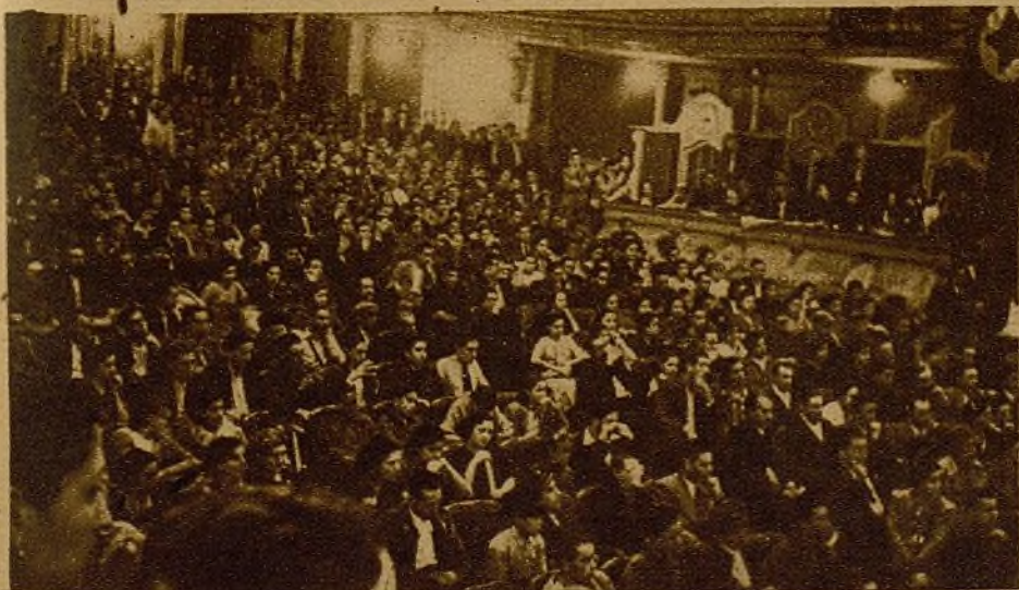
Numerosos jóvenes de todas las tendencias siguen entusiasmados los discursos de los compañeros de la Ejecutiva Nacional de nuestra Federación.