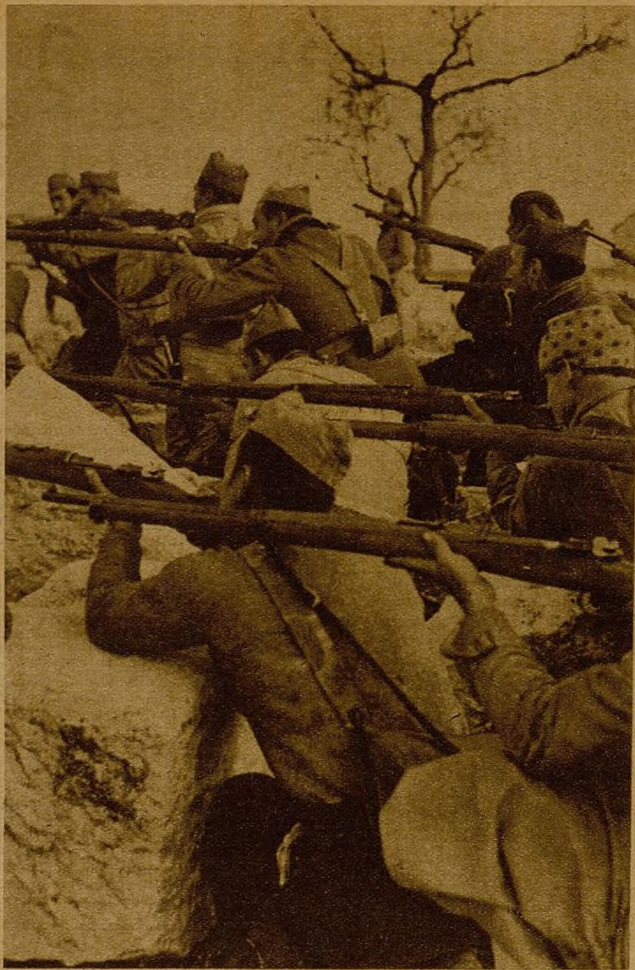
Los combatientes de todos los frentes tienen prisa por acelerar la victoria, tienen prisa por ayudar al Euzkadi amenazado. Quieren ganar la guerra pronto