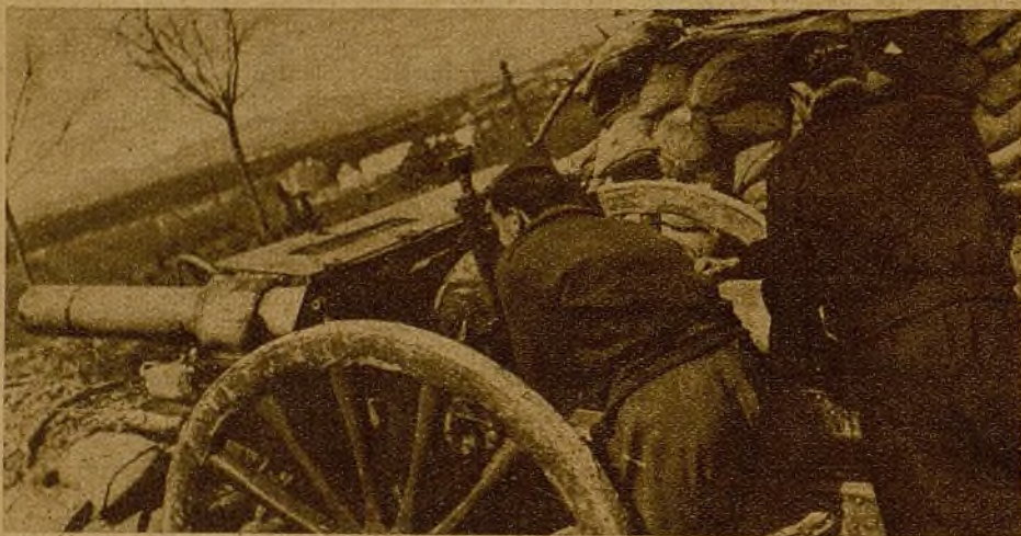
Artilleros de Madrid... Rivalen heroicos de los asesinos del monte Garabitas... Ellos también quieren la ofensiva, que alejará para siempre la tragedia de los obuses sobre nuestra ciudad...