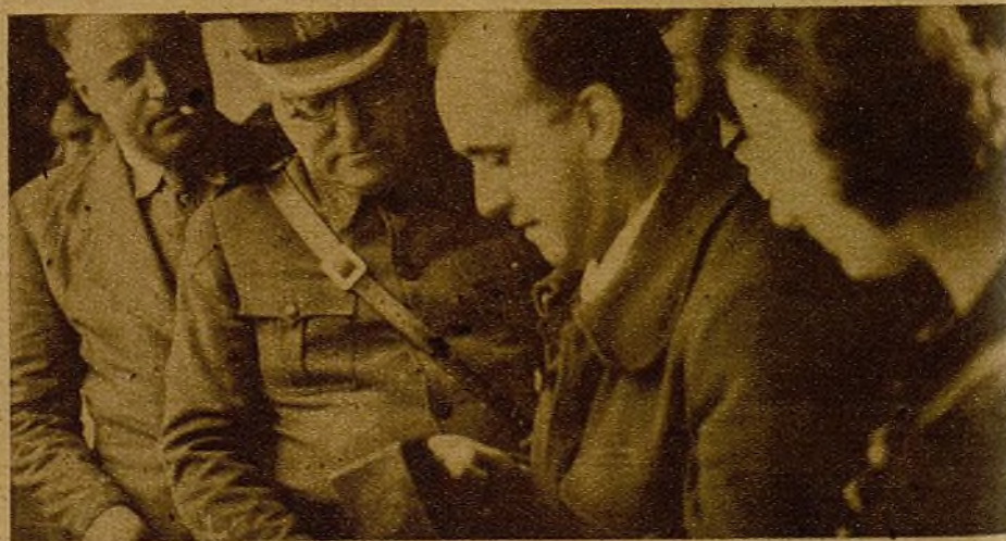
Un obrero de la fábrica enseña al general Miaja los trabajos realizados. El general Miaja contempla estos trabajos, satisfecho de encontrarse en esta visita con una retaguardia sólida que vive y produce para la guerra