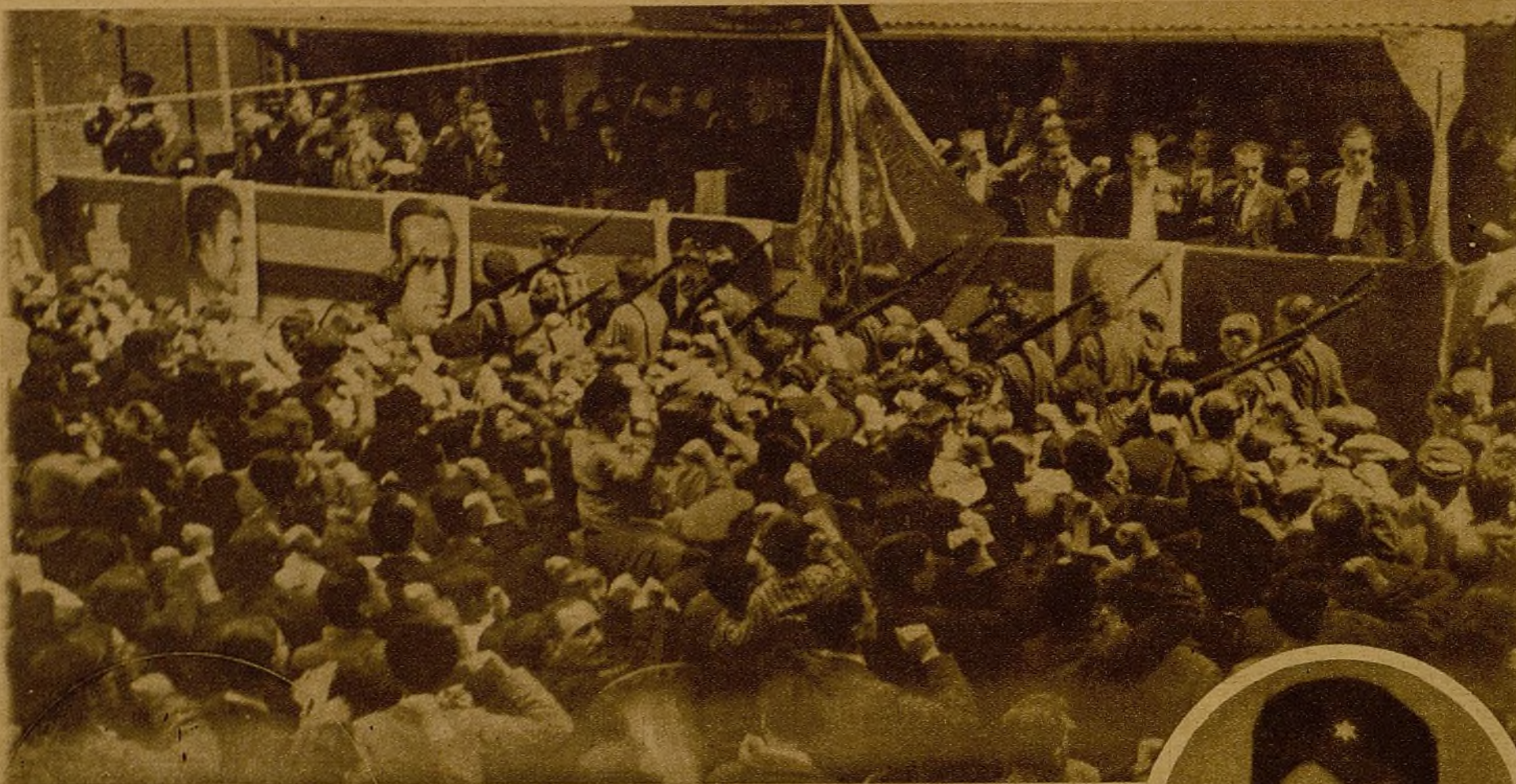
Los obreros de choque de la fábrica después de la entrega de un banderín al glorioso batallón Thaelman, desfilan ante el heroico jefe de la defensa de Madrid, general Miaja