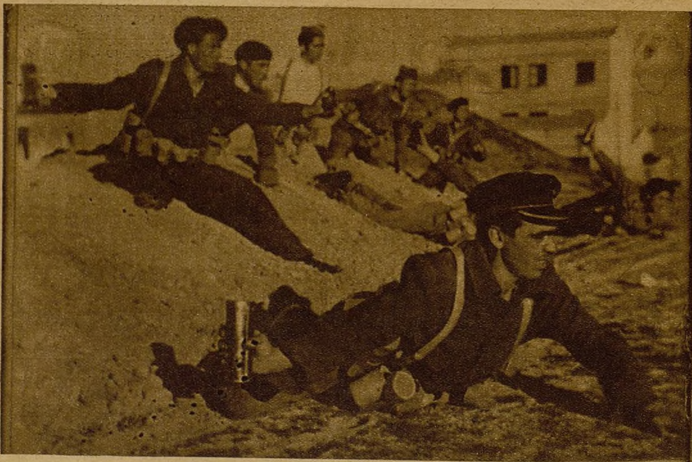
Los antitanquistas jóvenes están disgustados: "Los tanques ya no vienen; tienen miedo a nuestras bombas certeras... ¡Queremos ir por ellos hasta sus mismos nidos!"...