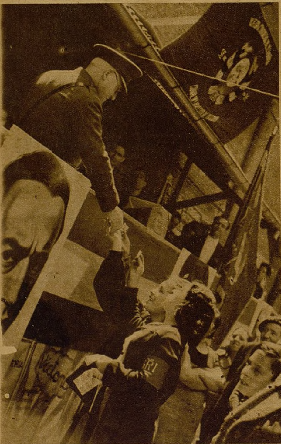
El general Miaja es el jefe más popular de Madrid. El pueblo le quiere porque ve en él la garantía de sus victorias. Estas chicas del S. R. I. venden sellos, muy satisfechas por su venta, al general Miaja