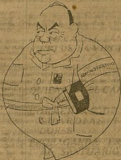
Rueda, el segundo "Atamán"

El grupo de artistas de choque vive en un régimen de comunidad perfecta. Comunidad en el esfuerzo de todos, en la alegría del trabajo, en la camaradería