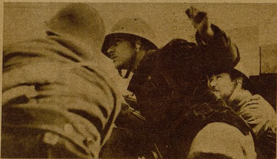
La juventud, desde su puesto de honor de fuerza de choque de las trincheras, exige la ofensiva para ayudar a los hermanos lejanos de Euzkadi...