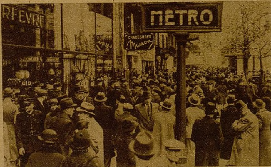
En España, los obreros empuñaron las armas para aplastar al fascismo. En Francia, los empleados de los grandes almacenes se manifiestan contra sus explotadores y en favor de la semana de cuarenta horas (F. Vidal)