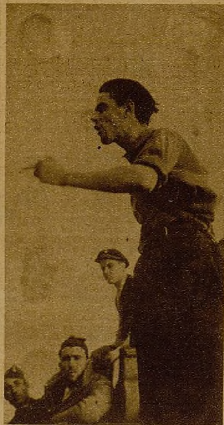
Los comisarios—forjadores de la moral de ataque de nuestro Ejército—han recogido el deseo de toda la juventud combatiente de emprender una ofensiva violenta en todos los frentes de España...