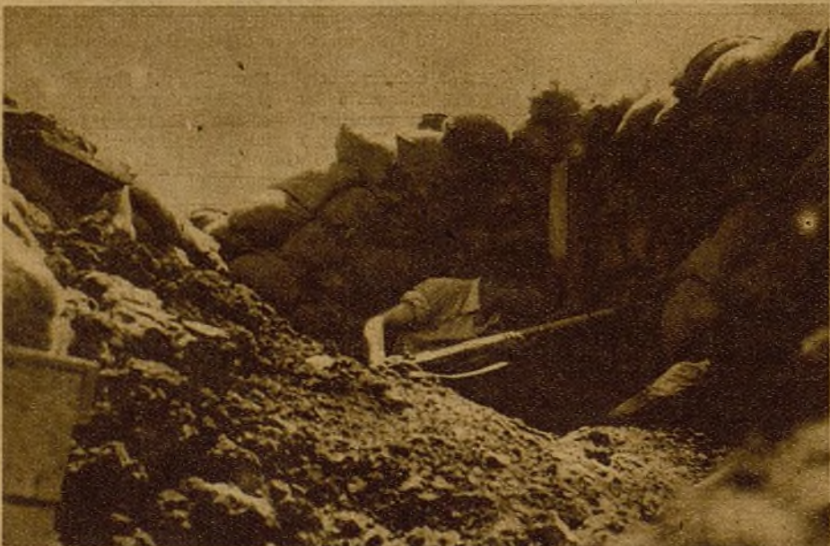
Pero hay que estudiar bien las mejores posiciones para que el tiro sea lo más certero. Y en los escasos momentos de tranquilidad, fuera del ataque, nuestro compañero, buen centinela, otea hacia la zona enemiga, evitando cualquier desagradable sorpresa y asegurando el descanso merecido de sus compañeros