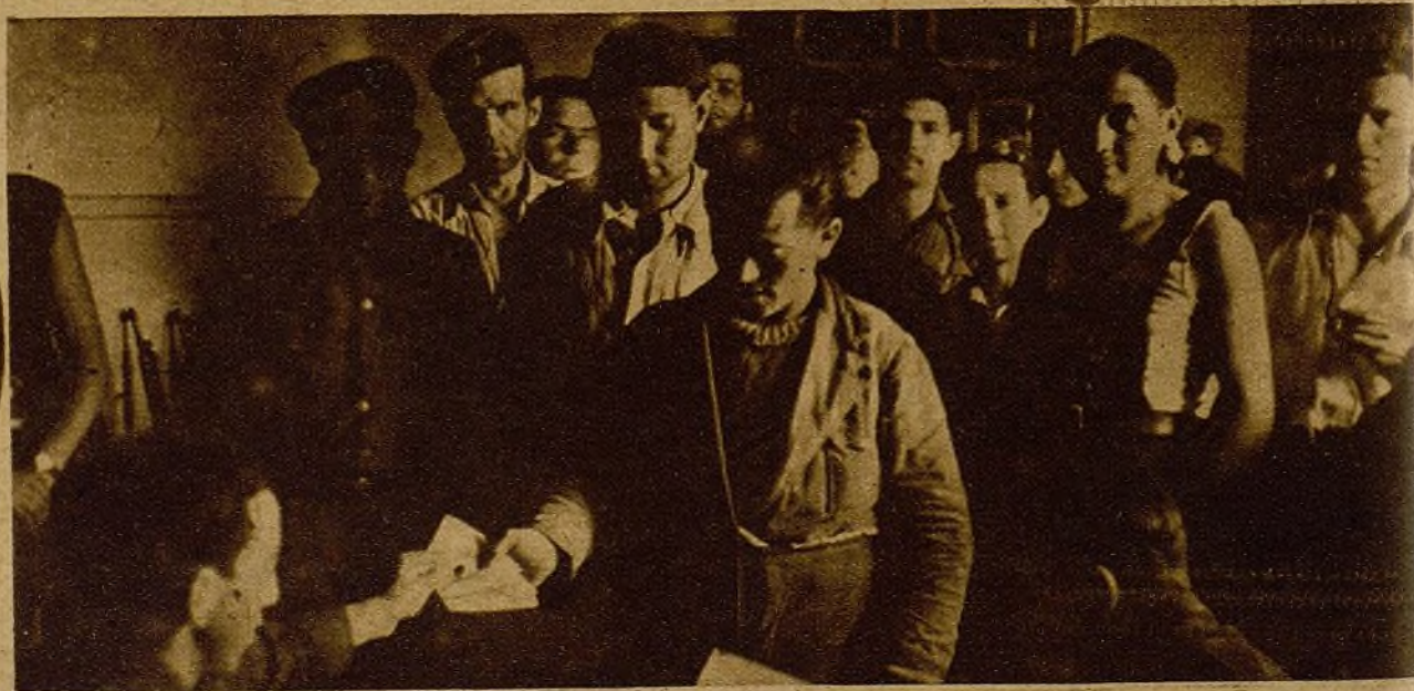
Nuestros soldados en el momento de cobrar la paga que se les ha asignado a todos los defensores de la Patria