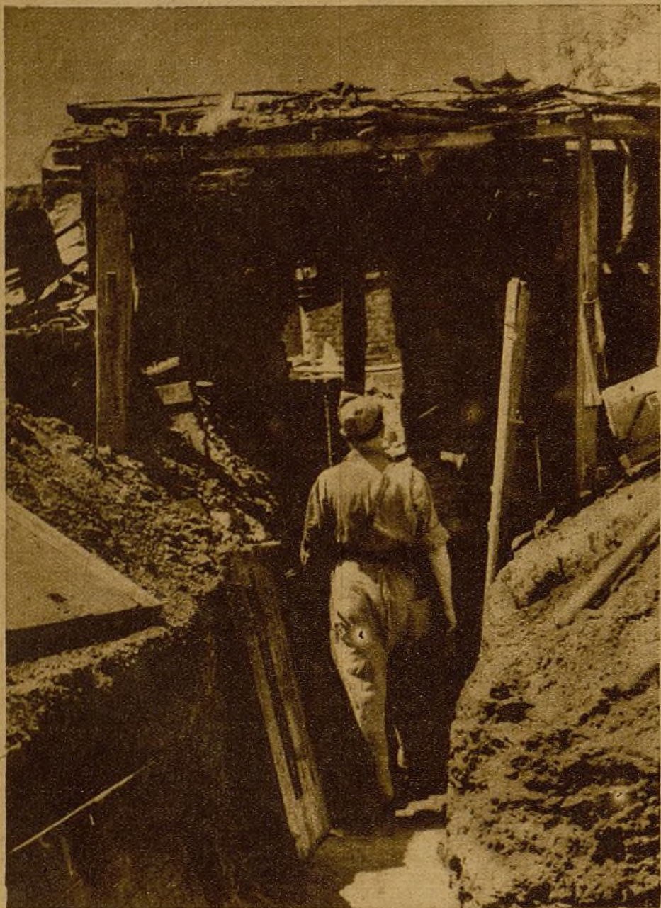
Posiciones tomadas al enemigo en el sector de Carabanchel. Nuestros soldados recorren varias casas derruidas, reducto de los facciosos antes de la voladura y hoy atalayas de nuevas victorias