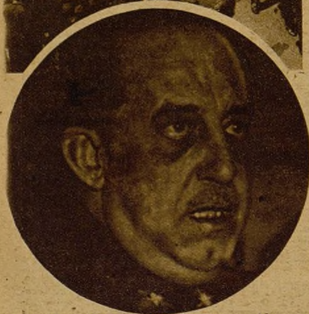
Todos los antifascistas honrados han acogido con satisfacción el nombramiento del general Pozas para el mando del Ejército del Este