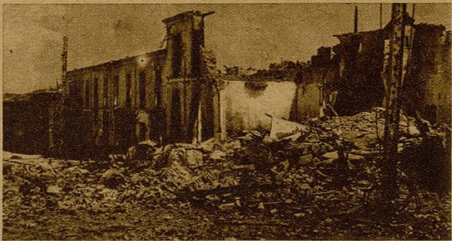
Nuestro Ejército, que para vencer no necesita hacer víctimas inocentes, sabe atacar con denuedo las posiciones enemigas. La fotografía nos muestra cómo quedó después del ataque, el que fué cuartel faccioso