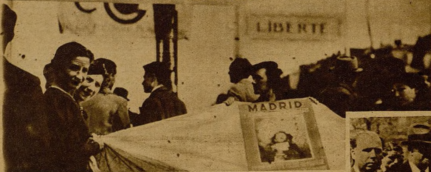
Los intelectuales, los escritores, los artistas del mundo entero, están con nosotros. En la manifestación del Primero de Mayo en París han participado pidiendo al pueblo de París una ayuda efectiva en defensa del pueblo español