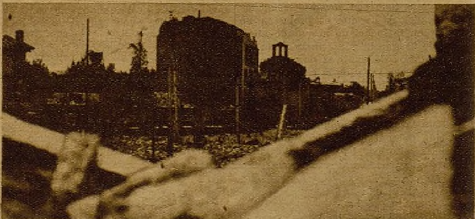
Hay que avanzar aún más. Frente a nuestras nuevas conquistas de Carabanchel todavía quedan reductos por conquistar