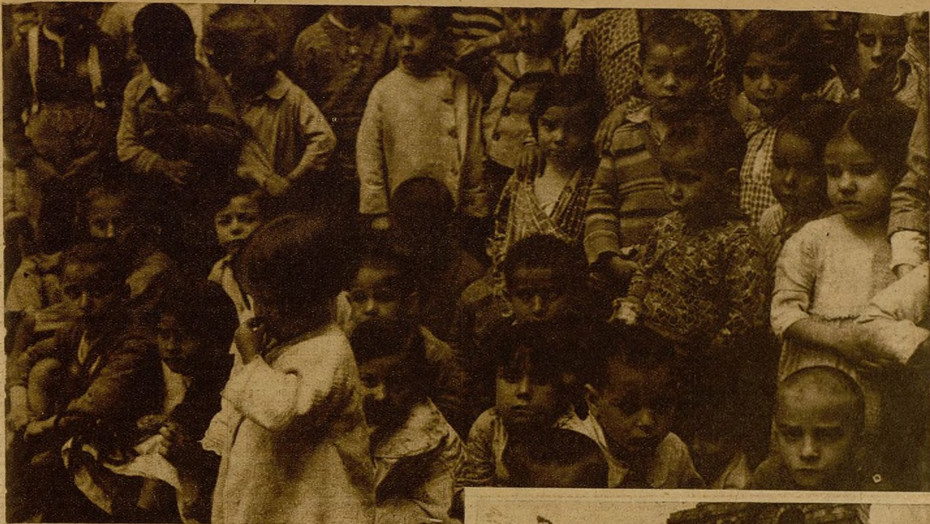
Estos niños hambrientos, enfermos, bajo el terror brutal de los cabecillas del Santuario, han constituido la muralla que ha permitido resistir a los facciosos meses y meses. Pero hoy, libres ya del pasado espantoso a que han estado sometidos, vivirán alegres y felices entre nosotros