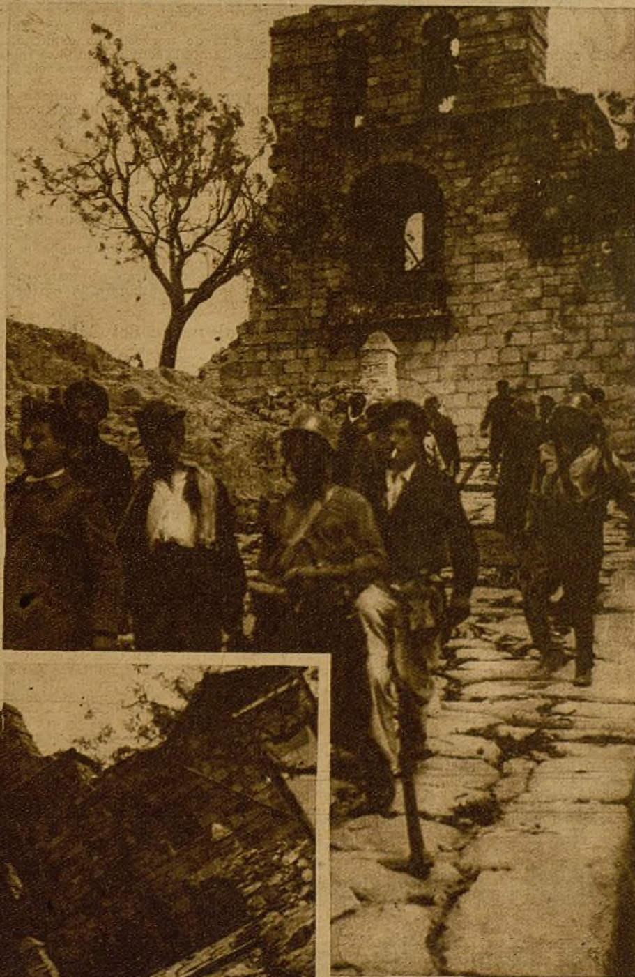
El mito de la resistencia se ha derrumbado. En la foto vemos a nuestros soldados trasladando las armas y municiones que almacenaba el Santuario