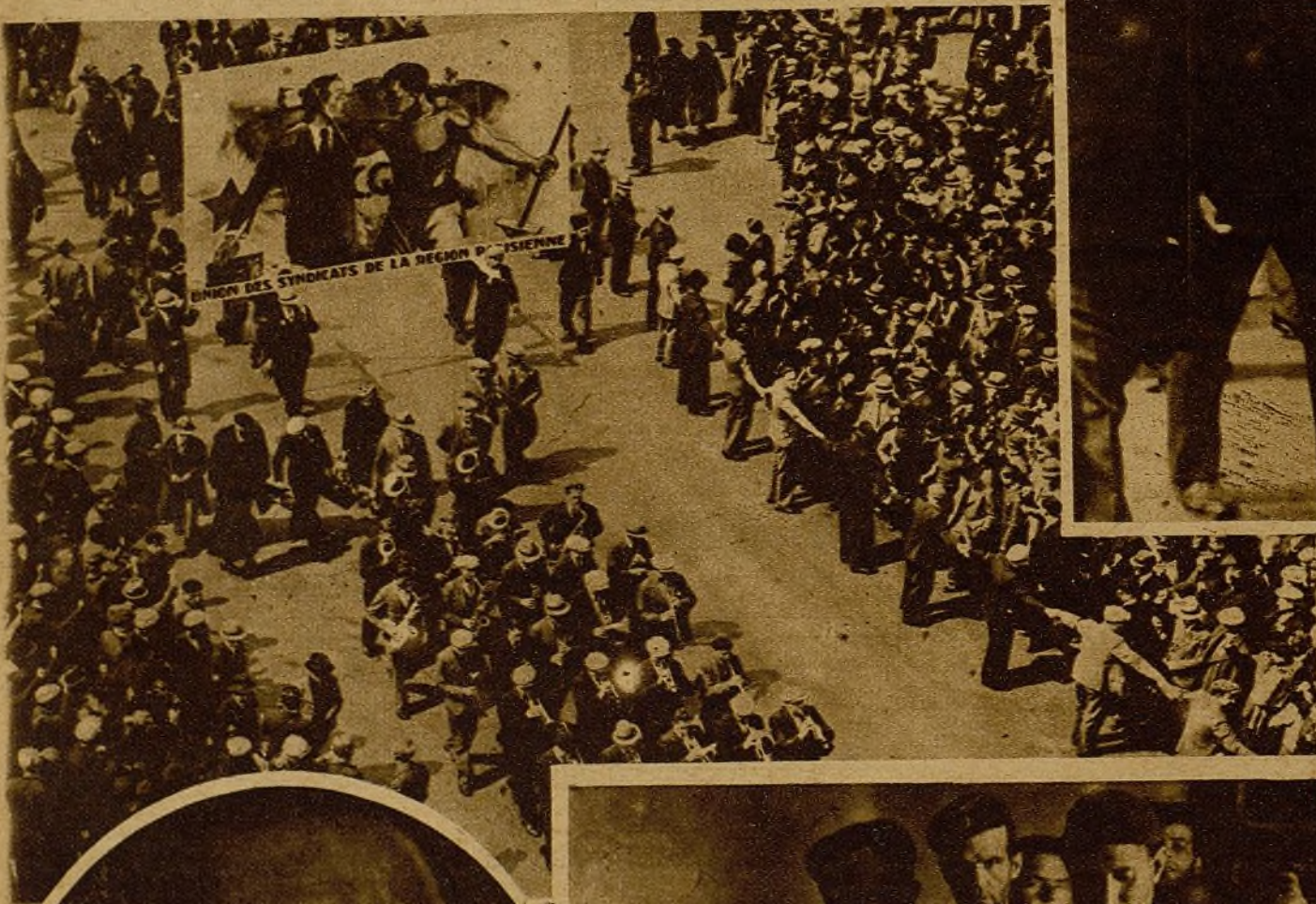
Todo el pueblo de París desfila en esta manifestación, convocada bajo la bandera de la ayuda a España