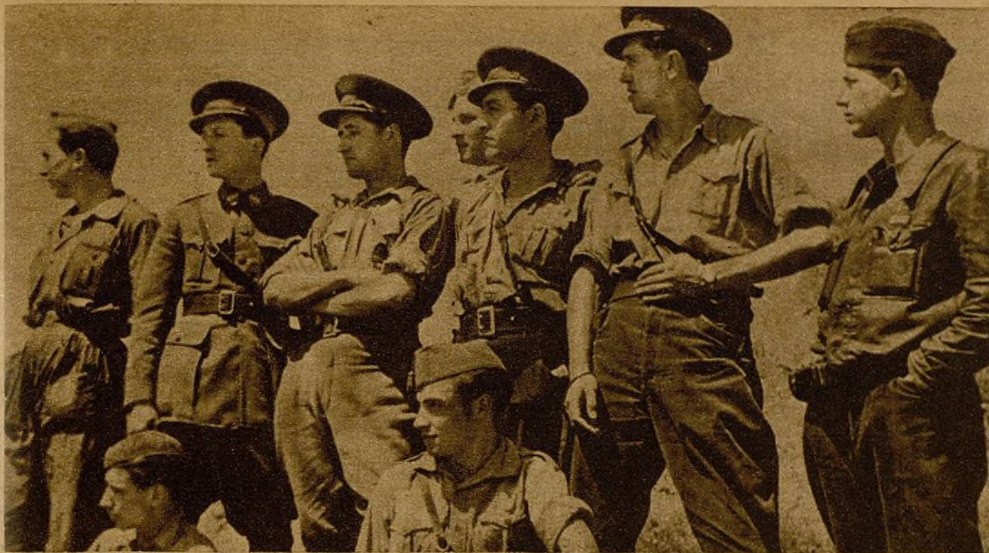
Oficiales del cuarto batallón de la 41 Brigada... Cuerpos jóvenes cruzados de cicatrices; ejemplos vivos del heroísmo de nuestra juventud... Cada galón sobre las gorras es un relato de sangre y audacia...