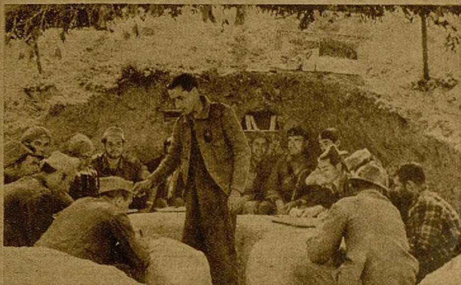
Mí mismo, a pocos pasos, está la primera línea. Pero, convenientemente situado, el rincón del combatiente es una pequeña isla donde el comisario, que antes era apuntador en un teatro, enseña a leer y escribir