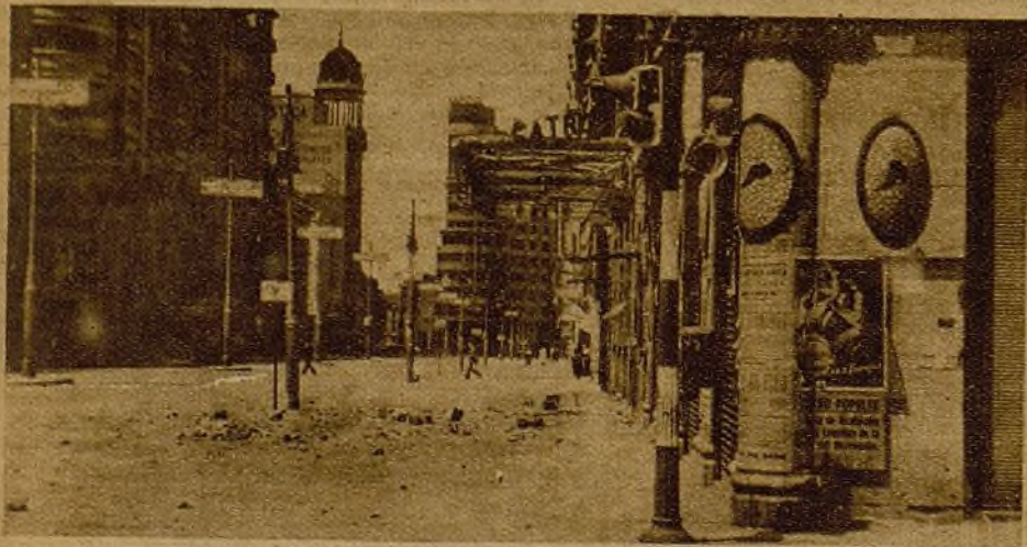
"¡El que tiene que caer, cae de todas maneras...!" Esta es la máxima fatalista que practican los audaces transeúntes que—a pesar de todo—pasan por la Gran Vía, que ahora tiene este nombre trágico: "Avenida de los Obuses"...