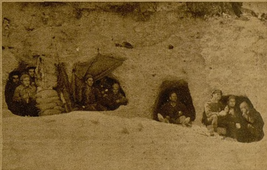
La hora del rancho. Las chavolas se han transformado en hoteles y "chalets". A la derecha, el "Hotel de los Abisinios", donde los camaradas se han caracterizado como súbditos del Negus