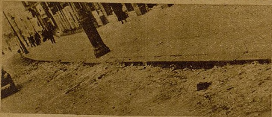
Cristales y sangre en las calles de Madrid. Doscientos diecisiete muertos y seiscientos noventa y tres heridos desde el primero de abril. Un pueblo entero que grita venganza y que se vengará