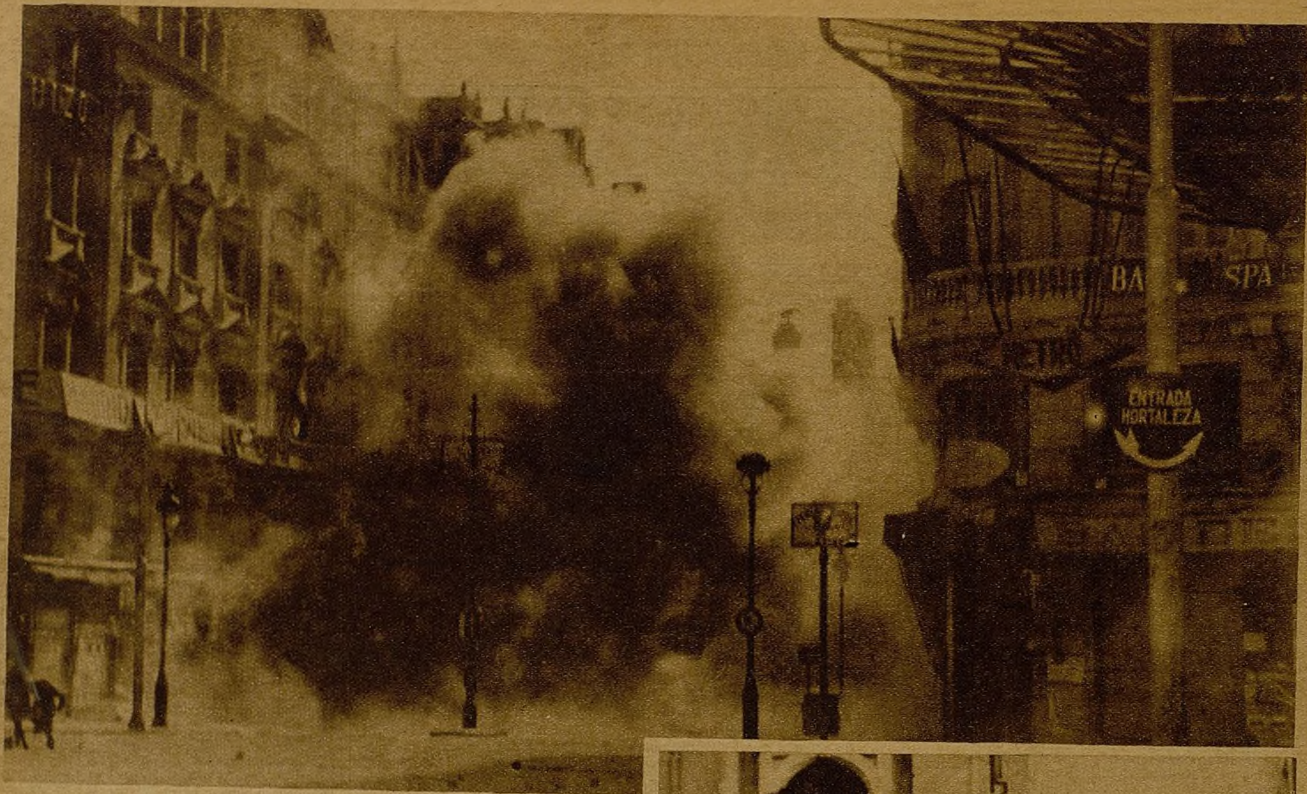
Sobre la ciudad más heroica del mundo, la cobardía criminal del Estado Mayor italoalemán continúa disparando los obuses de su fracaso impotente... (A la izquierda de la fotografía se ve a uno de los objetivos militares de Hitler—dos mujeres vestidas de luto—cayendo al suelo, alcanzadas por la metralla rasa...)