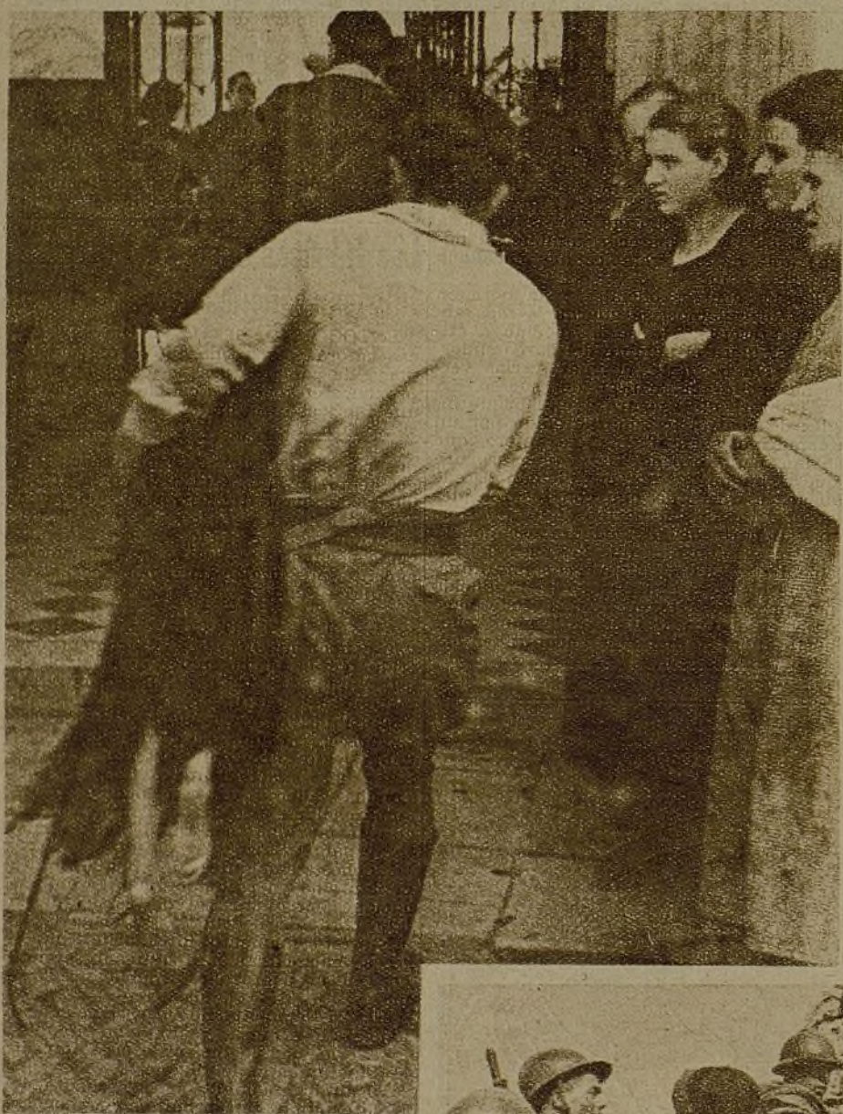
En brazos de uno de nuestros soldados, una niña descalza y hambrienta, una de las chiquillas que ellos retenían en el Santuario, sin duda para que hubiera una prueba más de hasta qué punto el fascismo representa el crimen y la cobardía, es conducida a un hospital de retaguardia...