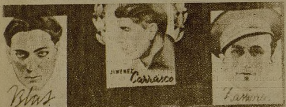
Pancartas en las calles de Madrid... La juventud exige el castigo implacable de los traidores. La J. S. U. del Sector Norte espera que toda la juventud recoja su llamamiento para aplastar conjuntamente a los rebeldes asesinos del pueblo