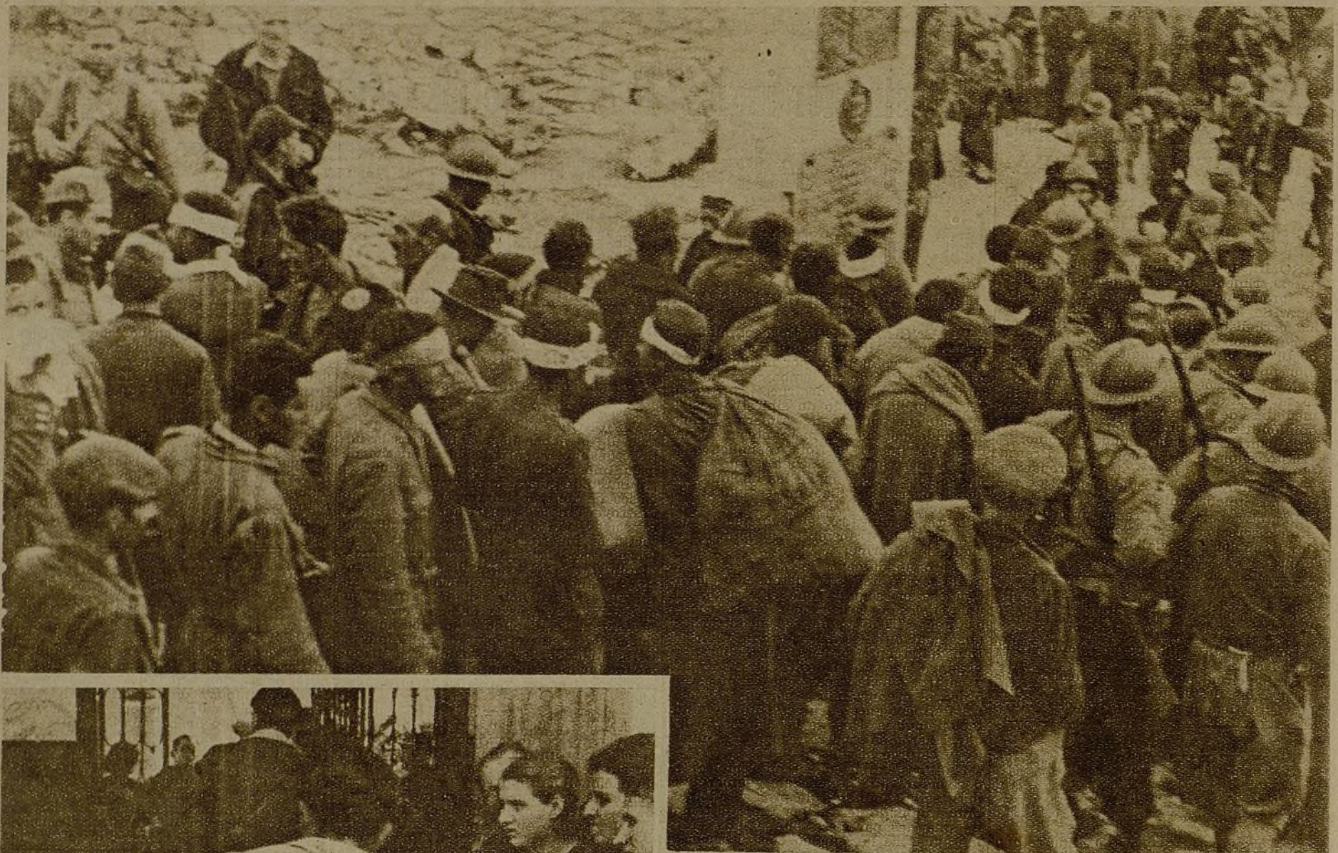
Guardias civiles heridos como consecuencia de la batalla del Santuario... Filas interminables de prisioneros llenos de hambre, de miseria y de enfermedades... Enemigos del pueblo que ahora, el Ejército del pueblo se lleva hasta los hospitales y Sanatorios