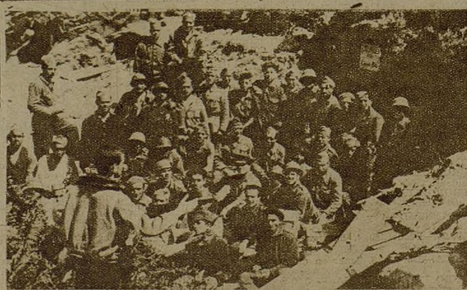
El comisario de la 17 Brigada mixta, en plena línea de fuego, atiende a la formación política y cultural de los combatientes. Así trabajan los miembros del glorioso Cuerpo de Comisarios