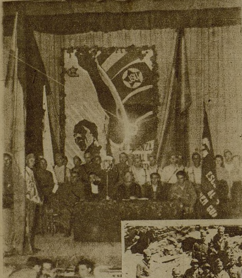
El glorioso batallón Joven Guardia ha celebrado un acto en el que sus combatientes, para ser fieles a los héroes caídos en la lucha, han prometido velar, cueste lo que cueste, por la Alianza Juvenil