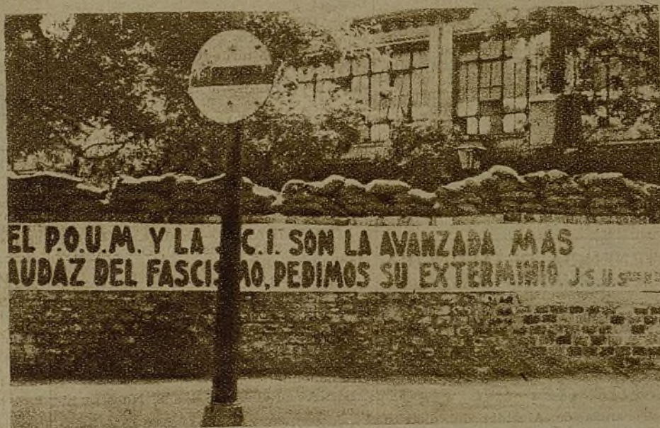
El pueblo señala ya con su dedo acusador a los verdaderos enemigos del pueblo: el P. O. U. M. y la J. C. I. "¡Aplastemos a estos traidores!", grita hoy la juventud heroica de Madrid