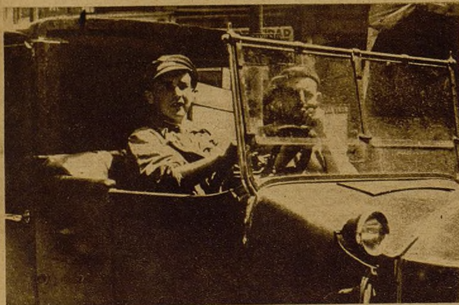
Todos los chóferes movilizados para las Brigadas móviles! Los valientes chóferes de Madrid, con toda su magnífica tradición de huelgas heroicas, salen alegres y audaces hacia los caminos del frente