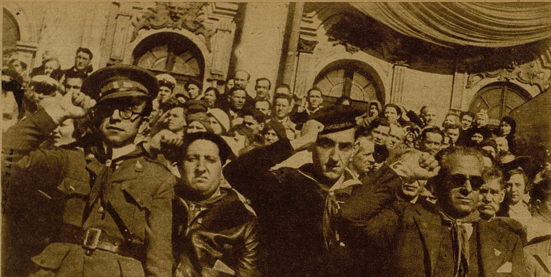
El Primero de Mayo en Moscú. Ante centenares de millones de trabajadores de todos los puntos de la inmensa Unión Soviética desfiló, siendo aclamada frenéticamente, nuestra Delegación a la gran fiesta del trabajo