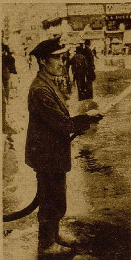
Empieza a llegar el calor. ¡Ya están aquí los hombres de las mangueras! Además de realizar una labor higiénica, ellos saben utilizar sus mangas contra el fuego que provocan los obuses constantes, mientras llegan—llenos de prisa—los coches de los bomberos