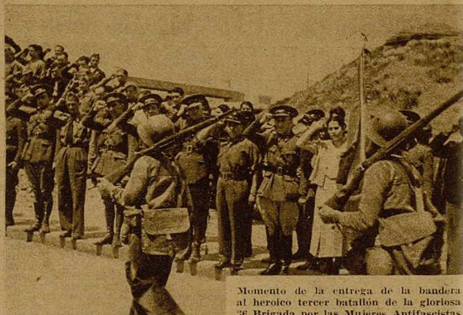
Momento de la entrega de la bandera al heroico tercer batallón de la gloriosa 36 Brigada por las Mujeres Antifascistas de Madrid, acto que constituyó una verdadera manifestación del alto espíritu antifascista de las mujeres madrileñas

Estados Unidos de América. Más de 50.000 trabajadores de las factorías de chocolate se levantan en huelga. El de las manos en alto es un viejo luchador que acaba de ser apaleado por los esbirros del capitalismo yanqui