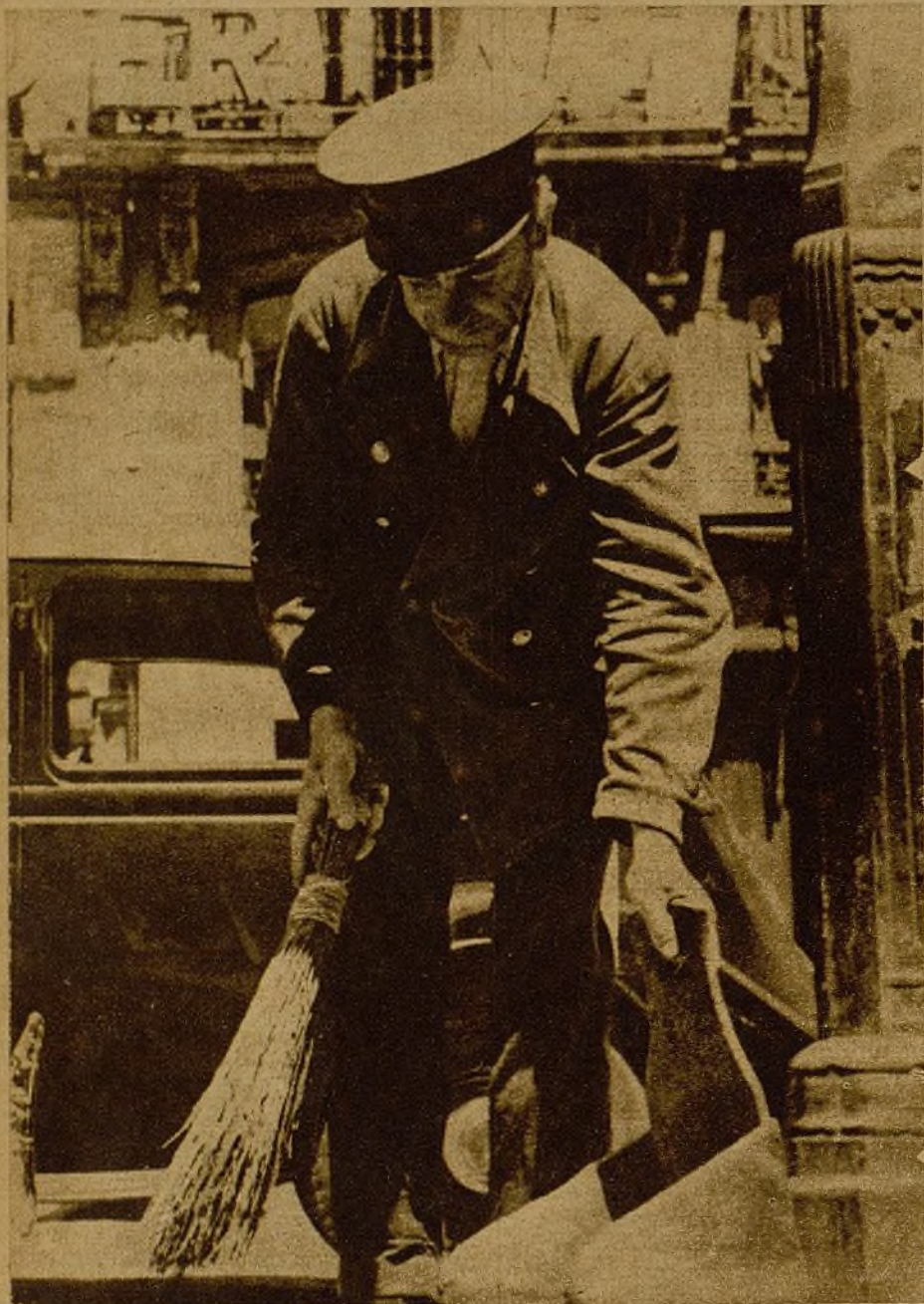
Los obuses de Hitler llenan las calles de Madrid de cristales despedazados. Este viejo barrendero ("¿Quién tuviera treinta años menos para luchar en las trincheras!") recoge cuidadosamente los vidrios, murmurando insultos encendidos contra Mussolini, el "Führer", Franco y sus respectivas familias