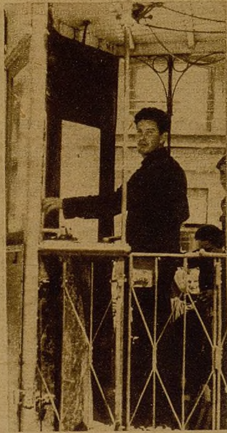
¡A pesar de los obuses! ¡A pesar de todo! Los tranviarios de Madrid han demostrado cumplidamente—sus listas de caídos lo prueban—su valor y su heroísmo anónimo llevando sus coches por las calles más batidas de nuestra ciudad en guerra