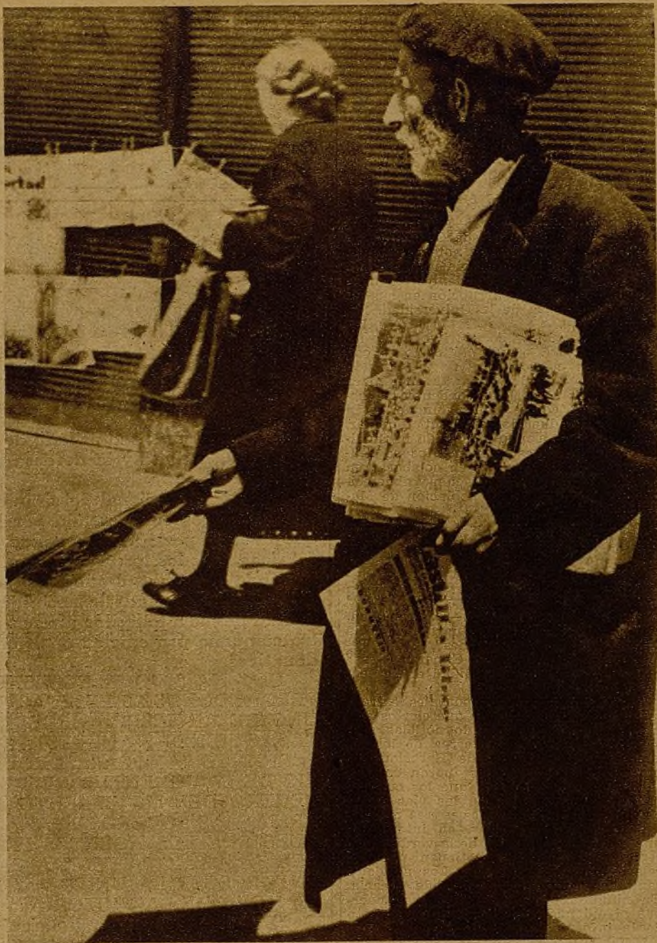
Entre las calles bombardeadas, siempre en pie y siempre con alegría, los vendedores de periódicos gritan victorias a los habitantes de la capital heroica: "¡Ha salido AHORA! ¡Con el nuevo avance de los "jabatos" de Lister! ¡Con la explicación de lo cerca que estamos de Toledo!"