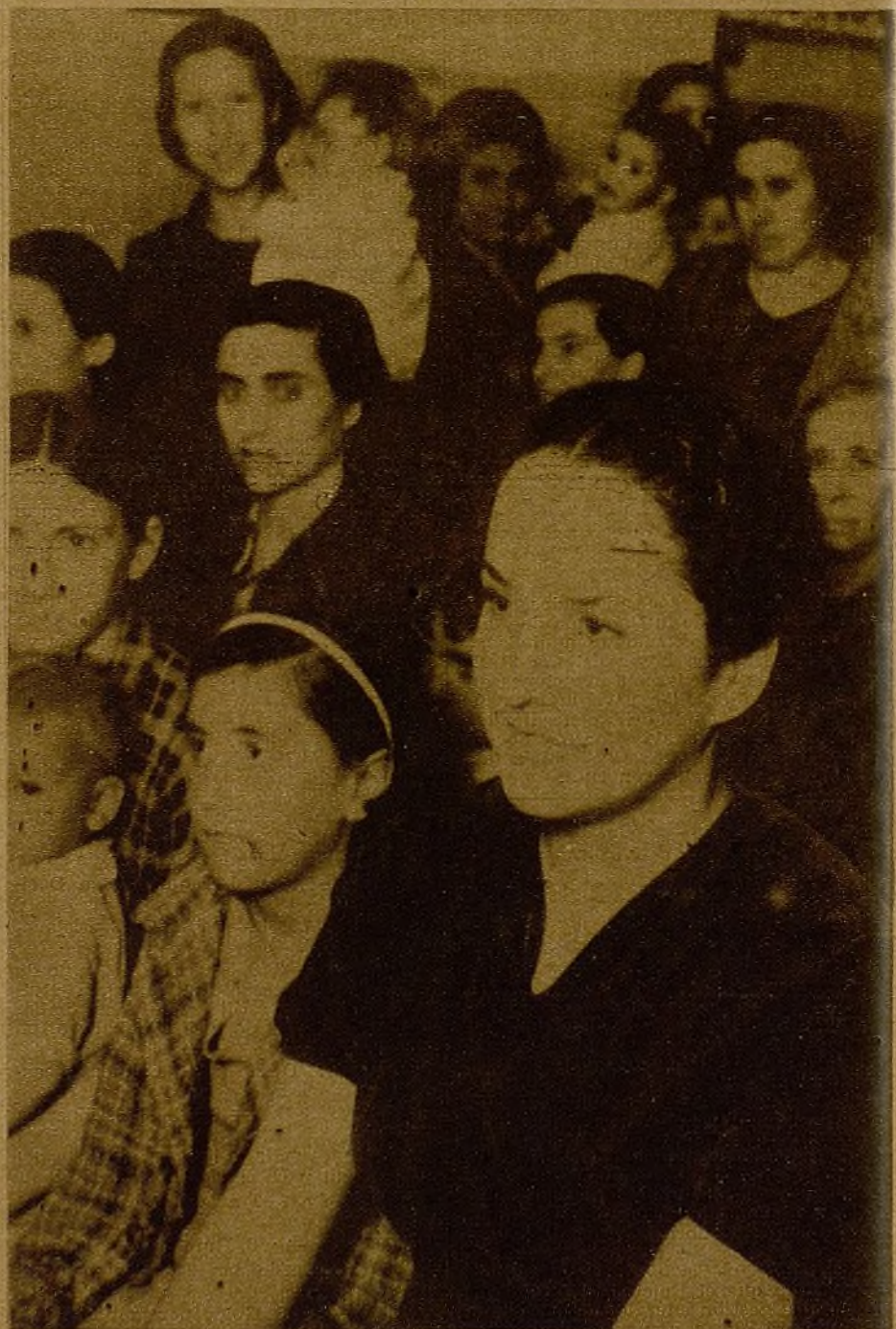
En el sector Este, y para la popularización de las consignas lanzadas en el Congreso de Muchachas, se realizan pequeños actos en los que se lleva a cabo, de un modo magnífico, la labor impuesta.

Las muchachas de Madrid, decididas a romper con una vieja situación de inferioridad innecesaria, activarán su reivindicación. Después de la Conferencia de Muchachas, continúan la labor de formación que ha de colocarlas en el verdadero puesto que merecen su trabajo y clara comprensión de los problemas