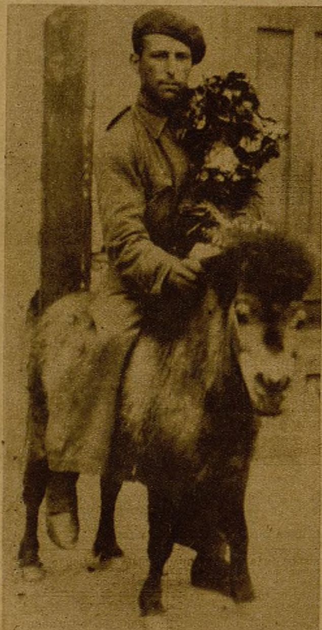
Caballo enano cogido a los fascistas en El Pardo. ¿Sería la montura que guardaba Franco para su entrada en Madrid, y que se ha decidido a entrar solo en vista de que con jinete iba a quedarse siempre fuera?

Una gran inquietud en el terreno diplomático se refleja de inmediato en una serie de viajes, de fotos a caras sonrientes, mientras están en juego los intereses de distintas naciones. La entrevista entre Mr. Eden y el representante belga ha sido una de las muchas celebradas en estos últimos días de inquietud internacional