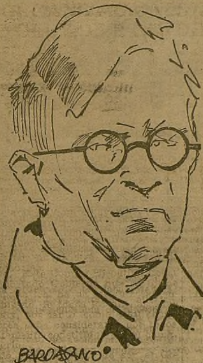
Julio Alvarez del Vayo sigue siendo el representante de España en la Sociedad de Naciones.

El señor Eden suspendió su discurso para proseguirlo en la sesión que se celebrará el próximo viernes.—Fabra.