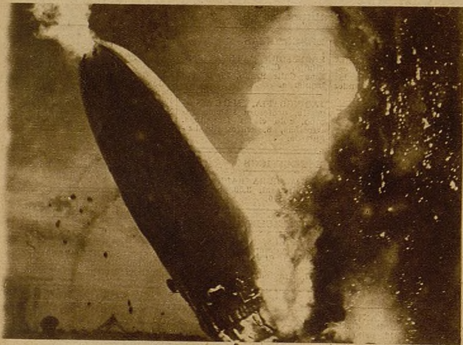
La explosión del dirigible "Hindenburg" ha puesto de manifiesto el fracaso a que se exponen los triunfos de la técnica alemana bajo la dictadura "nazi"