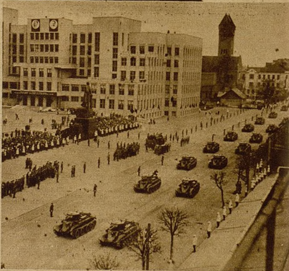
Los heroicos soldados de nuestro Ejército popular luchan con heroísmo y abnegación. Ellos saben que, a pesar de las claudicaciones vergonzosas de las democracias, un pueblo fuerte y libre está a nuestro lado: la Unión Soviética