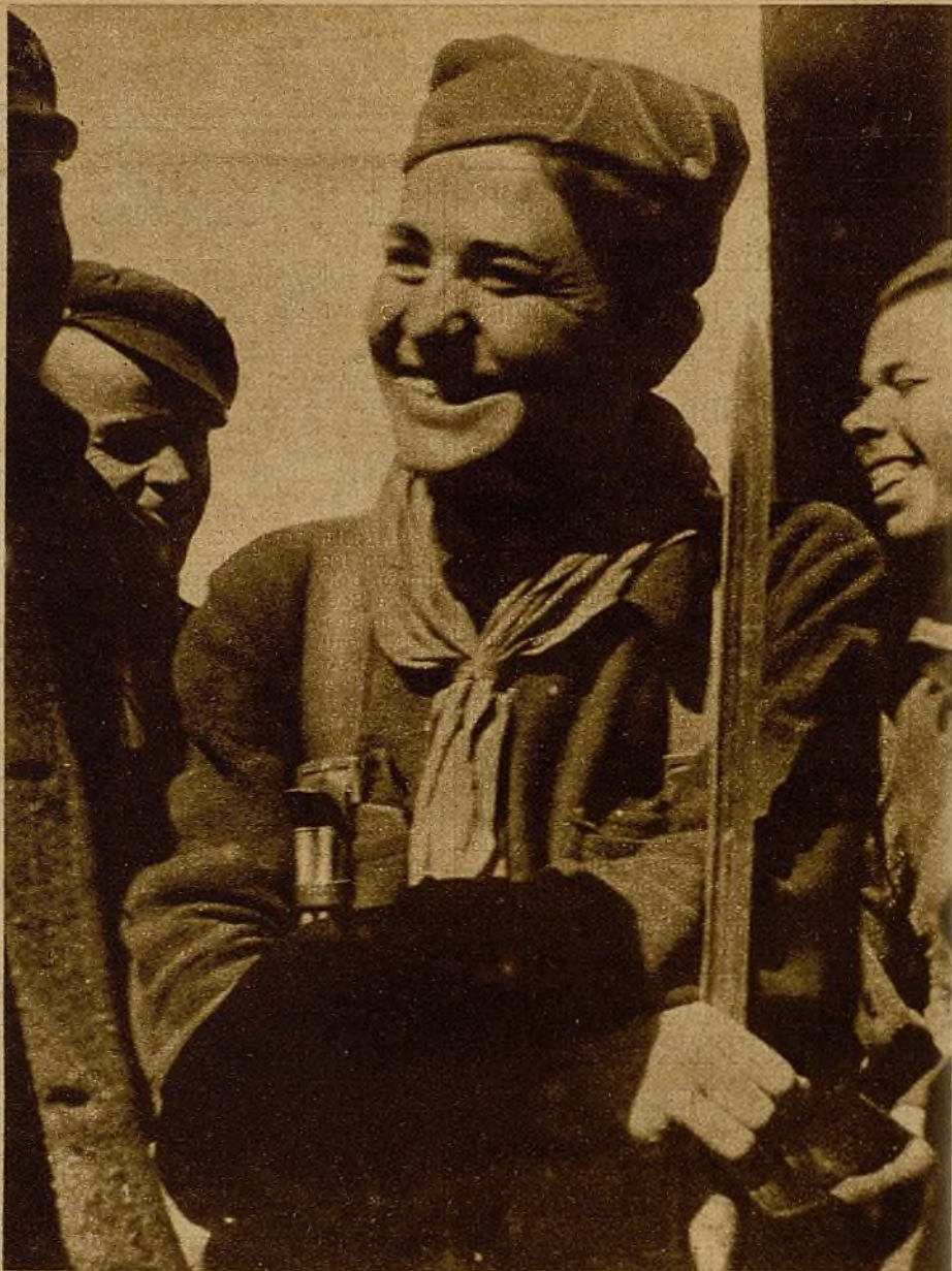
Caras alegres, llenas del vigor y optimismo de nuestra gloriosa Juventud, la que ha dado al mundo, con su conducta, una demostración de la capacidad y preparación que posee en España