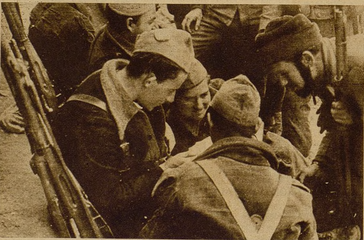
Se ha leído ya varias veces, pero no importa; las cartas guardan siempre una nueva alegría que compartir entre los compañeros a los que se está fuertemente unido por la guerra diaria