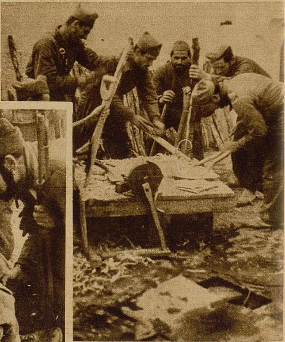
En el frente no siempre se combate, lo conquistado en la lucha debe dejarse afirmado y a cubierto de sorpresas. Al fusil le sustituyen las herramientas, pero nunca la inactividad