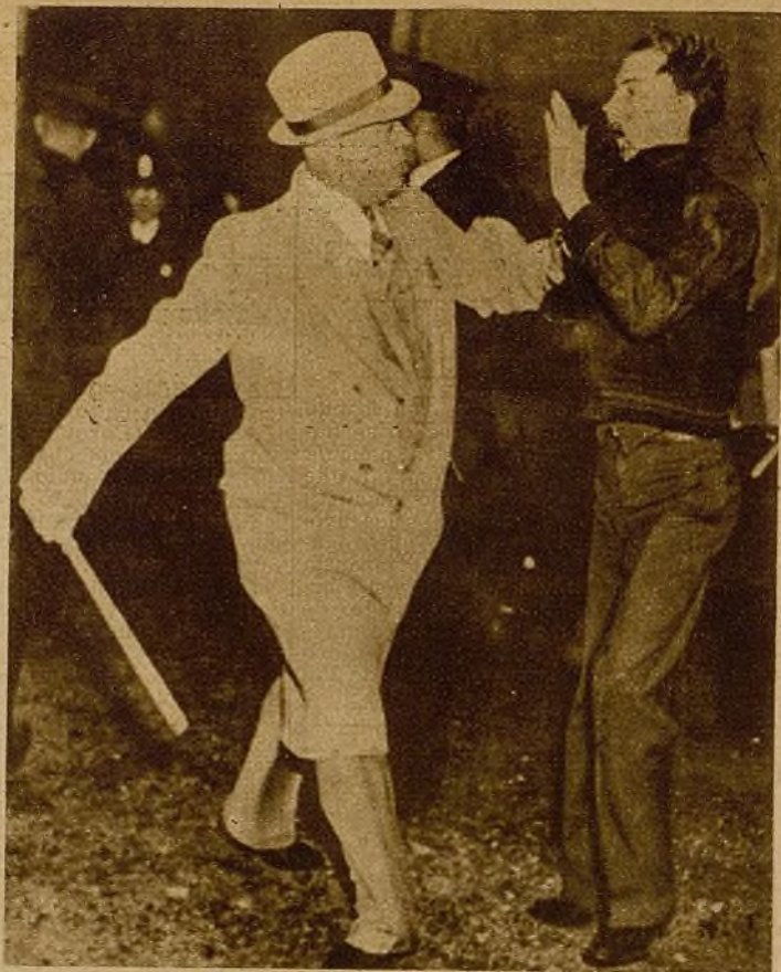
La Policía yanqui, en las últimas huelgas, emplea sus métodos tradicionales de persuasión sobre los obreros