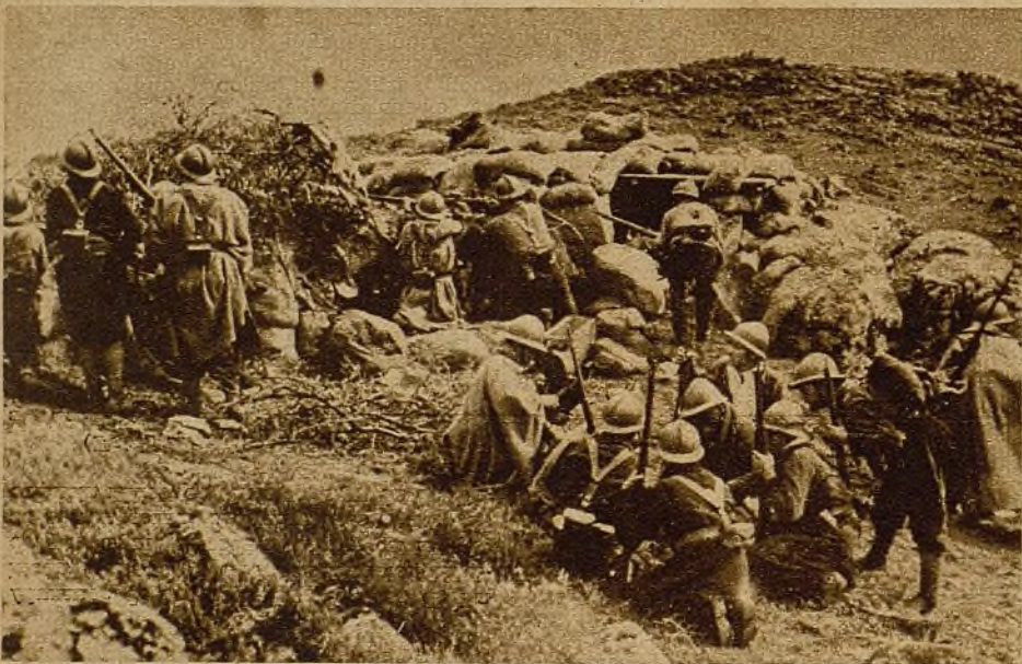
Sobre la tierra dura y seca, aprovechando los menores accidentes del terreno para apoyar sus avances, los soldados del Sur disminuyen sin cesar las garras enemigas

La juventud que lucha en los frentes del Sur pide, con su ejemplo, la ayuda a los que defienden Bilbao.