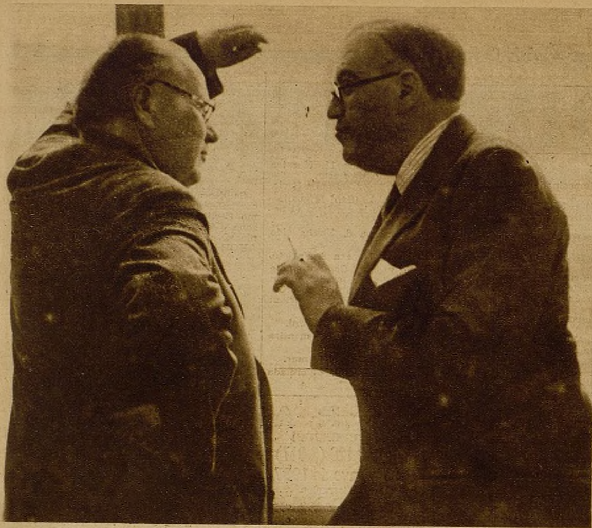
Alvarez del Vayo, una vez más, ha hecho oír con firmeza y con autoridad en Ginebra la voz de la España que lucha contra los invasores. En la foto vemos al camarada Alvarez del Vayo conversando con Litvinov, representante en Ginebra de un gran pueblo amigo de nuestra España: la Unión Soviética