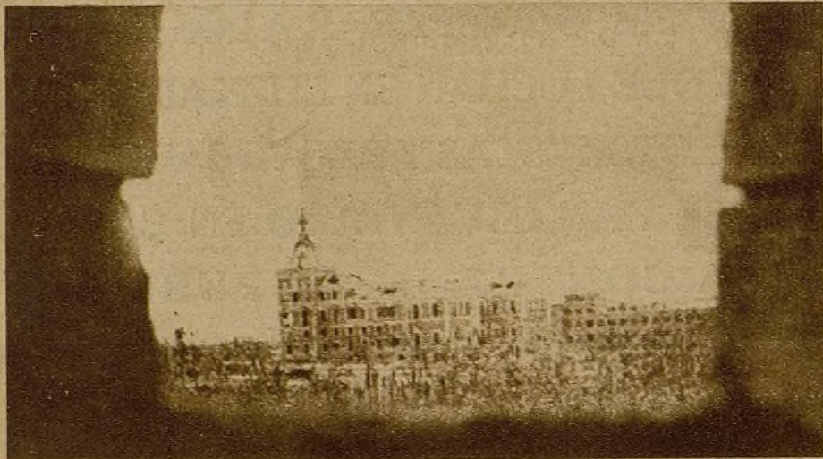
Edificio que la metralla y la dinamita muerden diariamente. "La Casa de Velázquez—como dice la copla popular—se cae ardiendo, con la "quinta columna" metida dentro"