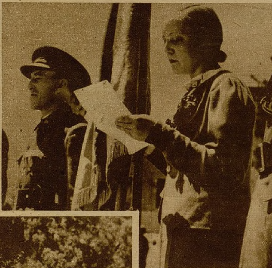
Acto de la entrega de la bandera que la Célula de Espasa Calpe ha dado a la Brigada mixta, y en cuya ocasión se dió una fiesta en honor de las fuerzas