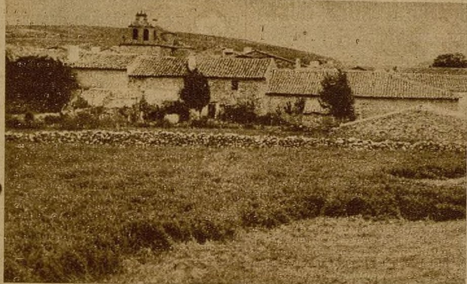
Sacecorbo—uno de los siete pueblos recién conquistados—, a veintidós kilómetros de Cifuentes...

A las seis y media de la mañana había concluido la operación. A las tres de la tarde, los hombres de Transmisiones habían enlazado con comunicaciones telefónicas los siete pueblos y las nuevas posiciones... A las cinco de la tarde esta-