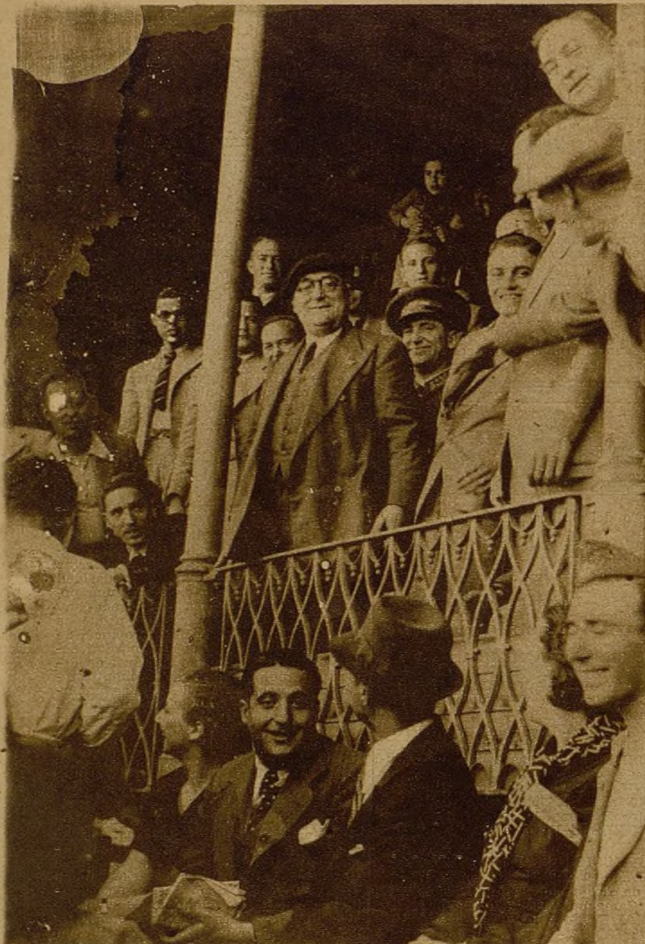
El general Mlaja asistió en Valencia a un festival taurino que se celebró en su honor y a beneficio de los hospitales de sangre. El público aclamó al jefe de la heroica defensa de Madrid