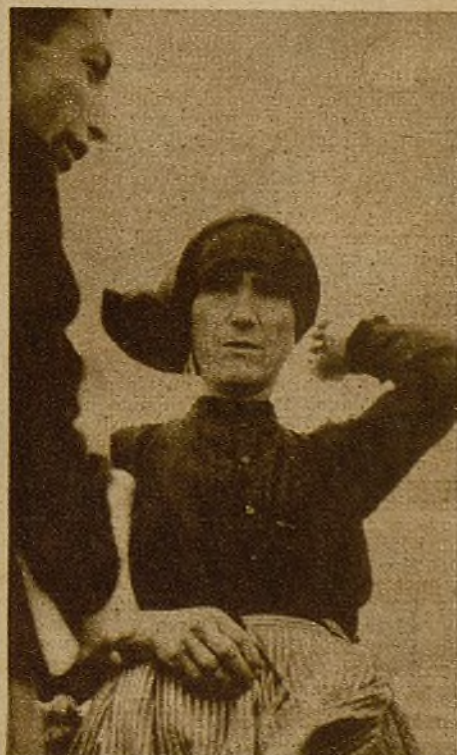
La vieja campesina de Sacecorbo cuenta sus recuerdos: "Vinieron unos hombres que hablaban en extranjero..."