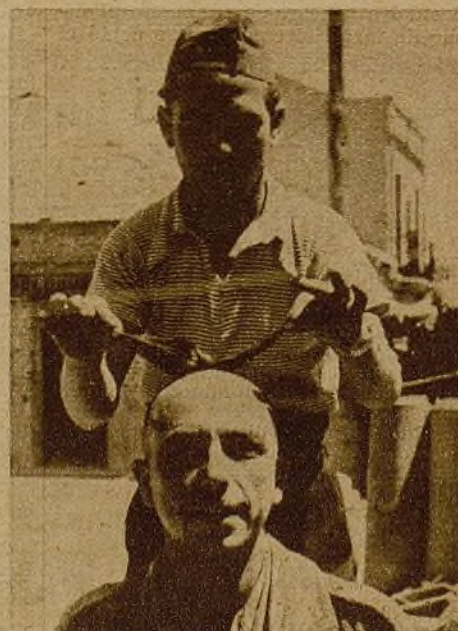
Los peluqueros han comenzado un duro trabajo en las trincheras, y con las cabezas peladas han venido una serie de originalidades donde compiten las imaginaciones de cada cual