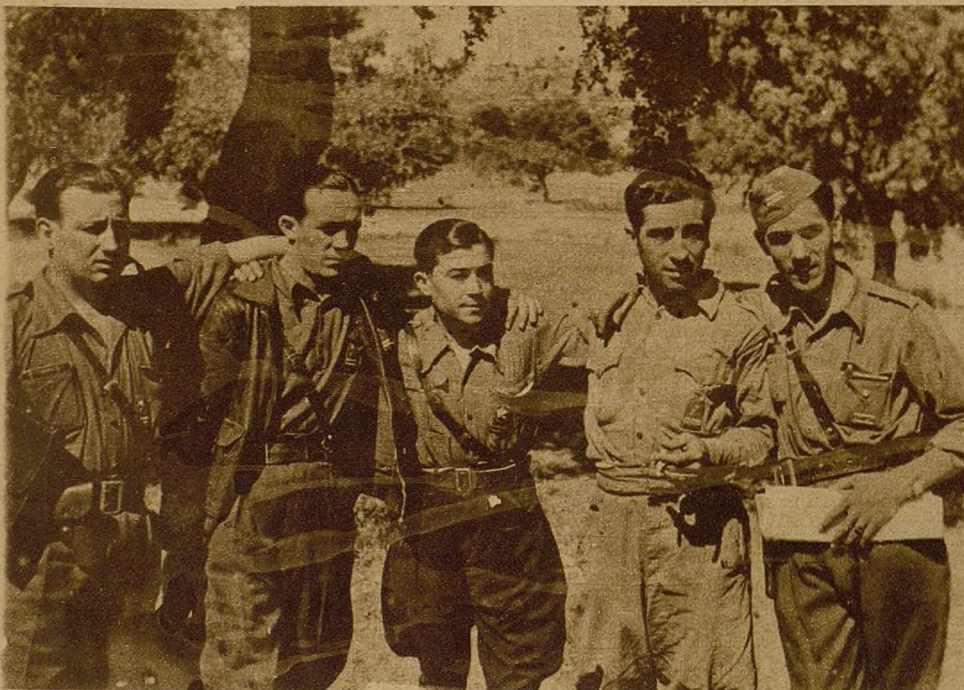
Jefes y oficiales pertenecientes a la 39 Brigada, quinta División, que han llevado a cabo en estos últimos días importantes hechos en el frente de Madrid