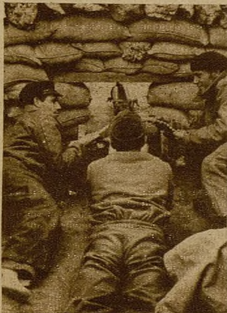
Los hombres han fortificado ya las nuevas posiciones... Sobre las cumbres, las ametralladoras enfilan el llano...