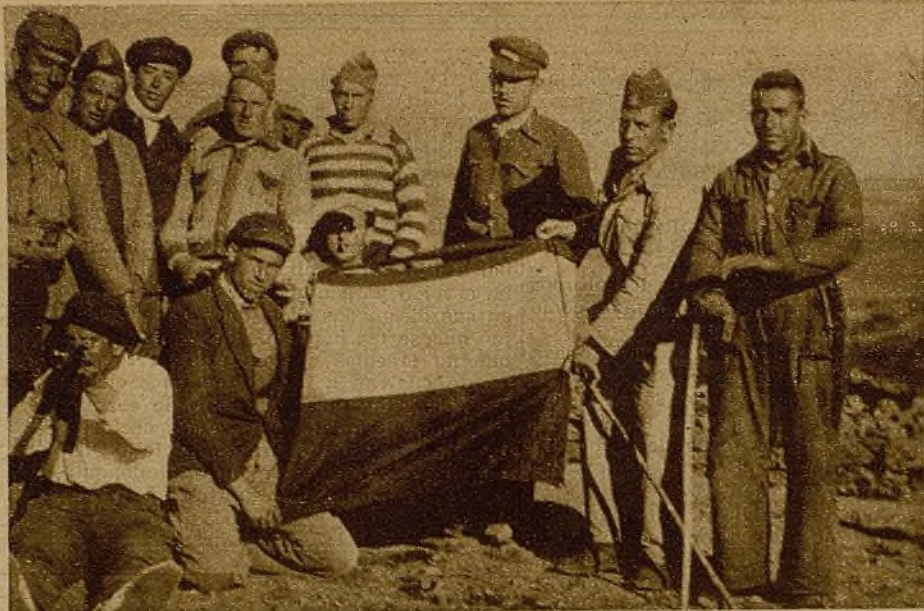
En Paredes de Buitrago, y durante las últimas operaciones, los soldados del pueblo arrebataron al enemigo la bandera que muestran en la foto