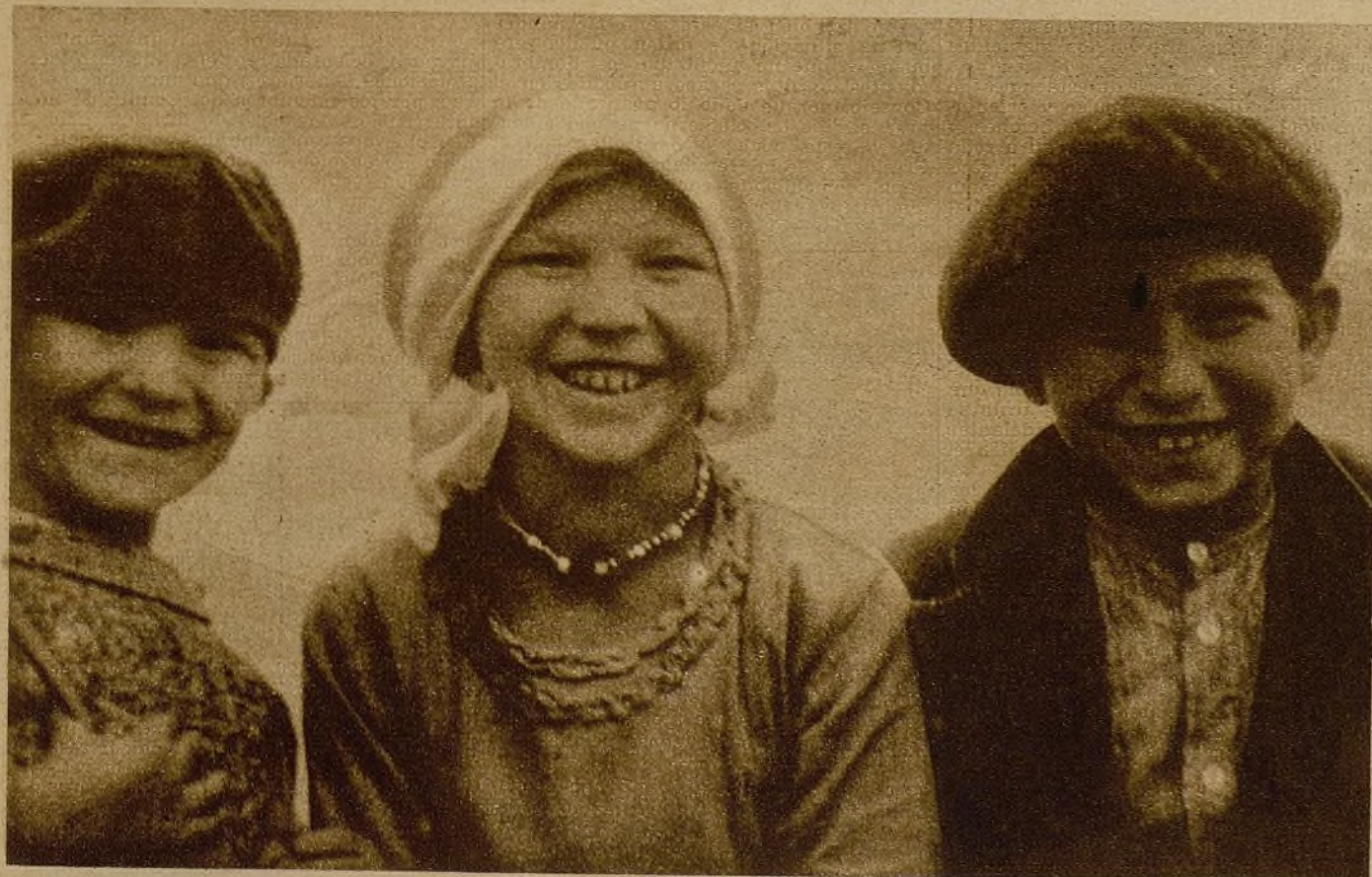
Niños aldeanos que sonríen a los soldados del Ejército del pueblo... Chiquillos que levantan sus pequeños puños fervorosos ante los conquistadores, entre los que hay también muchos campesinos...