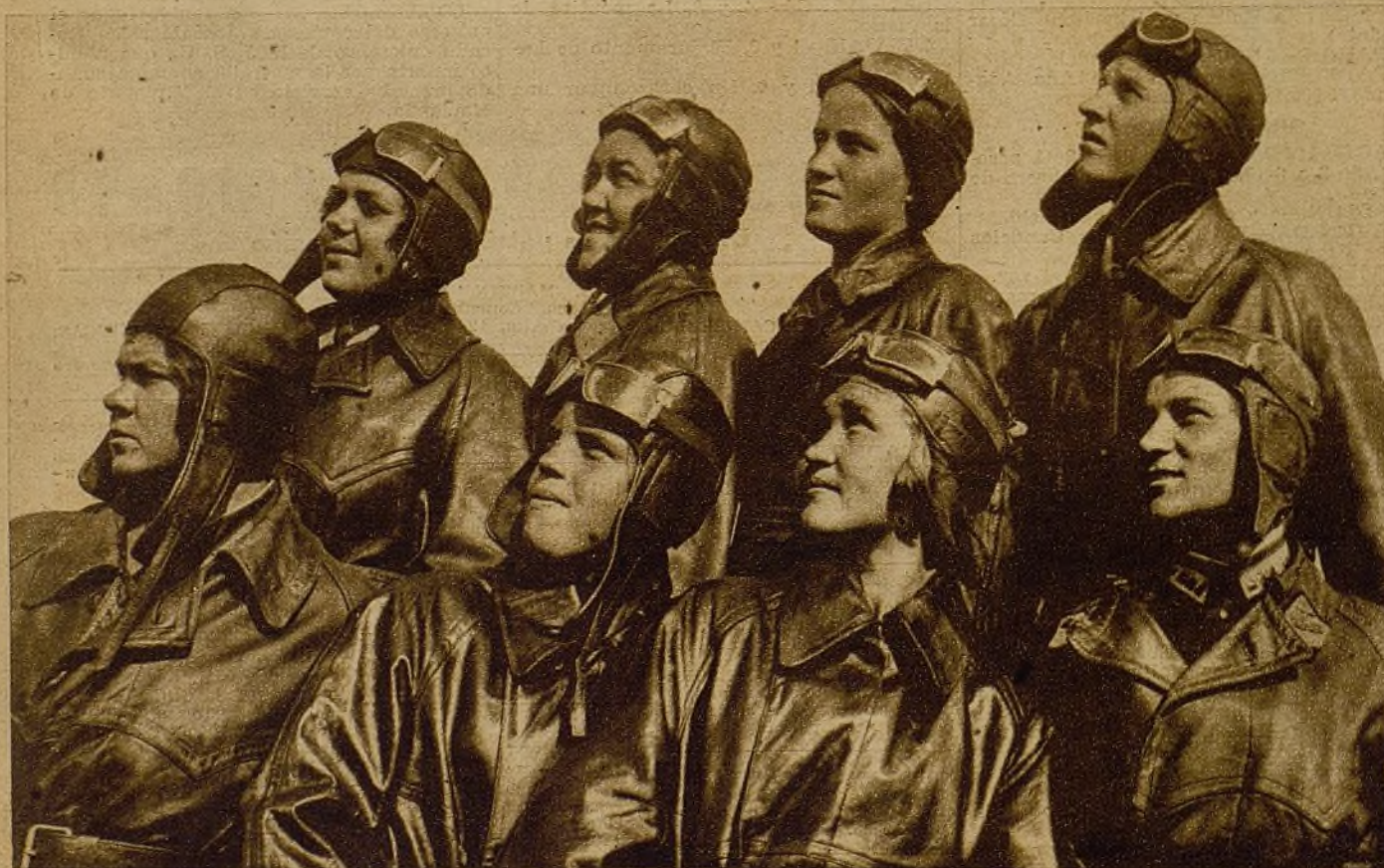
Esta es la heroica juventud soviética, que ha dado nuevas glorias a la Aviación y a la ciencia de la U. R. S. S. al clavar la bandera del Socialismo en el Polo Artico