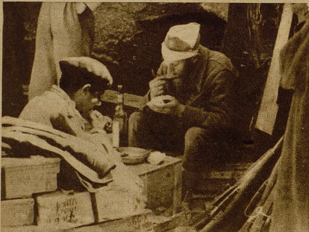
Cuando no hay tiros se pueden hacer muchas cosas... Una de ellas ésta tan importante: comer, aunque sea con un dulce acompañamiento de balas altas...