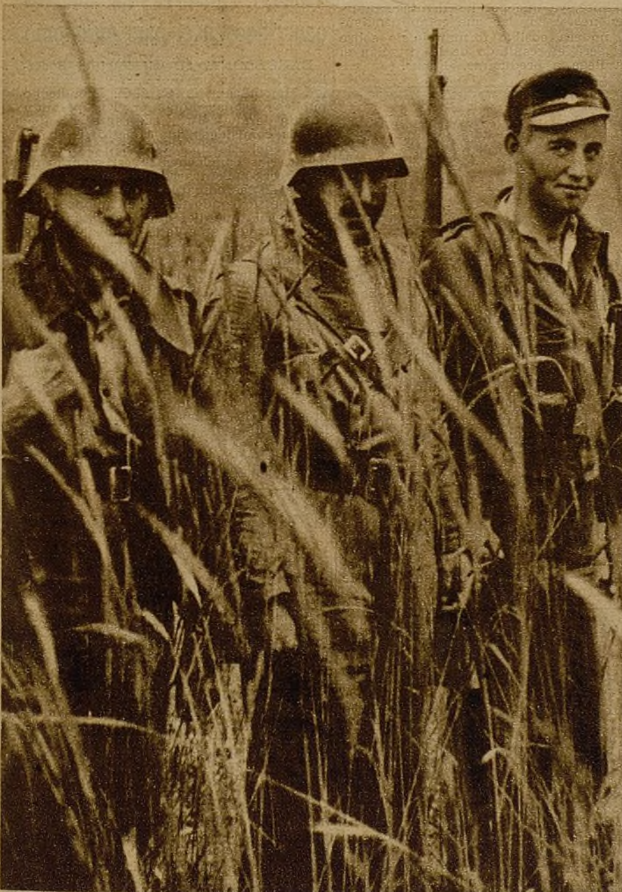
Trescientos sesenta kilómetros cuadrados de tierras de cultivo han sido ocupadas por nuestro Ejército. Entre los trigos altos pasan los soldados del pueblo...