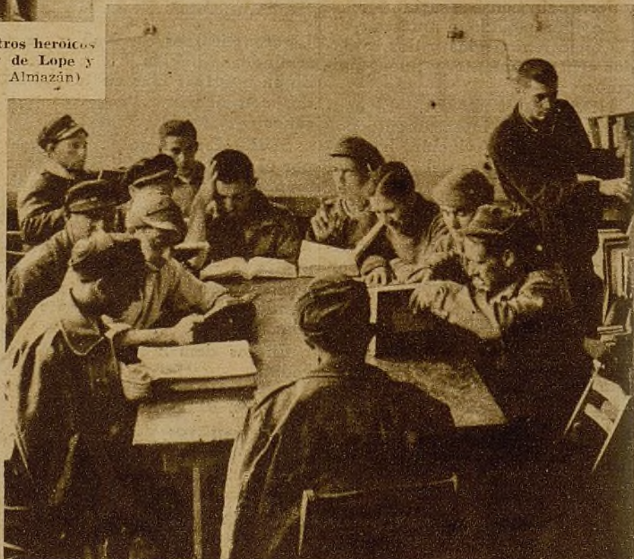
Y también se lee y se estudia... El Hogar del Soldado—claro y limpio—está siempre repleto de combatientes que aprenden allí cosas que no supieron nunca, y que saben que la cultura de nuestro Ejército es una de las bases de la victoria...