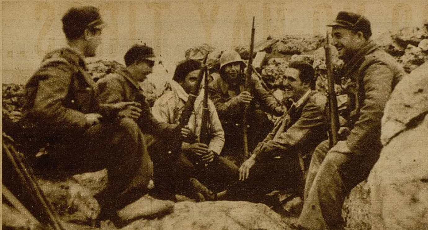
En las posiciones recién conquistadas, los gloriosos soldados de la 72 Brigada comentan con risas la carrera conjunta de civiles, requetés y falangistas...