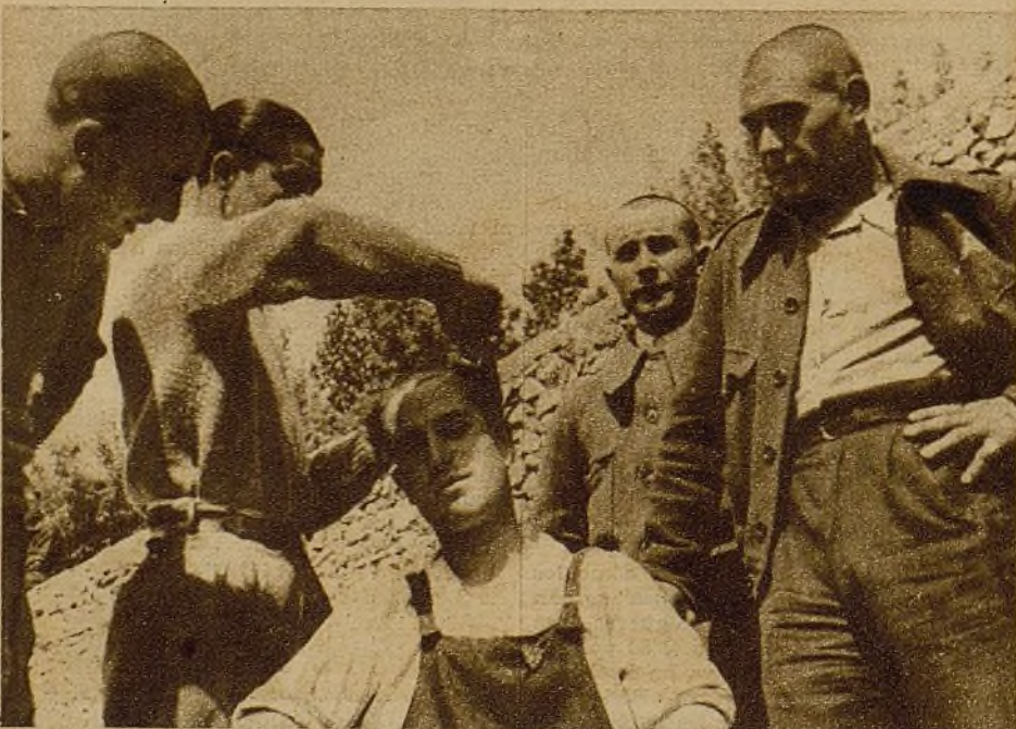
La consigna es dura, pero justa: "Contra los "trimotores": ¡Mueran las elegantes cabelleras!" Los que ya se pelaron se consuelan contemplando la tristeza de la nueva víctima...