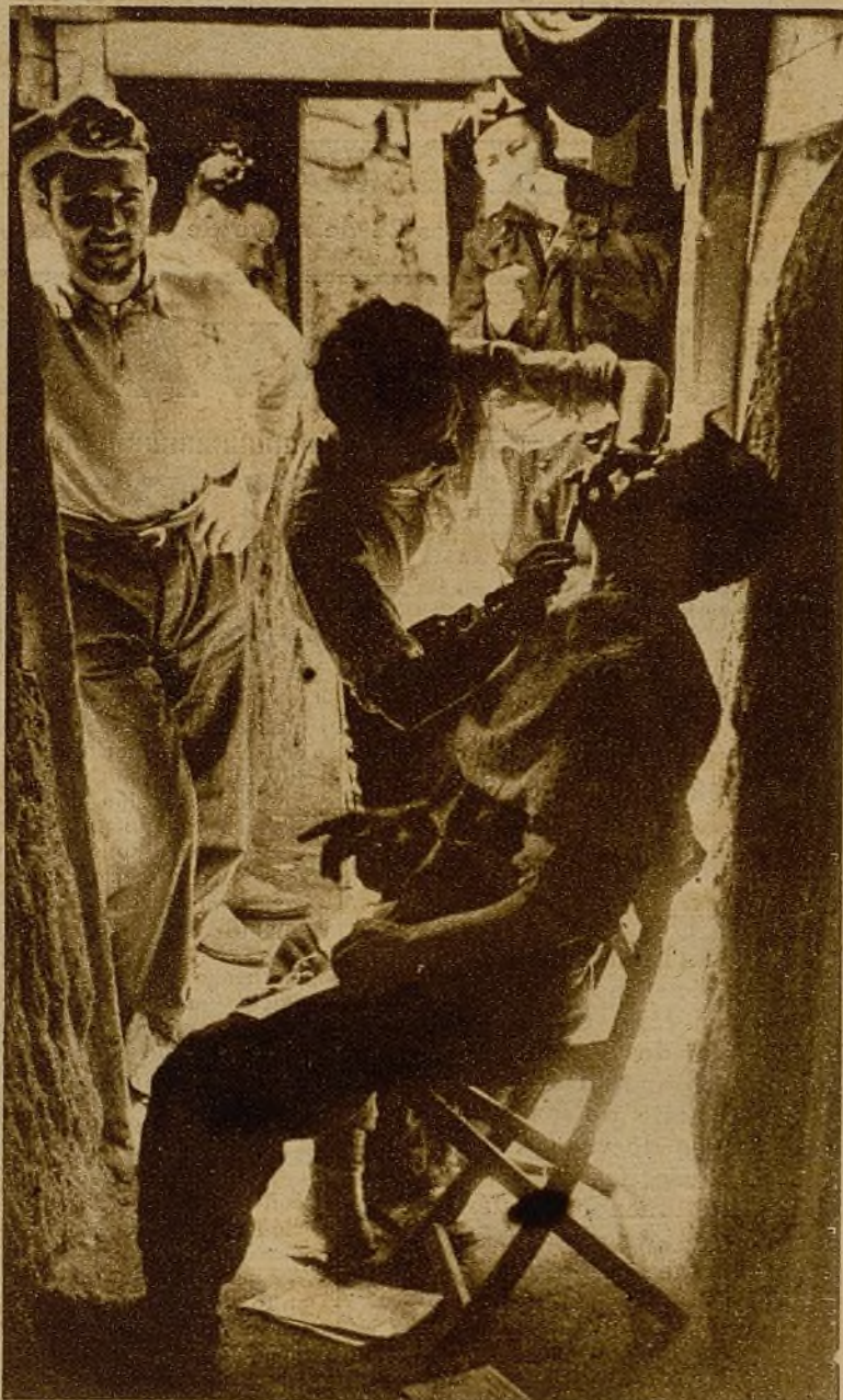
En plena primera línea, el barbero afeita caras veteranas. Para que los soldados alean bien la cabeza se ha colgado un retrato de una chica guapa enfrente del cliente... Así—contemplando el retrato—está asegurada la quietud, a prueba de los peores cortes...