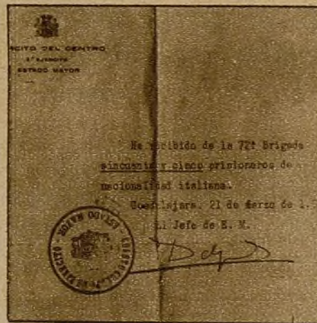
He aquí un curioso documento que habla de conquistas pasadas. Entonces—como ahora—la 72 Brigada se portó también con un heroísmo ejemplar...