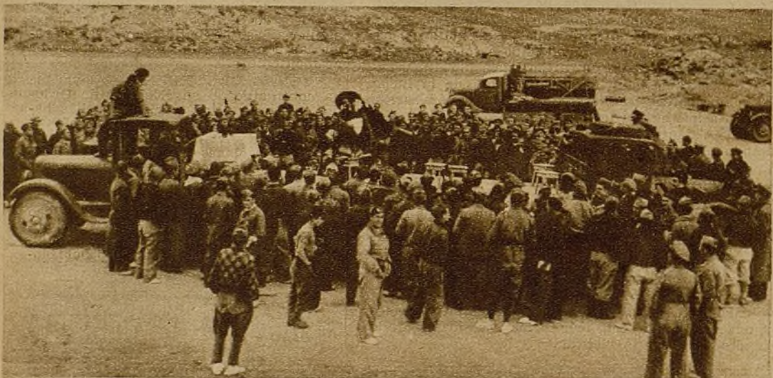
El Teatro Escuela de Arte representa entremeses clásicos en segunda línea... Nuestros heroicos veteranos ríen y disfrutan ante la gracia desenfadada y el hondo sentido popular de Lope y Tirso...