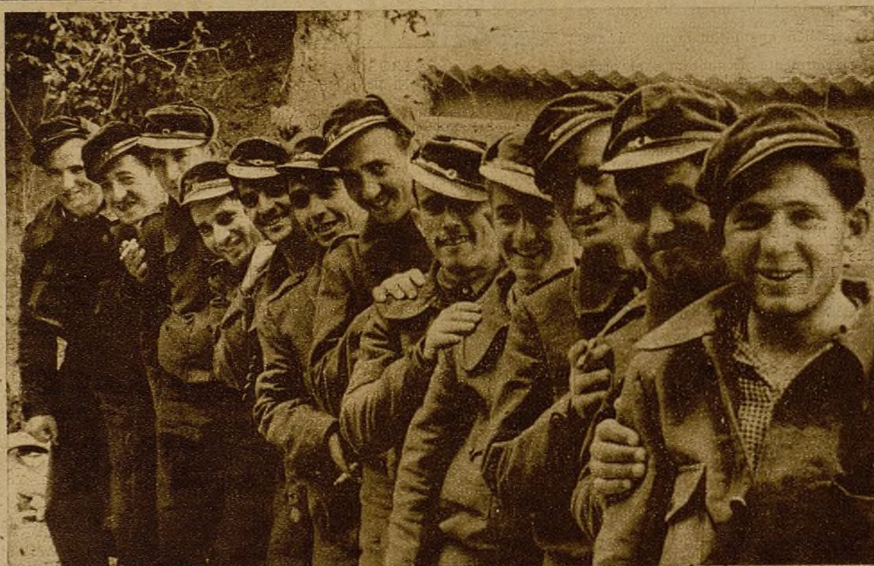
¡Pasen, camaradas, pasen!... Los obuses acechan. Pero no hay que temer. En el establecimiento se está tan seguro como en una trinchera