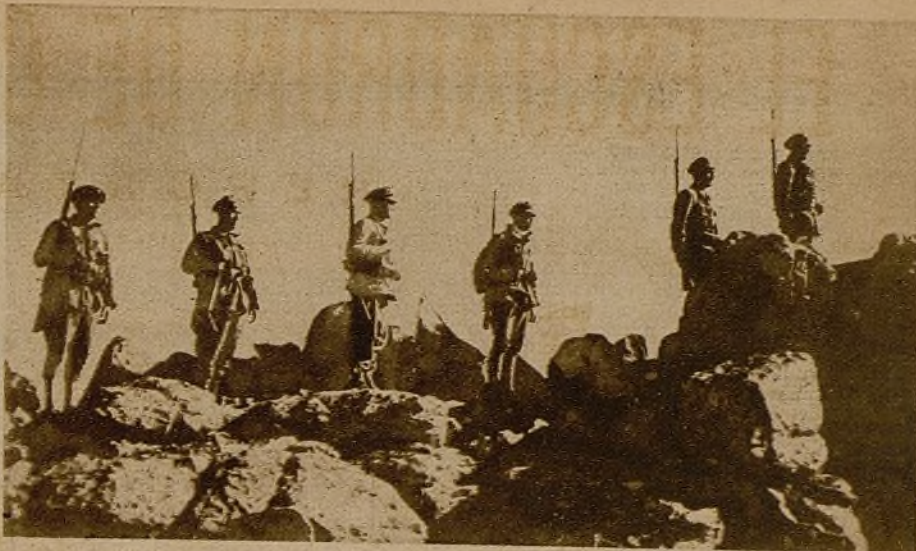
Una completa vigilancia mantiene a cubierto de posibles sorpresas, y compenetra con el terreno que, en un momento dado, será el camino del ataque