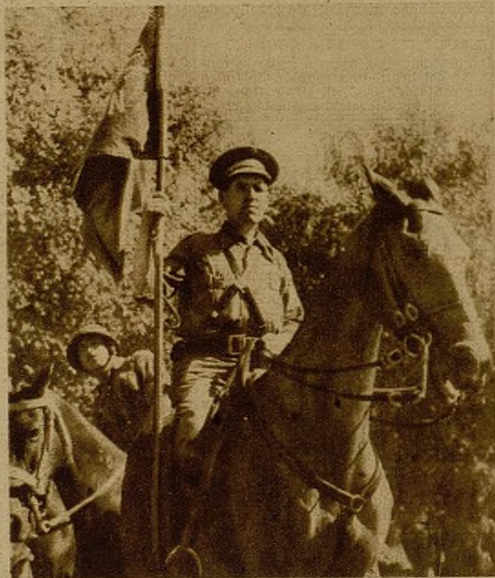
El abanderado muestra orgulloso el nuevo estandarte entregado a la octava División