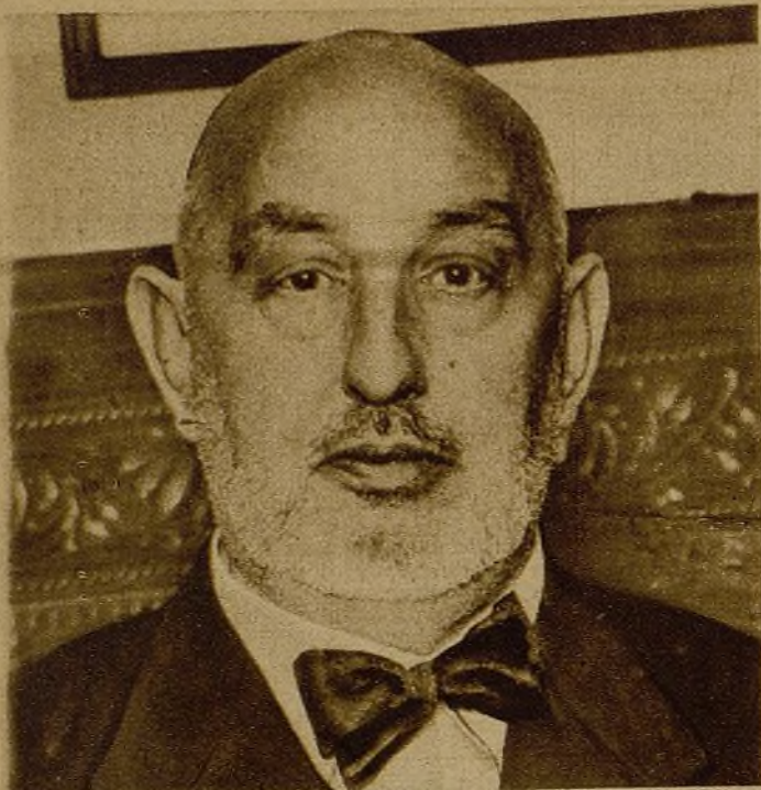
Don Angel Ossorio y Gallardo, nuevo embajador de España en Francia