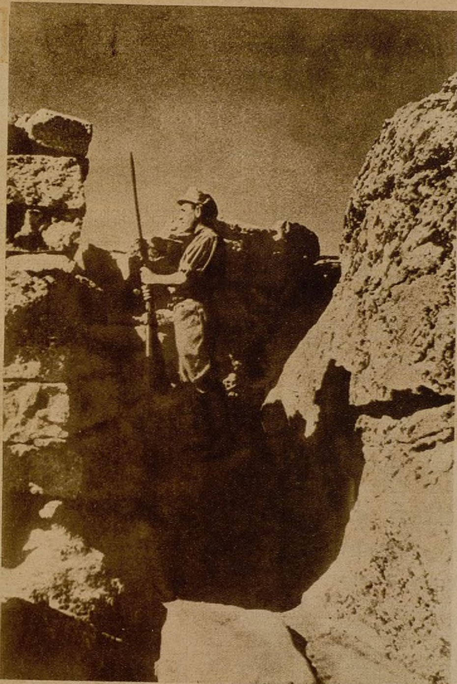
En los picos, entre las rocas, y teniendo a los pies pueblos que pronto han de ser rescatados por estas mismas armas vigilantes