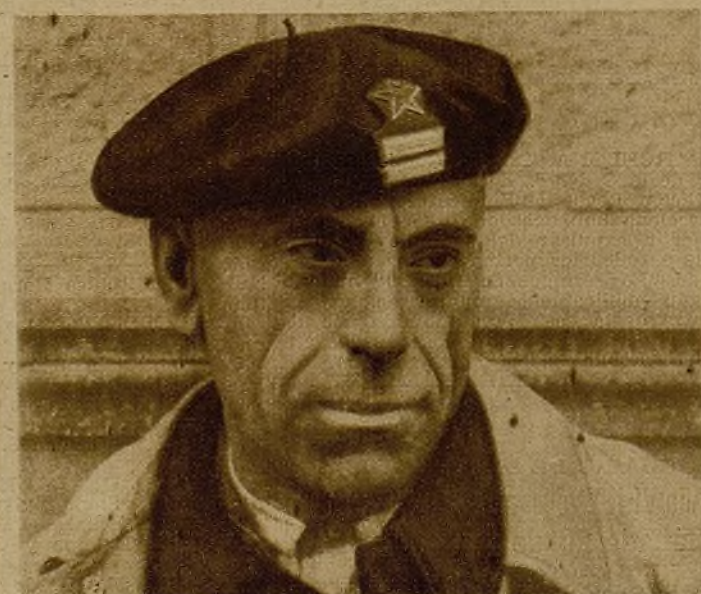
El teniente coronel Ortega, nuevo director general de Seguridad. En sus manos firmes va a estar la dirección del orden público en toda la España leal.