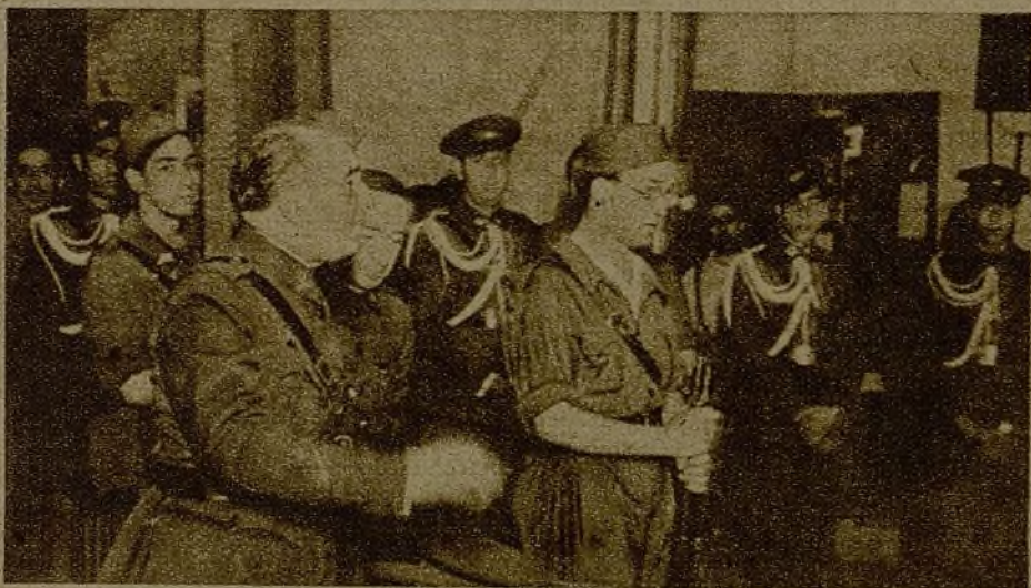
El general Cardenal, en nombre del Cuerpo de Artillería, afirma que la bandera donada por el S. R. I. será clavada en las posiciones enemigas por los valientes artilleros del Ejército popular