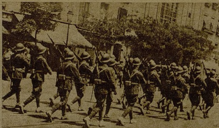
Después de la entrega de la bandera donada por el Grupo García Lorca al Cuerpo de Artillería, las fuerzas del pueblo desfilan ante las representaciones de todos los partidos y del general Cardenal