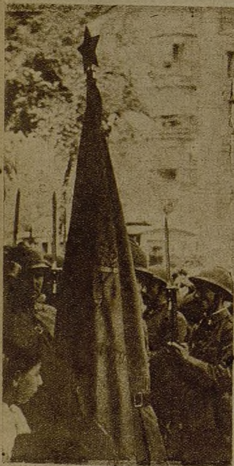
Esta es la bandera que el Grupo García Lorca ha ofrecido a los artilleros del pueblo.