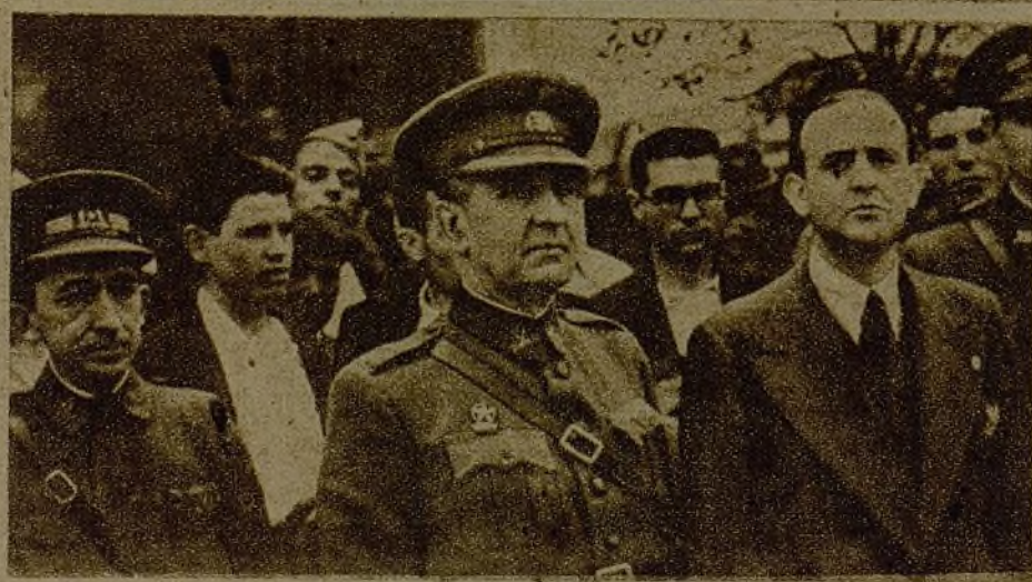
Al acto de la entrega de la bandera asistieron prestigiosos jefes del Ejército popular, el general Cardenal, teniente coronel Casado, comandante Zamarro...