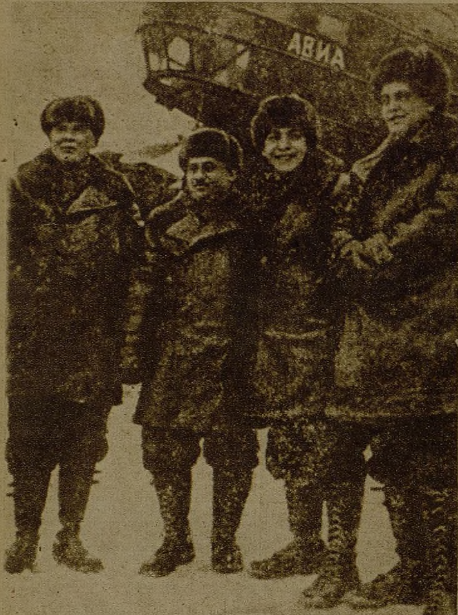
Kerenkel, Papanin, Fiodorov y Shirshov, cuatro héroes de la ciencia soviética, que van a abrir nuevos horizontes a la investigación, permaneciendo el próximo invierno en el Polo Ártico