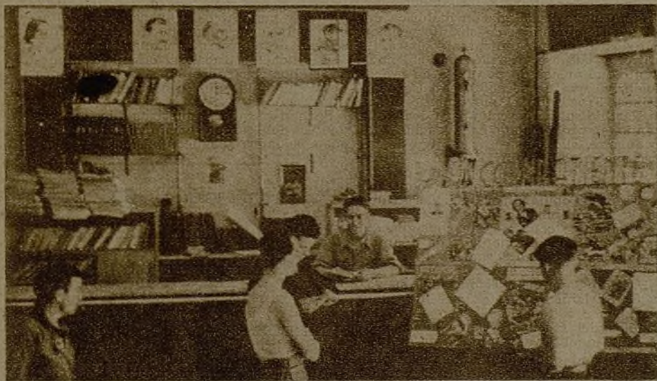
El antiguo bar se ha transformado en "Hogar del Combatiente". El responsable de la biblioteca se lamenta: "Me piden Salgarí, bueno, también piden folletos sobre la U. G. S. S. y "Nueva Cultura"

"LA CASA DE AL LADO".--COMISARIOS DE COMPAÑÍA. LA CAZA DE PERMISOS (CRONICA DE NUESTRO REDACTOR RUANOVA)