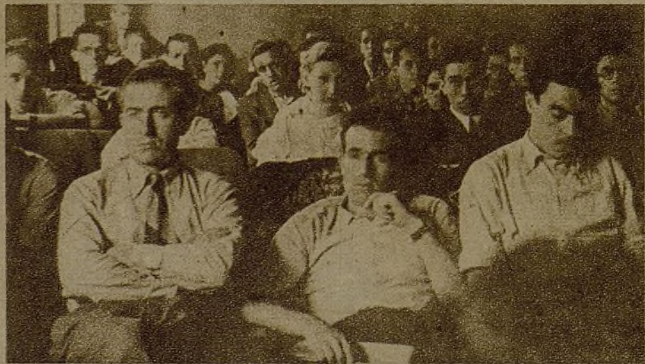
Lo mejor de la juventud catalana ha mostrado en esta reunión su identificación con la Comisión Ejecutiva de las J. S. U. de España