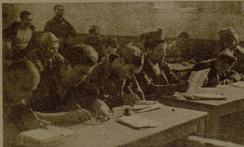
Y mientras los de "la casa de al lado" dan su grito contra la cultura, en nuestras filas desaparecen vertiginosamente los analfabetos

Está en uno de los sectores donde el avance es lento, donde unos rieles de tranvía continúan su paralela hasta llegar a las líneas enemigas. La lucha es de pico y pala, de dinamita. Los fascistas se ven sorprendidos un día porque desde pocos pasos les cae una lluvia de bombas de mano, y han de replegarse. Y el juego se repite constantemente. Es una de las zonas donde el enemigo está ahí, en la casa de al lado, que es también allá, muy lejos, porque es la casa del otro lado, donde la disciplina nace en la boca de una pistola ametralladora, y la mejor consigna que defiende sus intereses es el grito bárbaro de "muera la cultura".