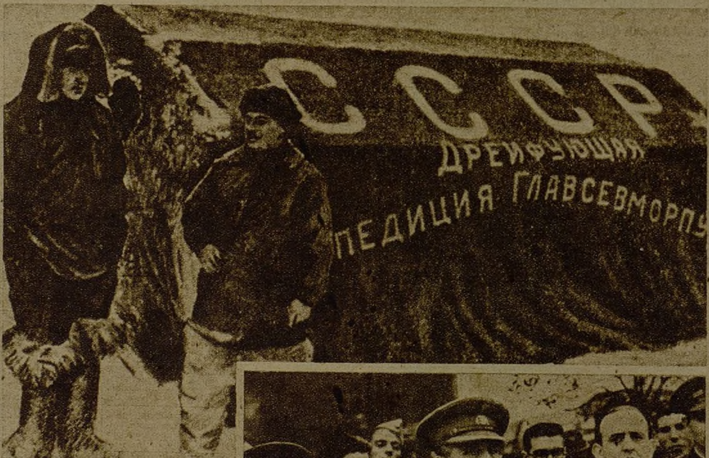
Tienda de campaña donde van a habitar los cuatro expedicionarios que darán nuevas glorias a la ciencia soviética. Estas hazañas de los héroes de la ciencia soviética demuestran, como ha dicho el camarada Negrín, la "pasión cultural del socialismo"