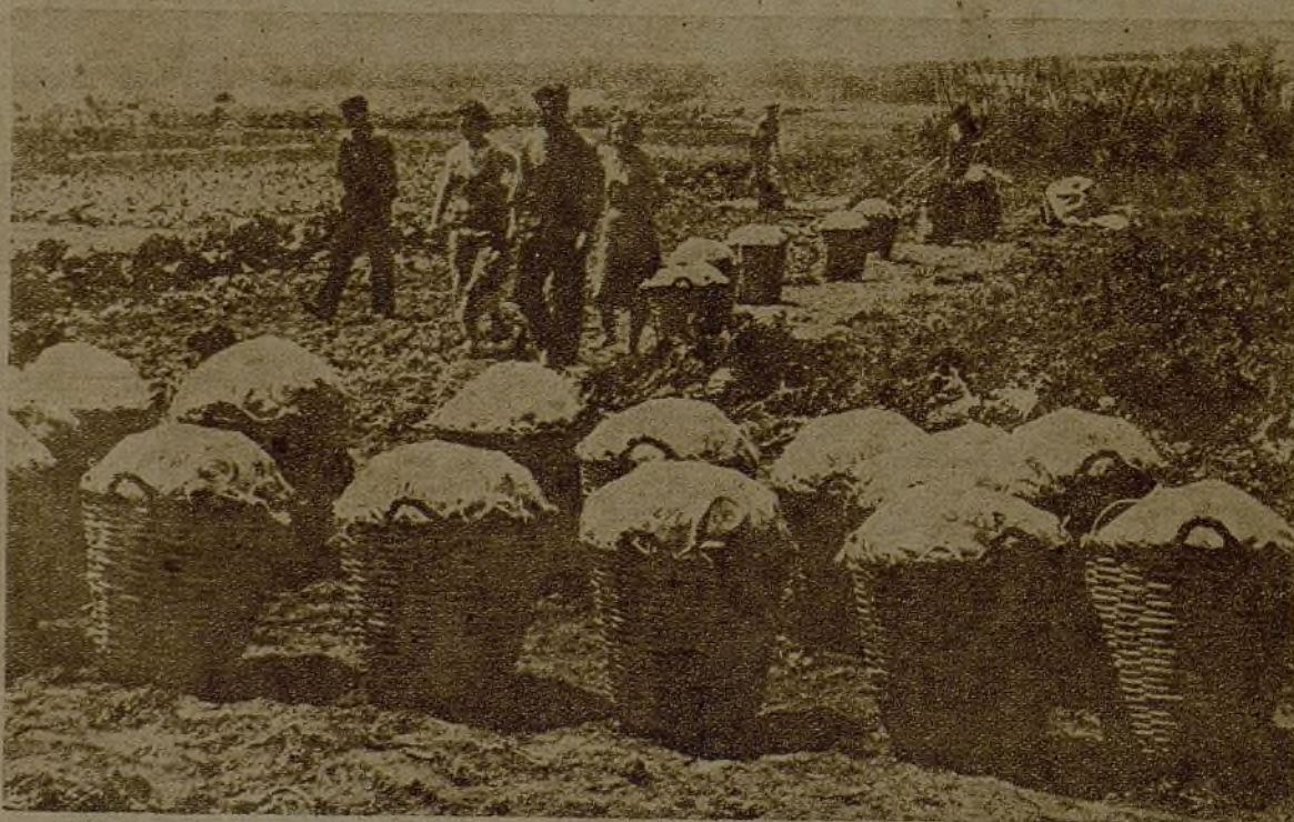
Los combatientes tienen asegurado el sustento. Estas fotos recogen diversos momentos de la recolección de la patata temprana en Cataluña

Un porvenir alegre nos espera... Un porvenir que hará desaparecer, bajo este aluvión de patatas, la pesadilla de las colas