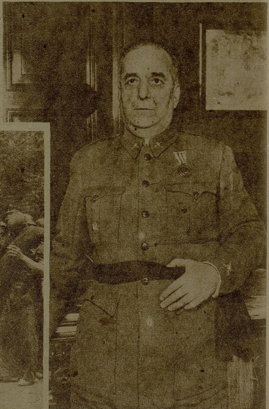
El general Llano de la Encomienda, nombrado jefe del Ejército Asturias-Santander. El nuevo Gobierno está dando, con este nombramiento en estos momentos, realidad al mundo único