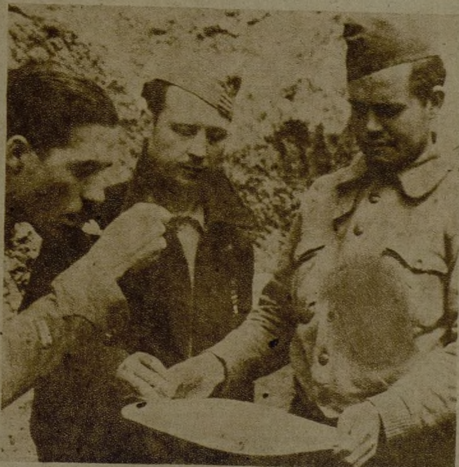
La hora de la comida en las trincheras... Los oficiales prueban el "menú" que entre fuego y fuego van a devorar los combatientes.