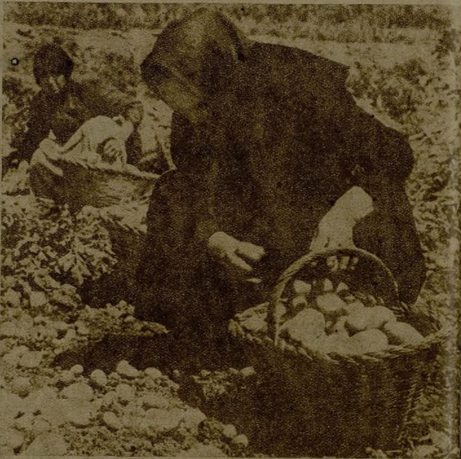
Las campesinas ayudan con tenaz esfuerzo a sus compañeros que en las trincheras defienden a España de la invasión