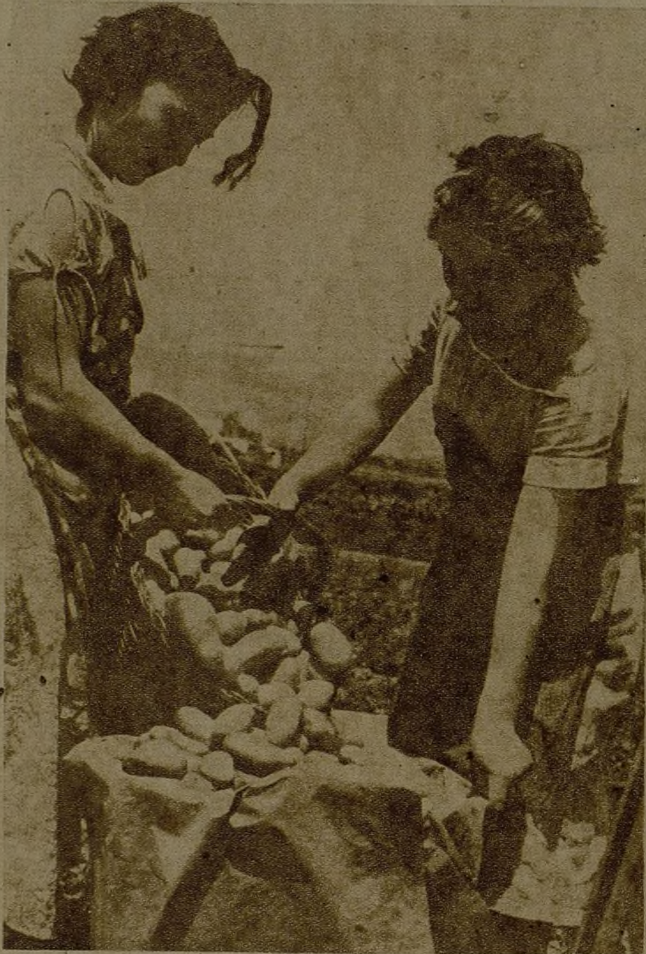
La tierra va dando sus frutos. Las mujeres se aprestan a las tareas de la recolección...