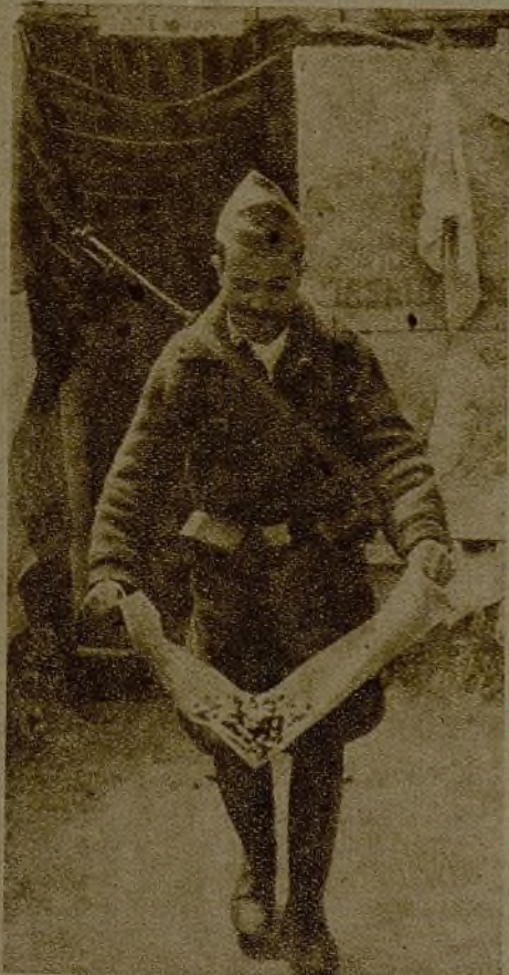
Este soldado muestra con orgullo los cartuchos vacíos... Es el resultado de un violento tiroteo, en el que nosotros hemos llevado la mejor parte.