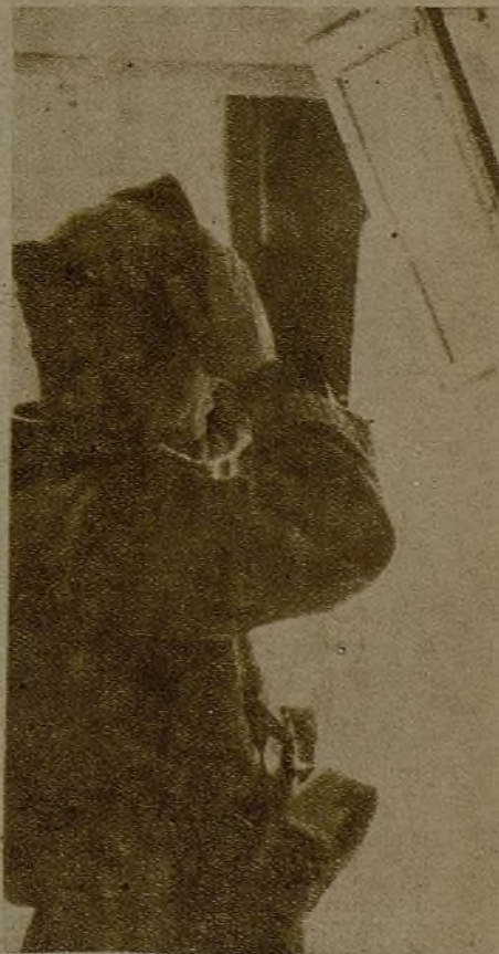
Un soldado cuida, tranquilo y sereno, de su aseo, porque sabe que unos ojos vigilantes miran por nuestras trincheras.