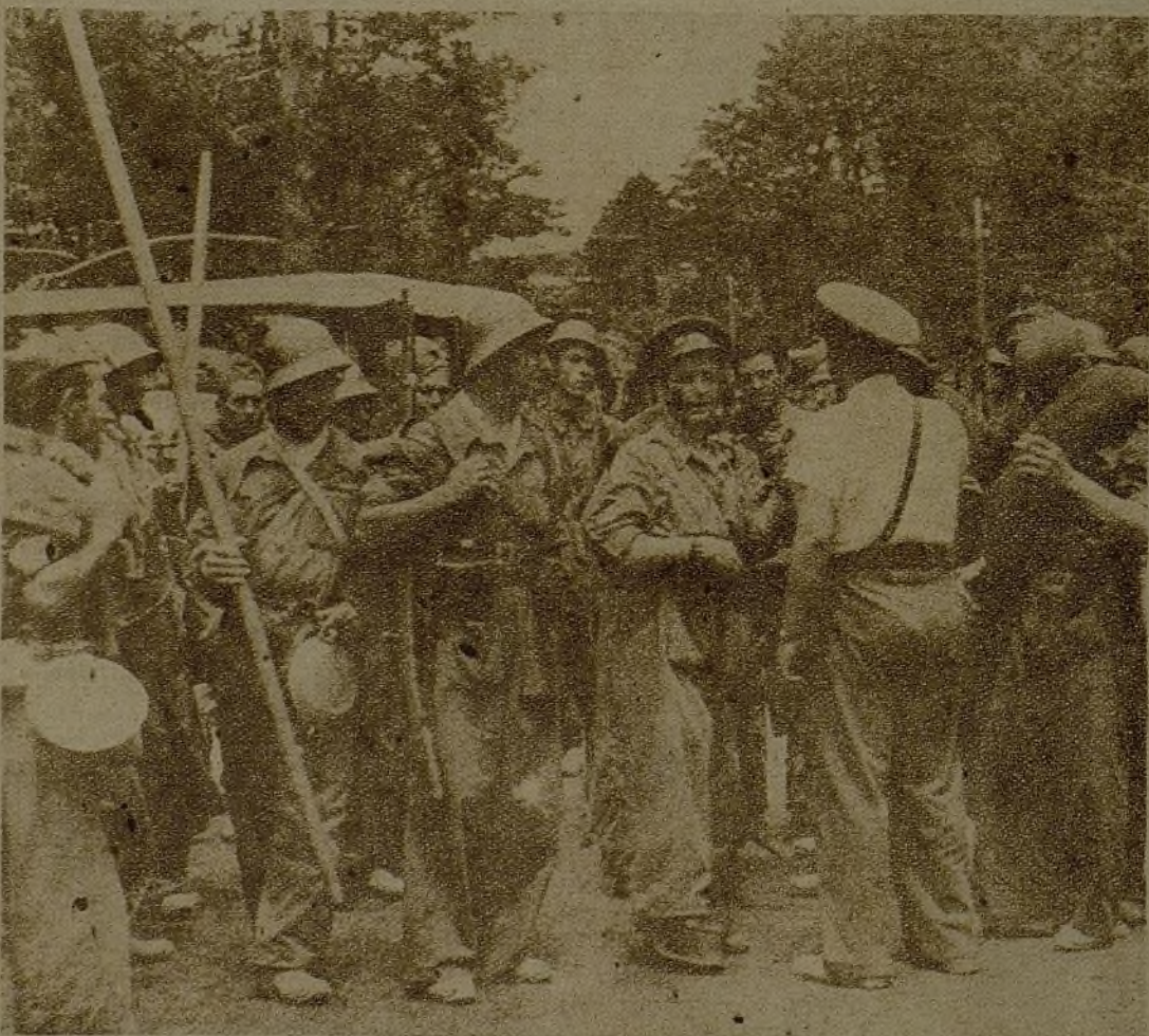
El comandante "El Campesino" felicita a los soldados que han tomado parte en los últimos combates