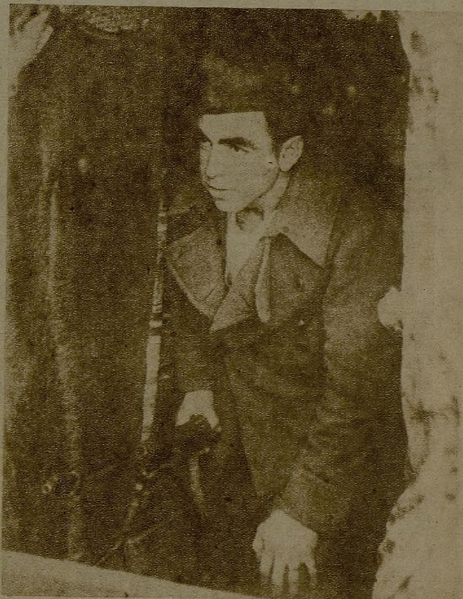
Cuando los fusiles callan en las trincheras, las palas y los picos entran en acción. Siempre alerta... El enemigo acecha sólo a unos metros de nuestra trinchera.