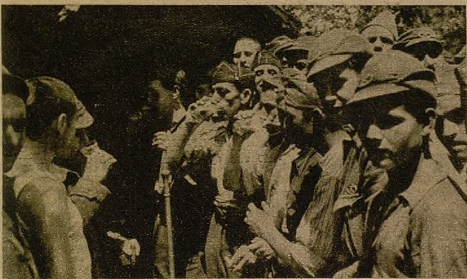
He aquí una foto, que de llegar al campo rebelde, aumentaría considerablemente el número de evadidos. A nuestros soldados no les falta nada, ni este pequeño bar, donde beben unos vasos de cerveza cuando les place

Cabeza-Lijar se convirtió en una espina para los hombres del "Octubre 11", y hoy, encuadrados en el Ejército popular, cuando recibieron la orden de ataque, se lanzaron cuesta arriba de un modo que llegó a asombrar a todos. Rota la primera resistencia subieron hasta el fortín que ha construido el enemigo y mantuvieron un combate de tres horas, donde únicamente se emplearon bombas de mano. El alto de Cabeza-Lijar parecía arder. Fué un día maravilloso. Todos, contagiados por el mismo ímpetu, derro-