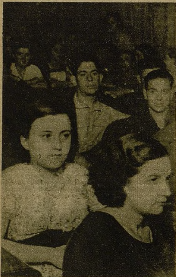
Alumnos de la Escuela de Cuadros... Todos se disponen a trabajar con entusiasmo para ser dignos dirigentes de la heroica juventud de Madrid