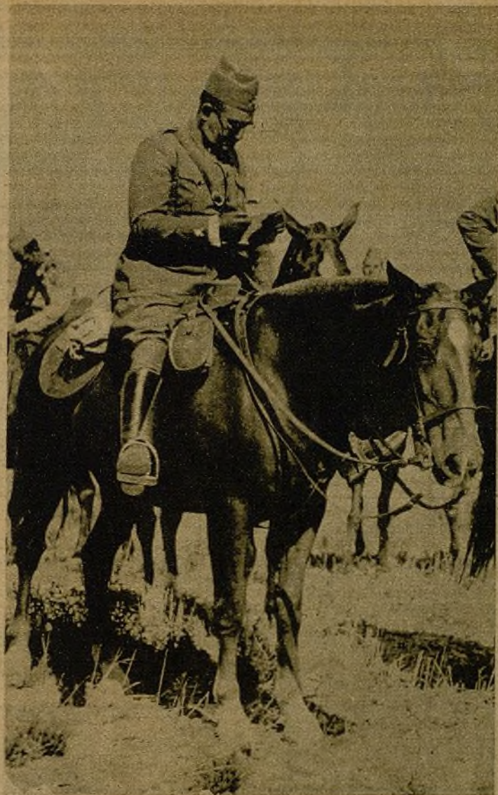
El general Gamir Uribarri se ha hecho cargo de su puesto de jefe del Ejército de Euzkadí