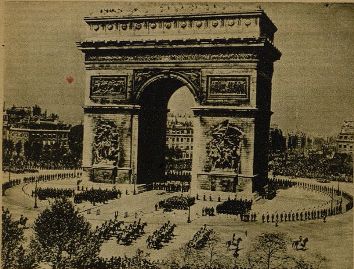
En la plaza de L'Etoile, de París, y para celebrar el centenario del Arco del Triunfo, se celebró un desfile, en el que se utilizaron los viejos uniformes del Ejército francés