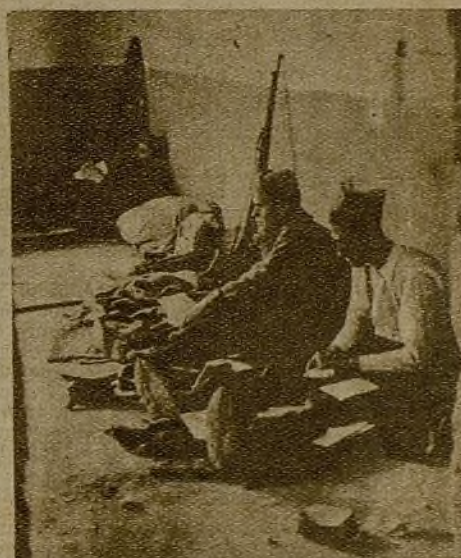
Dentro de una de las "villas" recién conquistadas por la gloriosa 39 Brigada los soldados descansan y escriben a las madres lejanas...