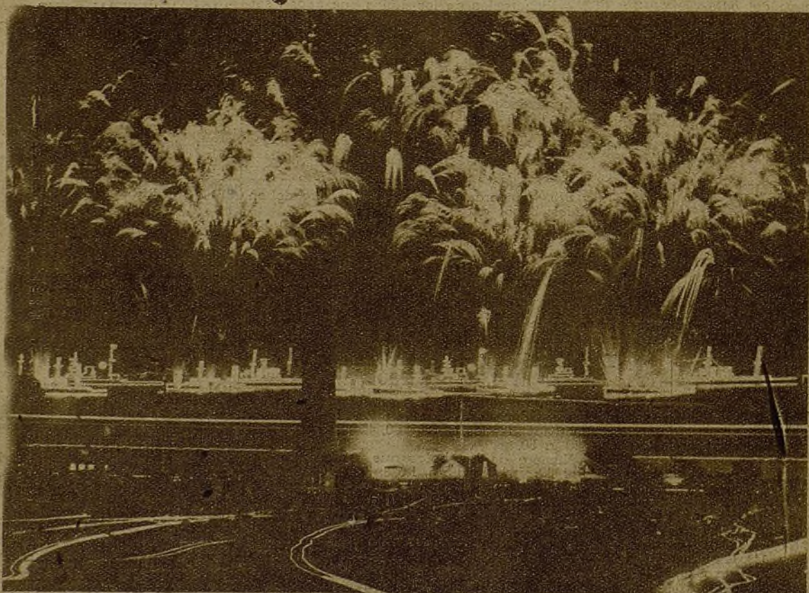
Aspecto que ofrecía la iluminación de la Escuadra inglesa en el puerto de Portsmouth, durante la revista que pasó a la misma el rey de dicho país