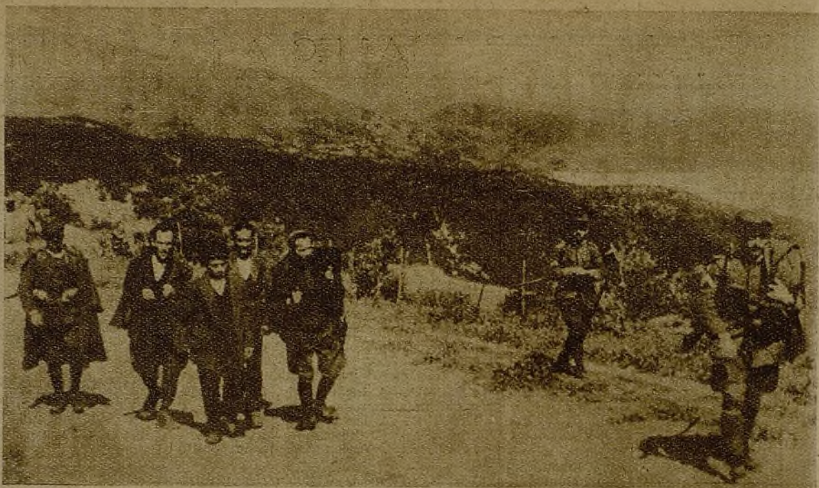
En Albania el pueblo se sublevó contra la "protección" italiana. He aquí el momento en que varios presos son conducidos a la mazmorra. (Esta foto es de gran valor, pues es una de las pocas que han podido atravesar la frontera, pese a la vigilancia y a la prohibición de la censura albanesa.)