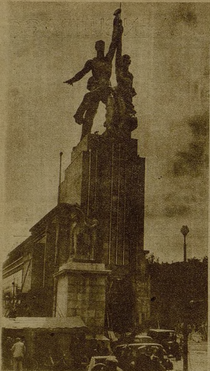
El pabellón de la U. R. S. S. en la Exposición de París. En sus líneas audaces y bellas se observa todo el espíritu de renovación que anima al pueblo que representa