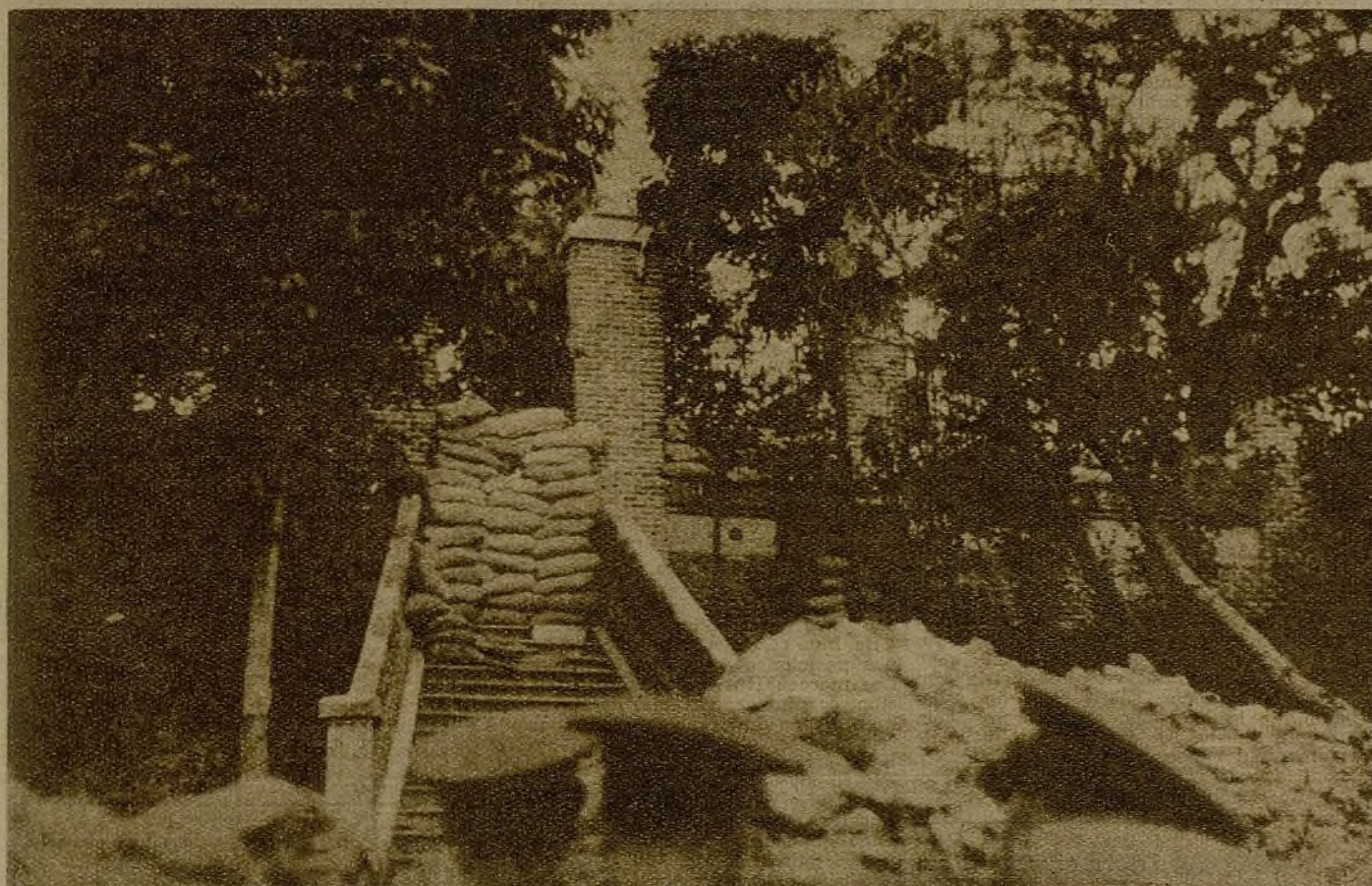
Aquí enfrente, a cinco metros de la verja de entrada de "Villa Rosario" (en la orilla opuesta de la carretera de La Coruña) está el enemigo...