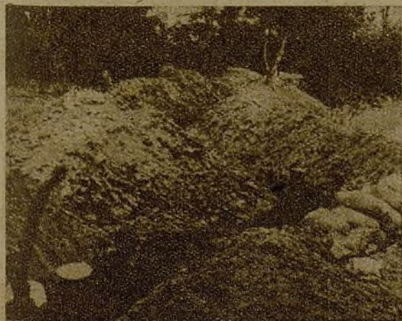
Bajo los jardines de lo que fueron antes las casas de recreo de los ricos hay ahora trincheras interminables...