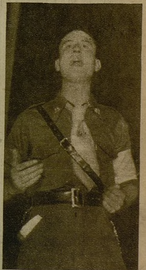
Un soldado de la Brigada de Sanidad Militar en el uso de la palabra