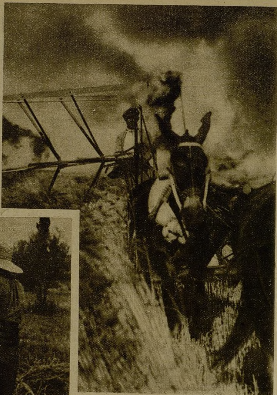
Pero en Aragón y en el Sur, hombres y mujeres recogen ya el trigo... El campesino hoy trabaja para el pueblo