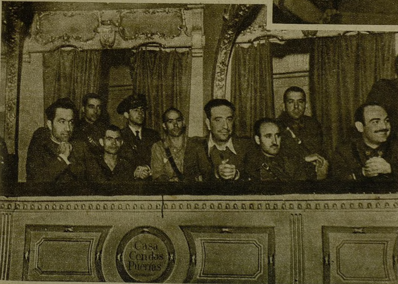
El festival en honor de la Sanidad Militar ha constituido un acierto y un franco éxito, tanto desde el punto de vista de la concurrencia lograda, como por el espíritu de aliento y adhesión de dicho acto a la labor de los sanitarios. En la foto, el mando de la Brigada presenciando desde un palco el espectáculo