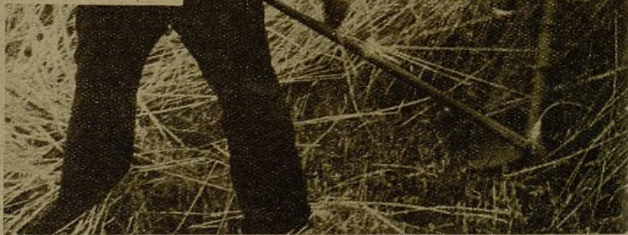
El campesino trabaja, asegurando con su esfuerzo el pan de nuestros soldados