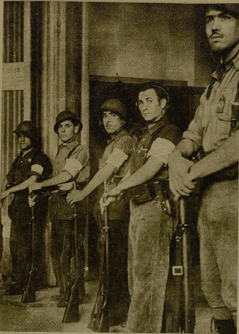
Los soldados de Sanidad Militar montan guardia a la entrada del teatro Calderón, durante el acto de homenaje celebrado en el día de ayer