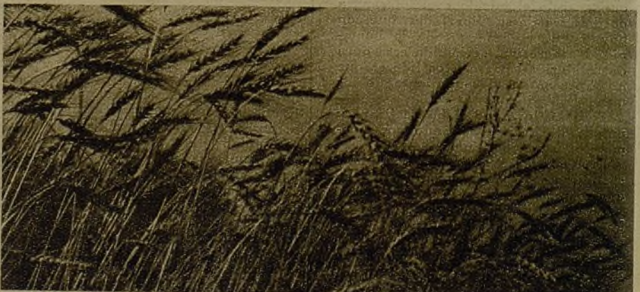
¡La cosecha es sagrada! Recogerla sin perder un grano de trigo vale tanto como ganar una batalla