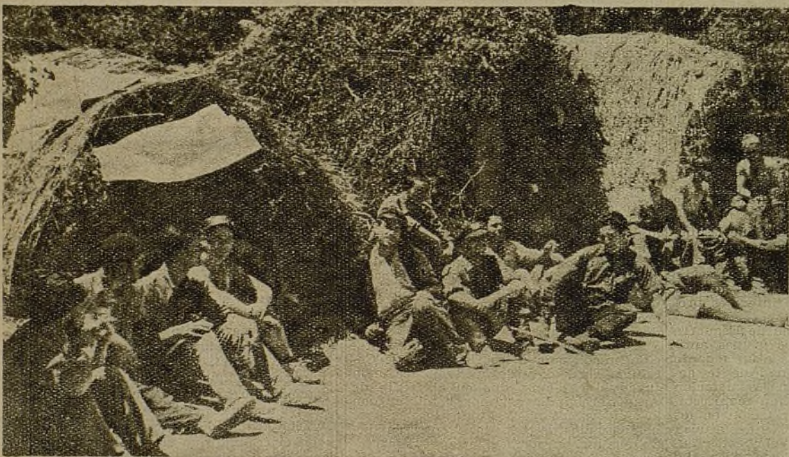
Parecen clásicas "barraquetas" valencianas; pero son chabolas construidas por los combatientes levantinos de El Plantío

Allá quedan las familias, esperando ansiosas, día tras día, la carta que les traiga nuevas de sus hijos. Y ellos aprovechan los momentos libres que les quedan para enviar el calor de sus palabras a los suyos