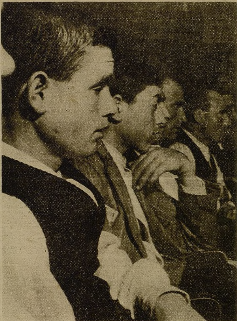
Los campesinos españoles se incorporan con ritmo acelerado a la lucha política, ligada a sus propios problemas. He aquí reflejada una viva atención en el rostro de estos campesinos, que asisten a la Conferencia Agraria del Partido Comunista.