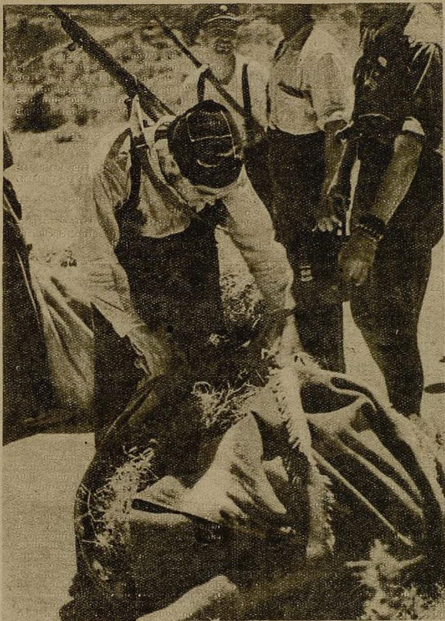
¡Buen banquete les espera a los caballos! En plena línea de fuego los soldados recolectan el forraje que crece entre los tiros...