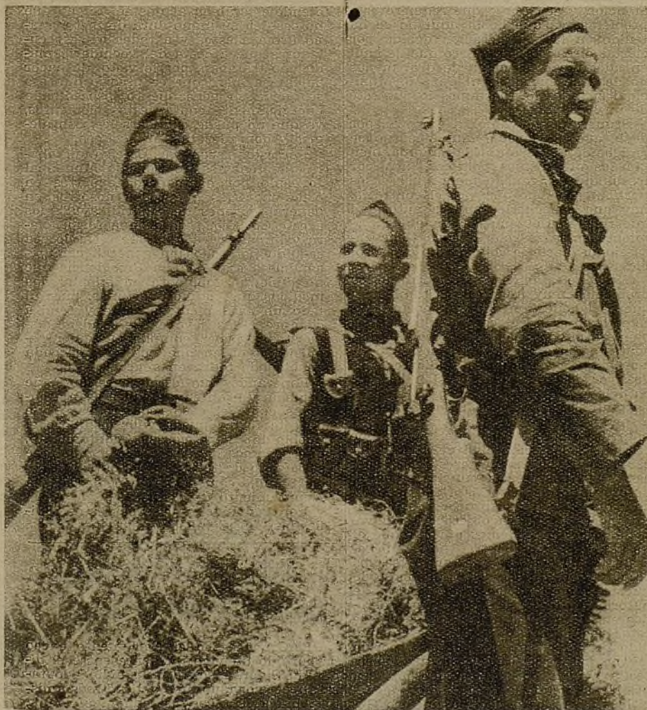
Muchachos que fueron labradores y ahora son soldados del pueblo... ¡La cosecha es sagrada! Cuando no hay tiros, ayudan a los campesinos... Después, a las trincheras, y—cuando llegue la victoria—otra vez al campo, ya liberado...