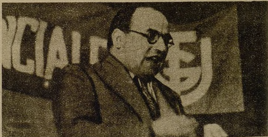
En el mitin organizado por la Federación de Trabajadores Provinciales habló el alcalde de nuestra capital. Vedlo aquí en un momento de su interesante peroración.