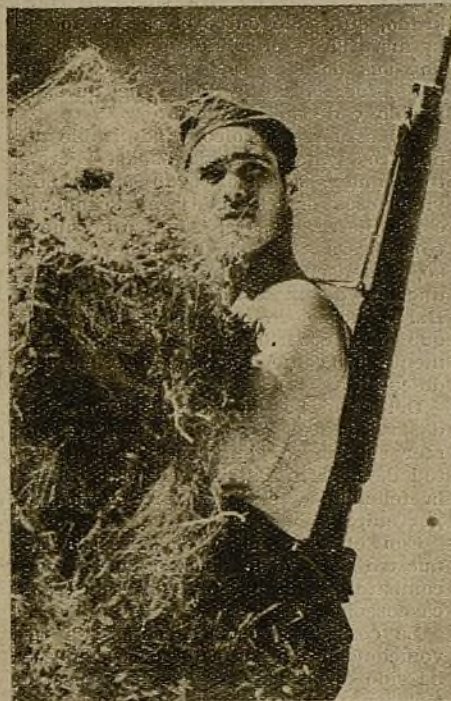
Muchos soldados del segundo batallón de la 37 Brigada son también campesinos...

Durante las jornadas de la guerra, en los momentos en que los frentes quedan tranquilos y solamente algunos disparos rompen la calma, los soldados del Ejército regular demuestran saber el valor del tiempo. Son las horas de estudio, de lectura, de cuidado de las máquinas.