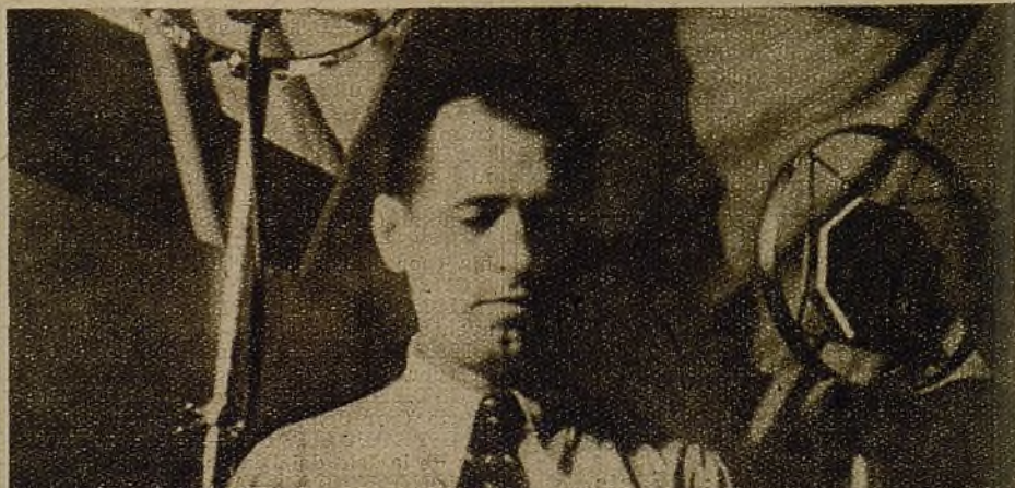
Vicente Uribe, el ministro del pueblo, que ha sabido atender al problema agrario de acuerdo con los intereses de los campesinos, en un momento de su magnifico discurso, durante el cual fué aplaudido repetidas veces con entusiasmo.