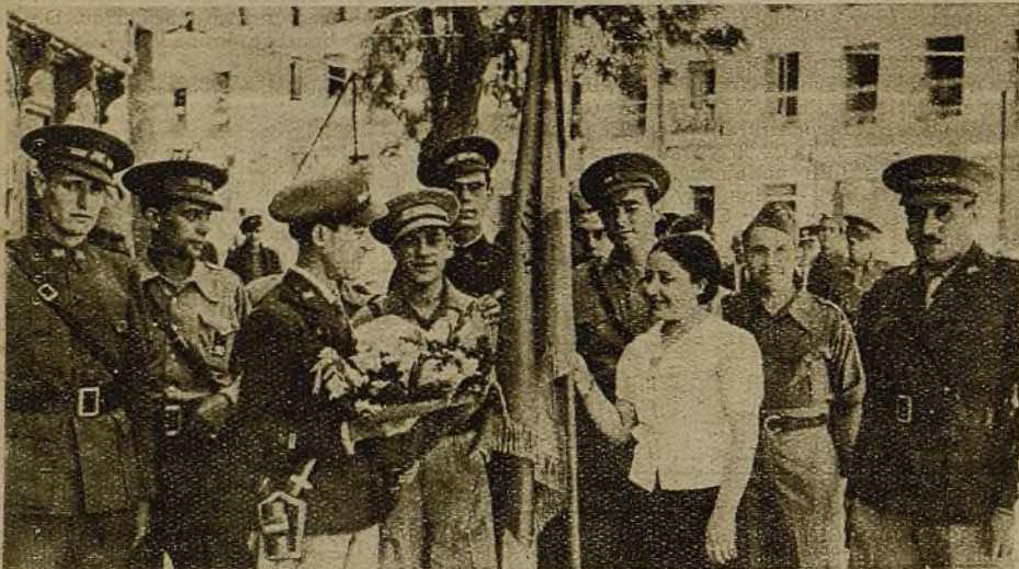
Momento en que la madrina entrega al tercer batallón de la 43 Brigada la bandera, símbolo de la lucha que el pueblo sostiene contra los explotadores de siempre.