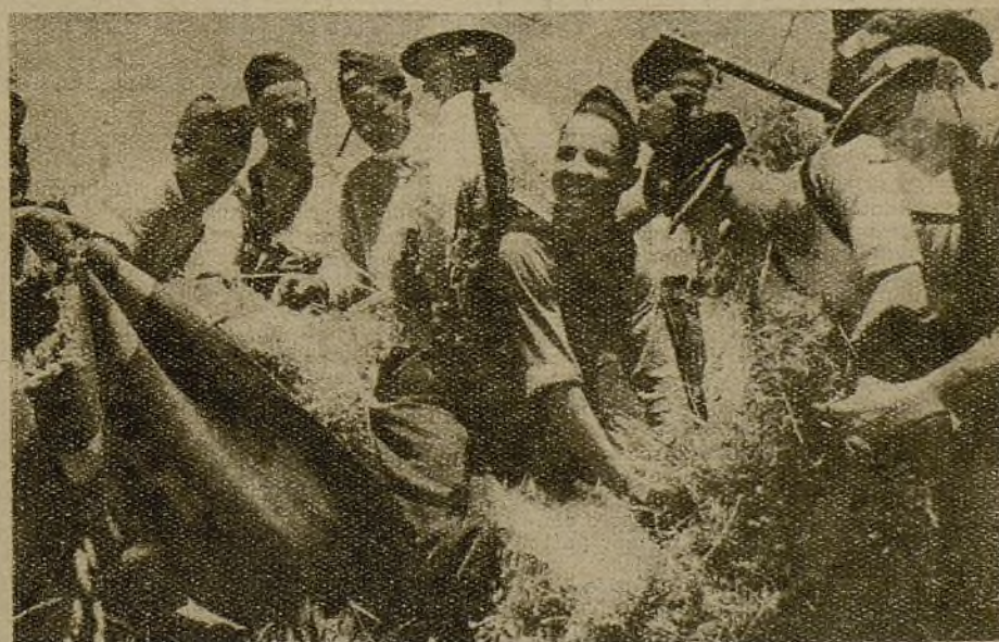
Recoger la cosecha es una victoria tan importante como tomar una línea de trincheras al enemigo... Estos soldados trabajan alegremente recogiendo la riqueza de los huertos del frente...