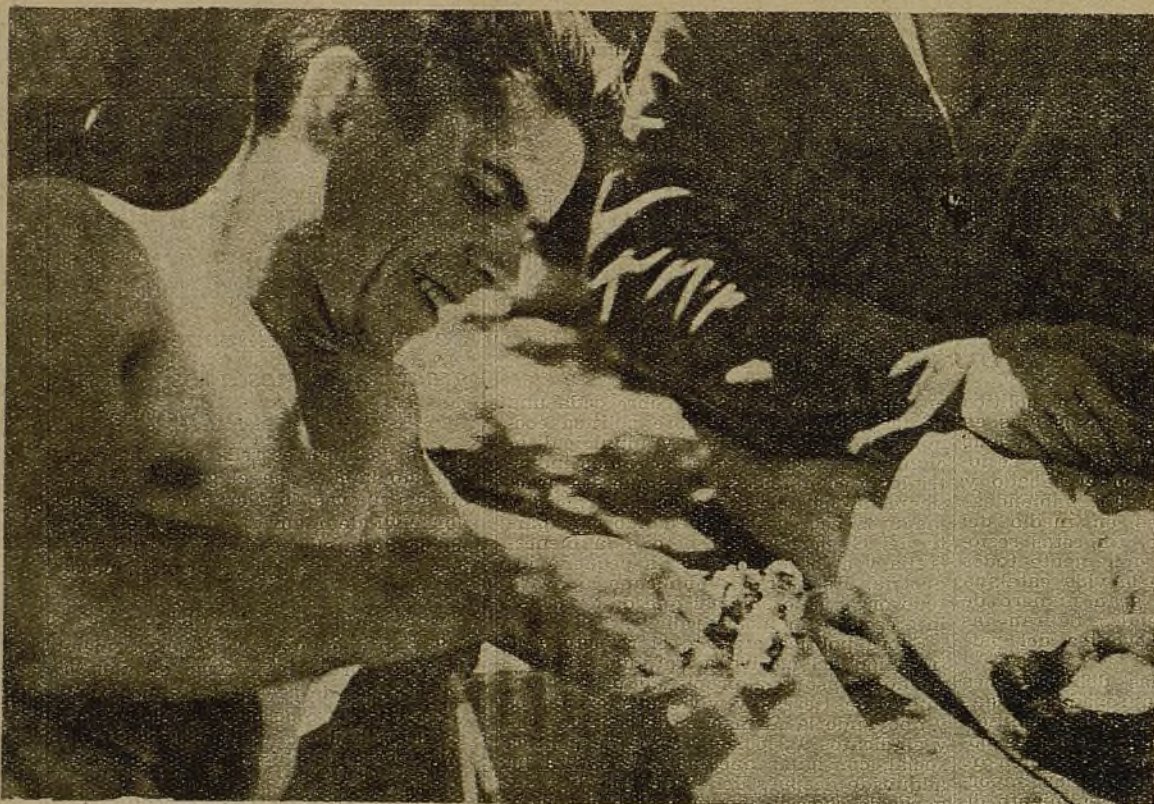
Este soldado ha recogido unos pajarillos a los que la madre abandonó, asustada por la guerra... Después del rancho les toca comer a ellos...