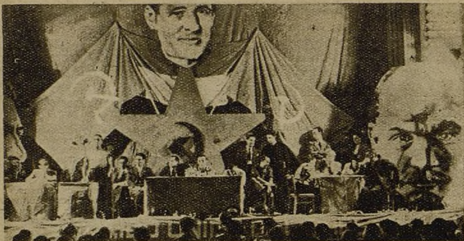
La Conferencia Provincial Agraria del Partido Comunista ha terminado sus tareas. Sus conclusiones han servido para abrir más aún los ojos a nuestros campesinos, que ahora marcharán a sus tierras dispuestos a producir con intensidad para los luchadores que los defienden. Aspecto de la tribuna durante el mitin de clausura.