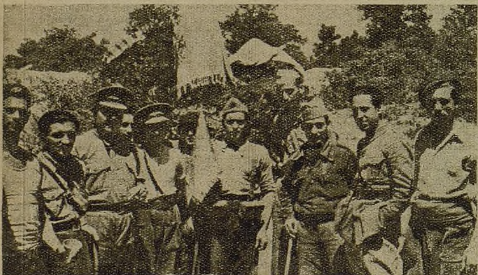
De todos los rincones de España los trabajadores acudieron a los frentes de Madrid para defenderla, sabiendo que con ello defendían sus propias tierras. Estos muchachos del tercer batallón de la 37 Brigada son todos de la región de Levante

Ellos dejaron el surco del arado sobre la tierra, el martillo o la pluma, y vinieron lejos a empuñar instrumentos cuyo manejo les era desconocido. Hoy son los expertos soldados de nuestro Ejército, capacitados y adiestrados como cualquiera otro del mundo