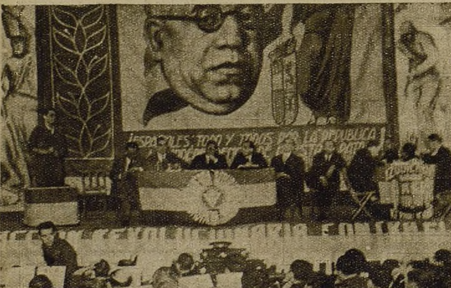
Izquierda Republicana dió un mitin muy lucido, el domingo, en el teatro Barral. En la foto, la tribuna y la presidencia del acto, en el que intervinieron figuras muy destacadas de dicho partido.