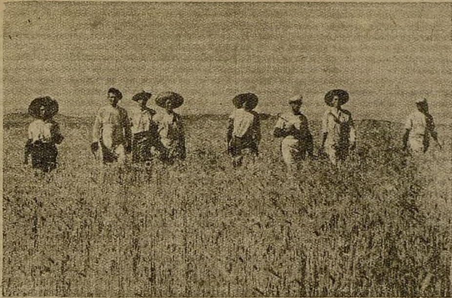
Por los campos con horizontes de trigo marchan los hombres al trabajo de la siega...