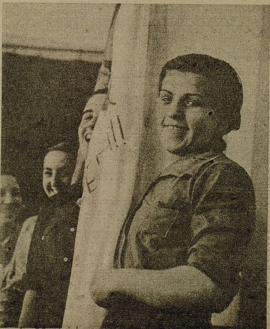
Aquí está la Presidencia efectiva de la Conferencia de las muchachas de Guadalajara. En ella están representadas jóvenes de todas las actividades de la mujer en la guerra...