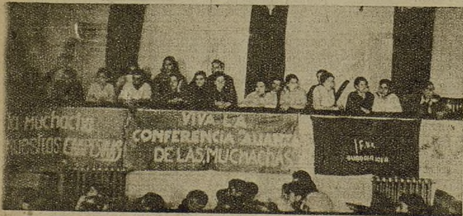
Delegaciones de campesinas, de la F. U. E., de la F. E. T. E., de las enfermeras, de los talleres..., de la juventud femenina que lucha y trabaja