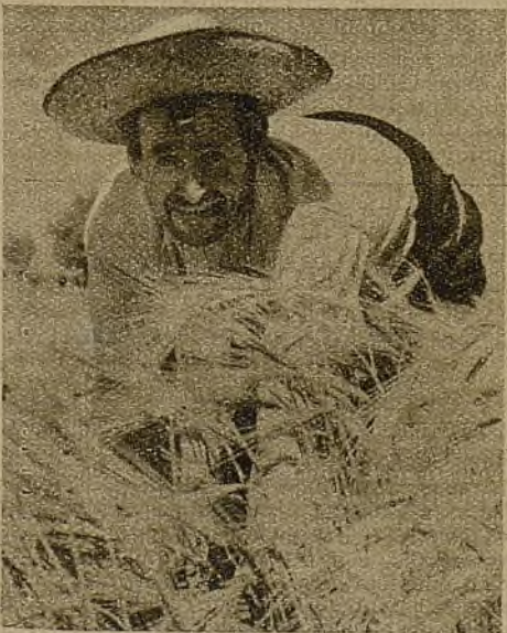
Los viejos también trabajan. El alcalde ha dicho: "La cosecha es sangre y vida para nuestros soldados..." Los años no importan cuando hay entusiasmo y se piensa en los hombres del frente...