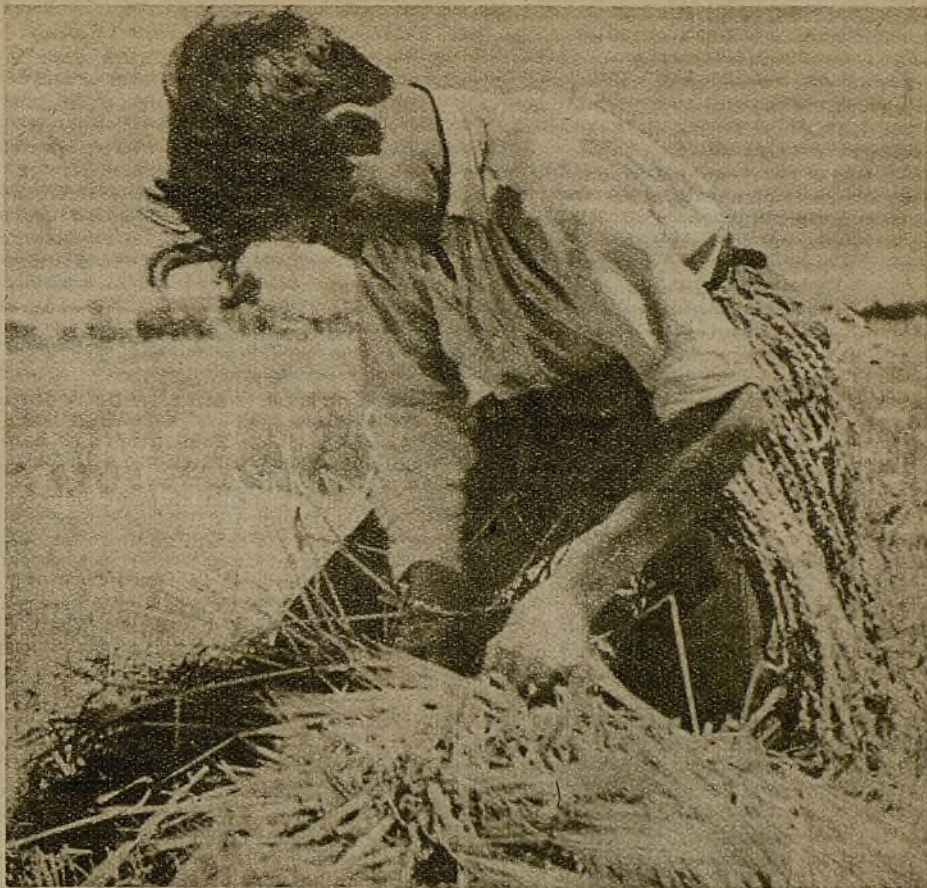
El pueblo se ha quedado desierto. Los mozos se fueron a las trincheras hace ya tiempo y los mayores están en los campos, ganando la batalla de la cosecha... Este chaval no quiere quedarse con las ganas de ayudar en la tarea...