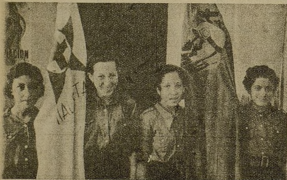
Las chicas de "Alerta" asistieron con sus banderas alegres y su juventud auténtica "menor de veinte años"...