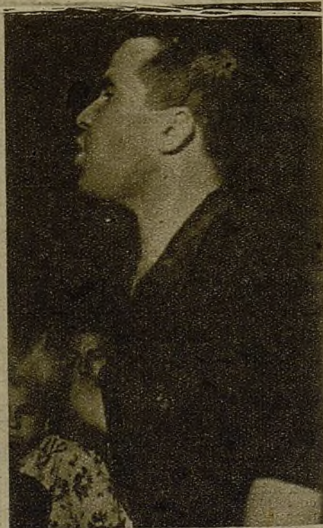
Hablan los jóvenes ferroviarios: "El Go-bierno, a petición de los obreros de fe-rrocarriles, ha decretado nuestra movi-lización. Como un solo hombre nos in-corporaremos a la lucha"