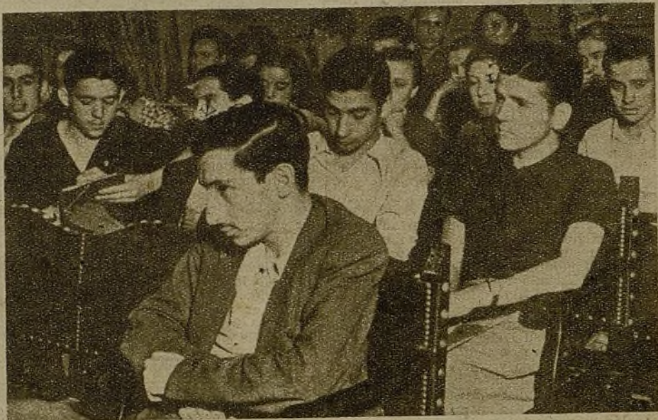
Los alumnos de la Escuela de Cuadros, de las J. S. U. de Madrid, asisten también a la reunión de activistas