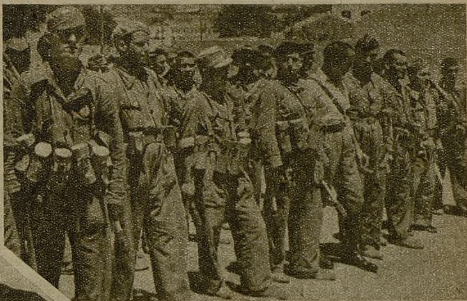
Los antitanques son todos ellos muchachos jóvenes. El jefe de la sección me ha dicho: "Los mejores hubieron de llevarse los a la fuerza; algunos tenían menos de diez y siete años. Eran voluntarios, de las J. S. U., y se resistían a abandonar el Ejército, ¡de lo mejor que he tenido en la sección!, pero no había más remedio que retirarlos del frente; eran muy jóvenes... y, sin embargo—rectifica—, ya eran unos hombres."

Las trincheras parecen recién abiertas: ni papeles, ni colillas; en las paredes, carteles que recomiendan higiene. Además, a diario, dos hombres, armados de un aparato de desinfección, recorren las líneas y chabolas abandonadas bajo tierra. Es una nueva arma, que revela el enorme cuidado que sienten por sus soldados los jefes del Ejército