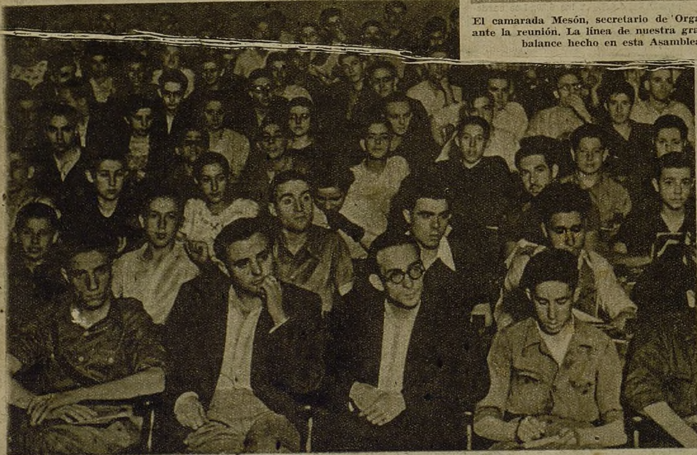
Reunión de activistas de las J. S. U. de Madrid... Los mejores jóvenes de las fábricas, de los talleres, de las Escuelas "Aler-ta", de los hospitales y otros centros de actividad juvenil, discuten y acuerdan las tareas concretas a realizar para conse-guir la victoria