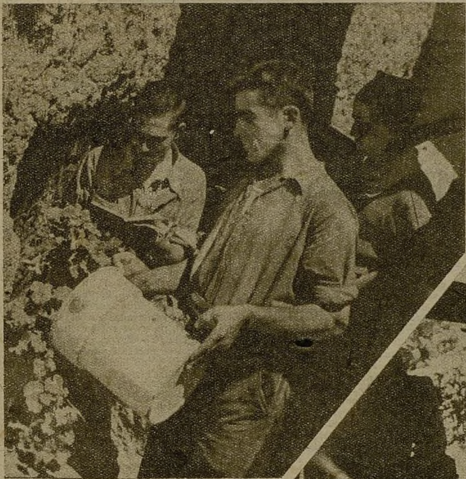
Las chabolas han llegado a ser verdaderas maravillas de confort, elegancia y alegría; macetas con flores, postales, cromos, ponen su nota de colores vivos sobre la tierra grisácea, certada a punta de pico, que es la pared de la trinchera.

Un rincón de la biblioteca en el Hogar del Combatiente. Luz, tranquilidad y los libros que consiguieran reunirse, alineados, forman otro parapeto, fuerte defensa, frente al enemigo