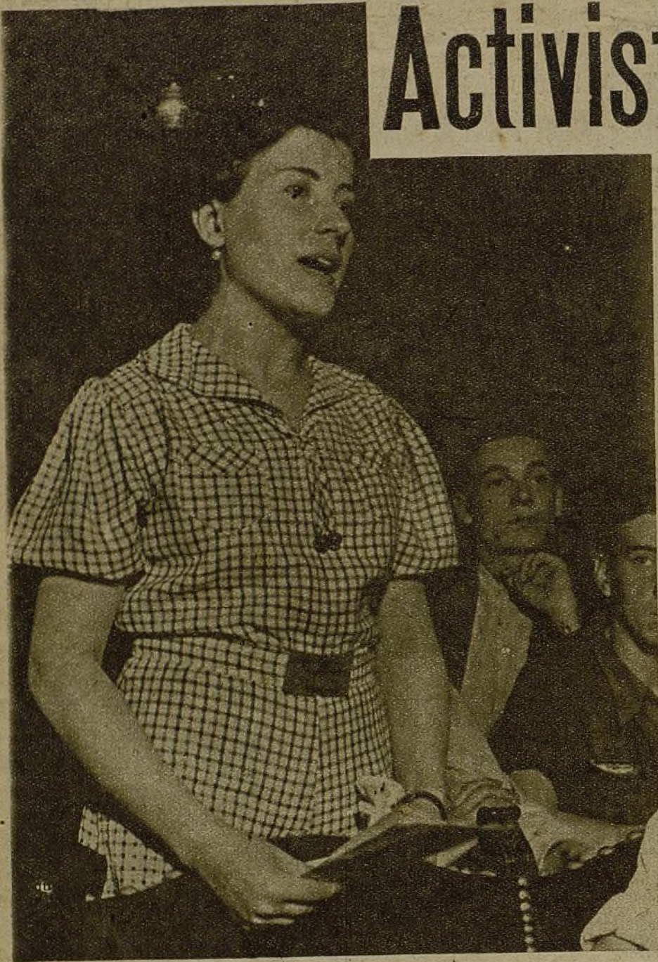
"Las muchachas queremos una mayor ayuda de nuestros compañeros para la realización de todas las tareas salidas de nuestra Conferencia"—dice esta camarada representante de las jóvenes del "Metro"