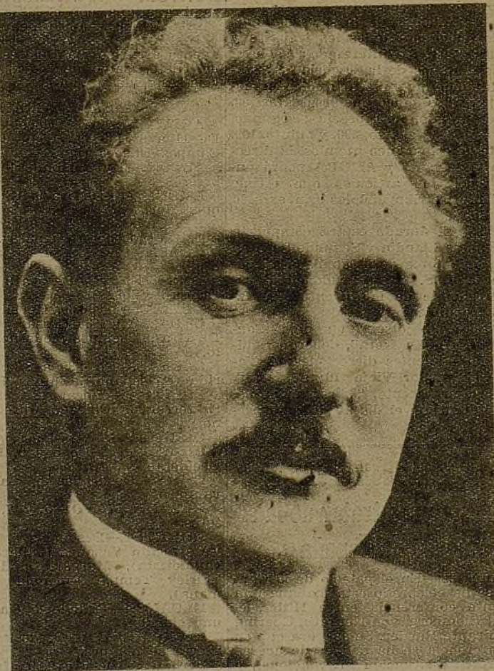
Mr. Chauteemps es el encargado de formar Gobierno en Francia, después de la caída de Blum. El pueblo español confía en que el nuevo Gobierno francés no será tan débil como el anterior, y pondrá sus esfuerzos para evitar el atropello y la invasión extranjera