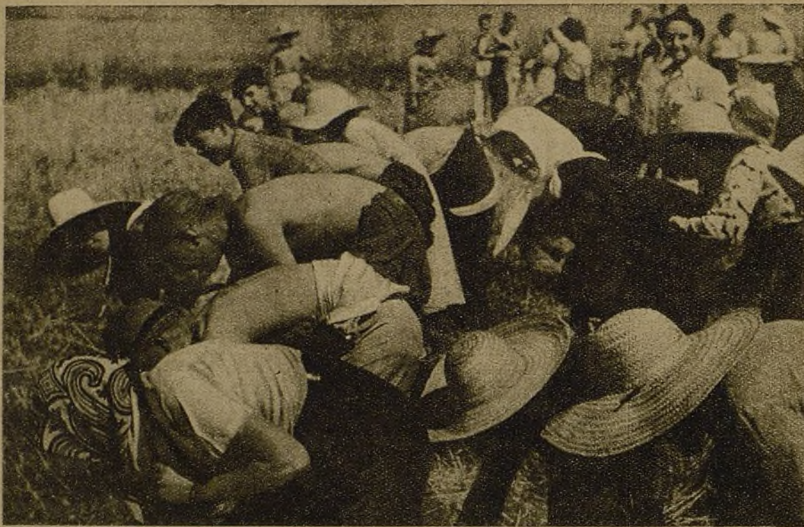
Los segadores delante, detrás los espigadores. La juventud de la ciudad ayuda a los campesinos. La consigna es: "A ver quien recoge más"