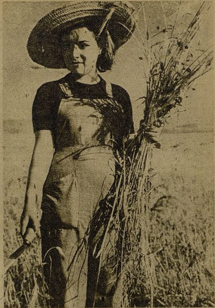
Las muchachas dijeron: "¿Vamos a ser nosotras menos que los hombres?" Y también se lanzaron ellas, hoz en mano, a recoger las espigas