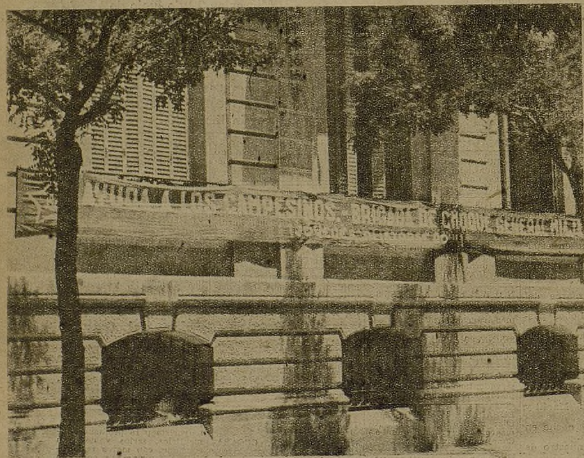
La consigna de ayuda a los campesinos ha sido acogida con mucho entusiasmo. En algunos lugares céntricos hay transparentes, como el de la foto, que han atraído infinidad de jóvenes, deseosos de aprovechar los domingos de una manera útil a la causa