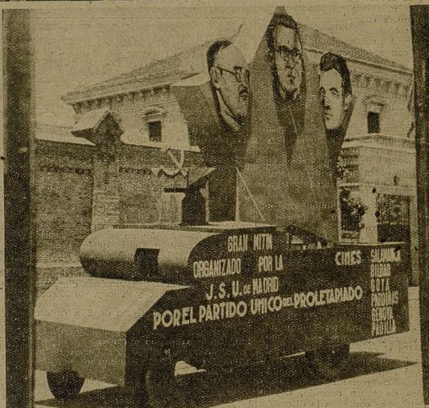
El acto del próximo domingo que organizan las J. S. U. será decisivo en el camino de la unidad orgánica de los partidos marxistas. Un original anuncio del mismo que se exhibe por Madrid