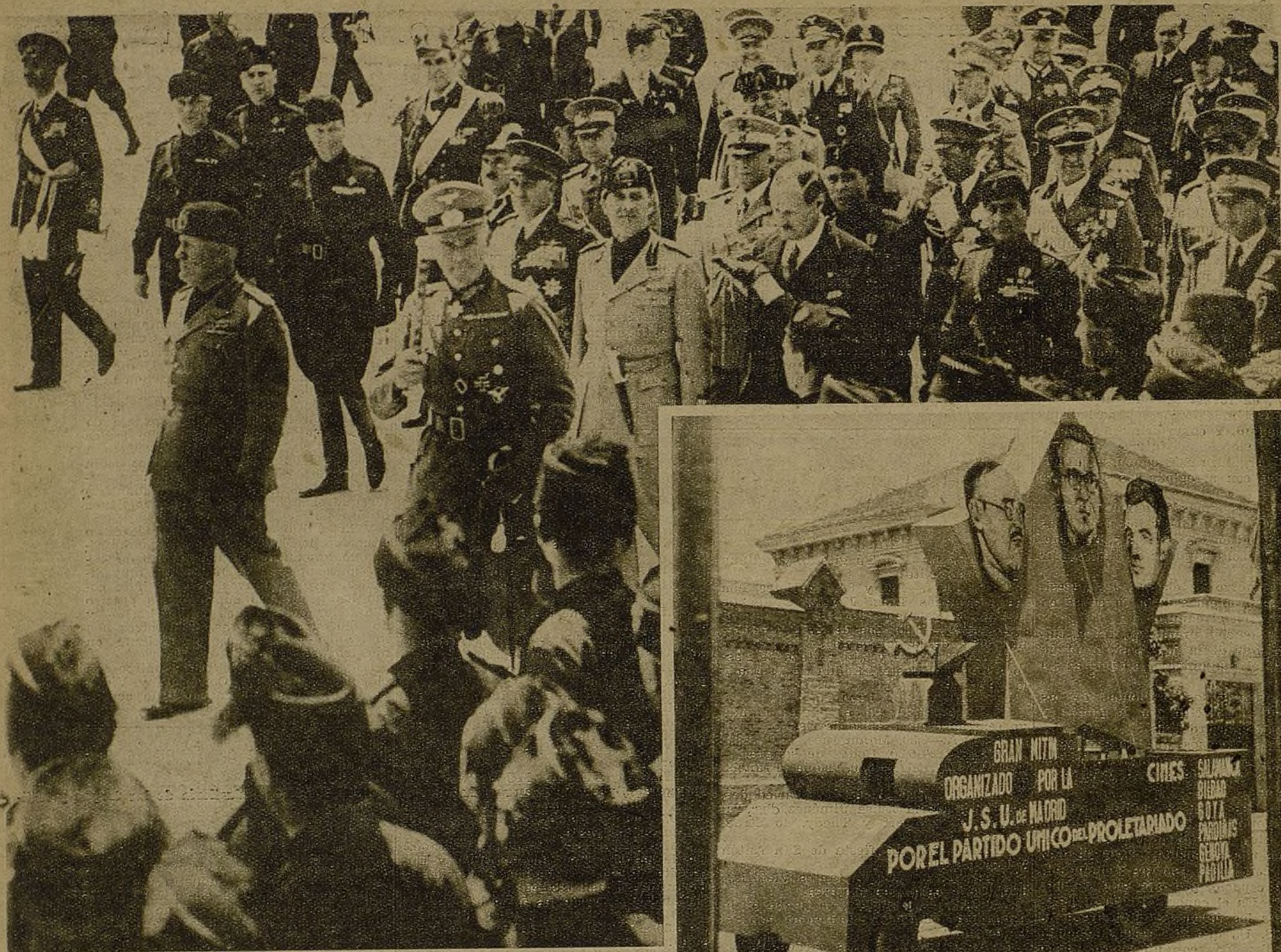
He aquí reunidos a los asesinos de los niños españoles. El señor Blomberg, a su llegada al aeródromo de Roma, pasa revista a la guardia de honor formada para recibirlo, acompañado de Mussolini y el conde Ciano