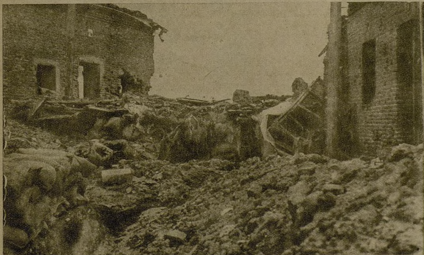
Barro, suciedad, inmundicia, ese es el aspecto que ofrecen las trincheras enemigas, donde toda suciedad tiene su asiento