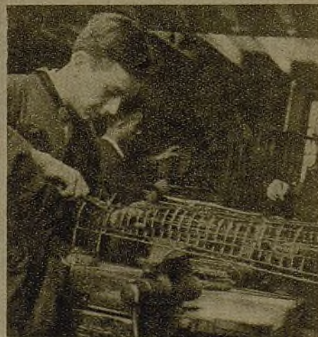
En el antiguo taller de bronce se confeccionan hoy las camillas de alambre para brazos y piernas heridos