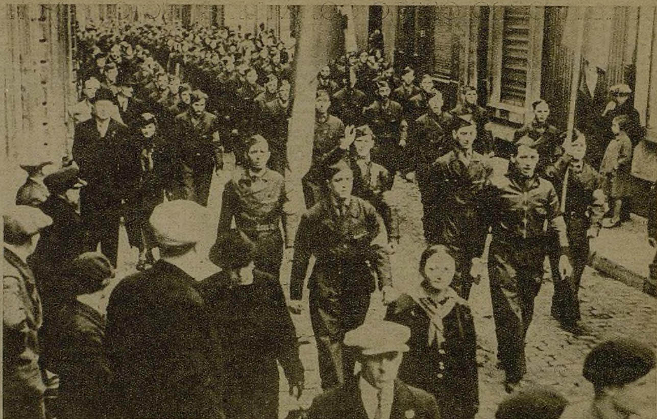
El pueblo belga, como todos los pueblos del mundo, está con nosotros. Y la juventud, con más razón. En Namur, los jóvenes guardias socialistas unificados desfilan en una manifestación de solidaridad hacia nuestra causa.