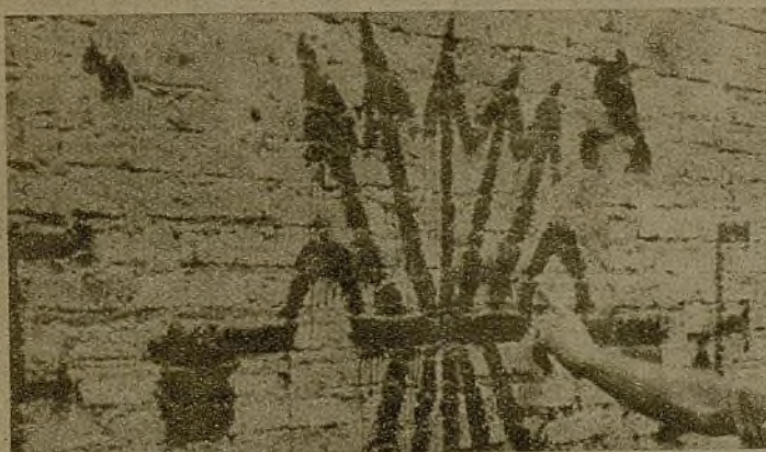
En las paredes de las casas conquistadas los fascistas fueron dejando su firma para que no quedase duda acerca de sus destructores