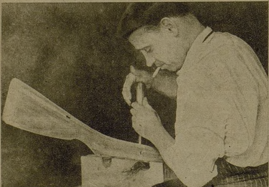
Ya está el fusil casi terminado. El obrero le da los últimos toques, y de aquí pasará al taller donde se le montará el cañón, cerrojo y los demás accesorios metálicos

Estamos ante una de las más importantes fábricas de muebles. Anteriormente al movimiento producía toda clase de muebles y objetos de adorno caseros, de las más distintas variedades, calidades y épocas. Hoy, como todas las fábricas en donde ha sido posible la adaptación, produce para la guerra intensivamente con un magnífico rendimiento.