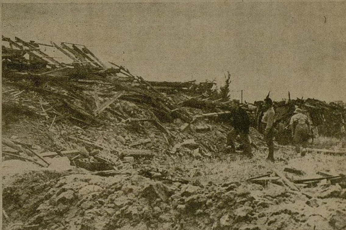
Este montón de escombros es el aspecto que ofrecen las líneas enemigas vistas de frente