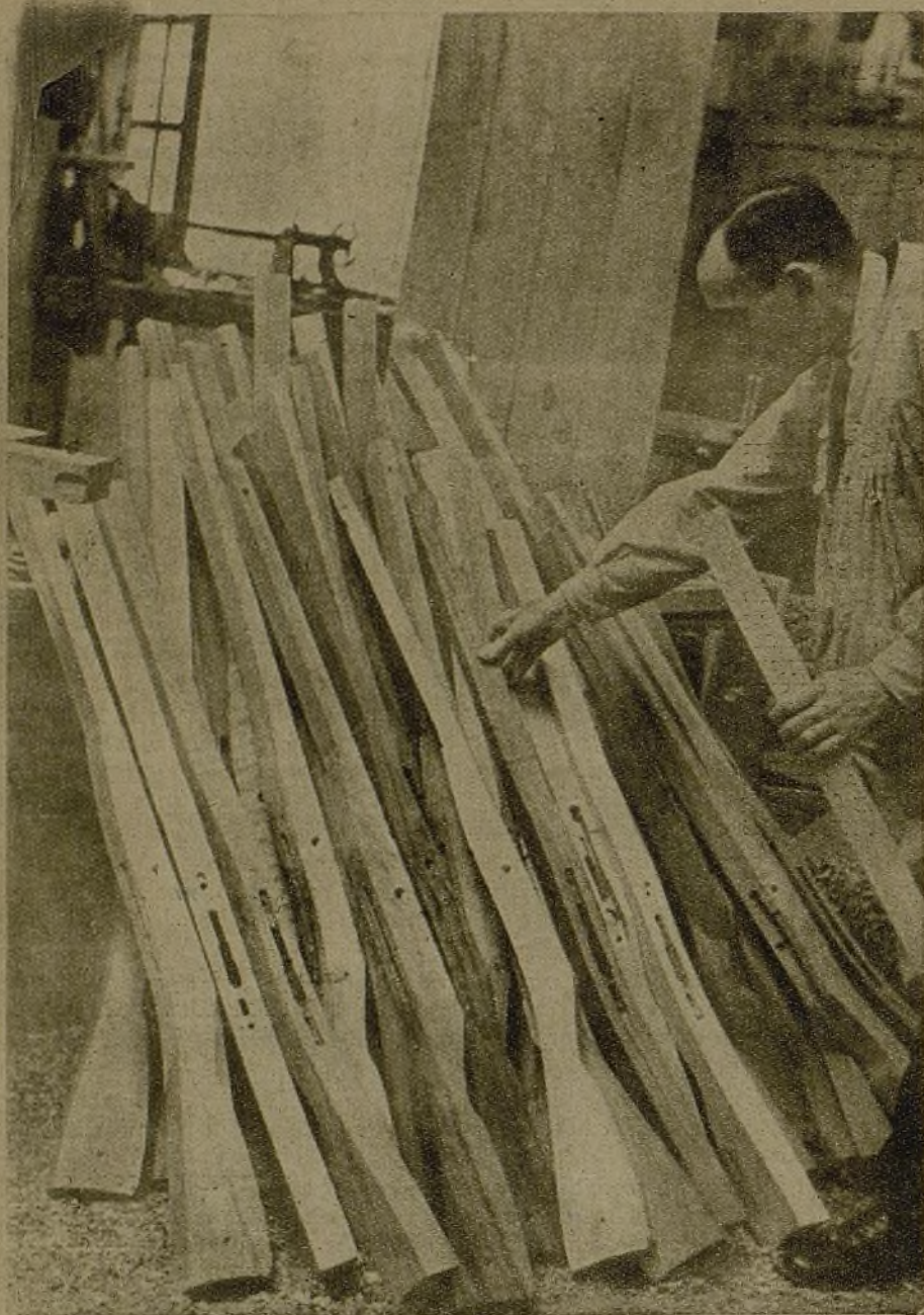
En un rincón se amontonan las maderas a las que se ha dado, rústicamente, la forma que han de tener. Después sufrirán una serie de operaciones hasta convertirse en flamantes fusiles