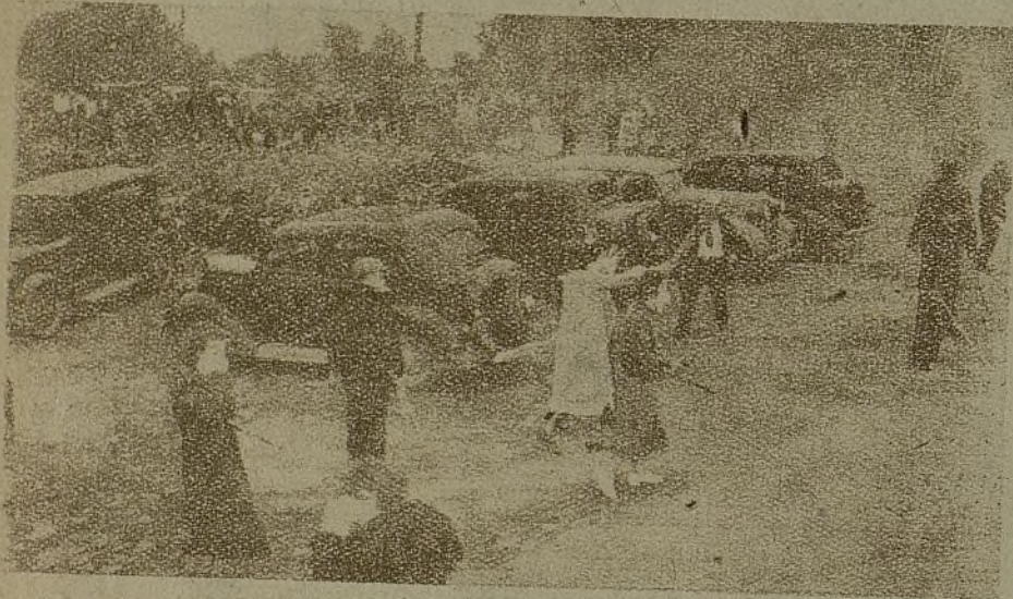
Las luchas obreras en los Estados Unidos adquieren cada día más violencia, y los métodos represivos son cada vez más brutales. Durante una huelga en Monroe, la Policía empleó gases lacrimógenos contra los huelguistas.