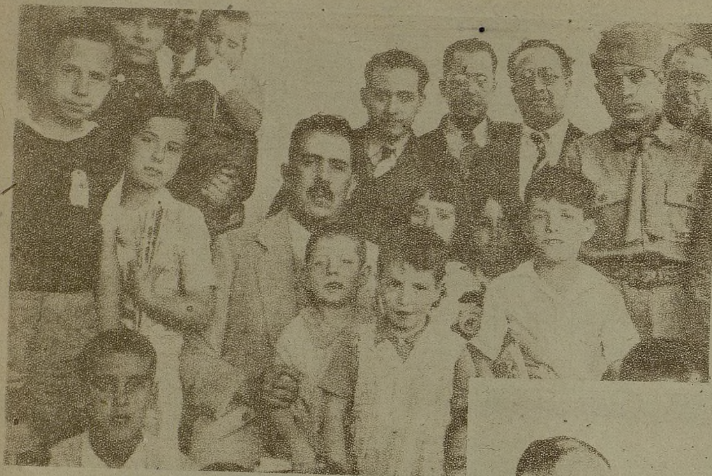
También México ha abierto los brazos a los niños españoles huérfanos de guerra o evacuados de las provincias invadidas por el fascismo. En la foto, el presidente Cárdenas, y otras autoridades del país hermano, rodeados de nuestros pequeños compatriotas.