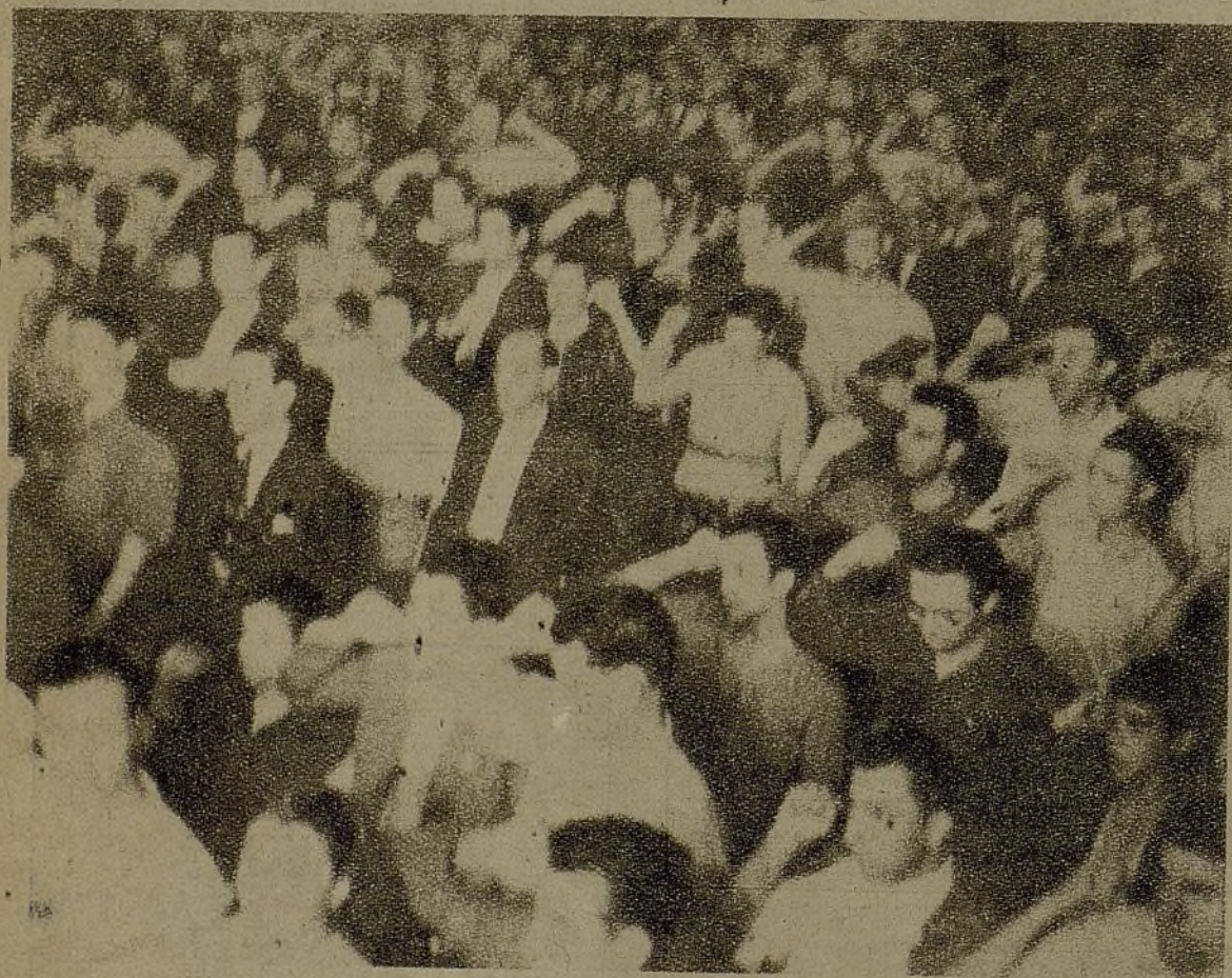
La heroica juventud de Madrid saluda con emoción a las dos Delegaciones de la I. J. S. y de la I. J. C., que por vez primera intervienen conjuntamente en un acto. El gran deseo de unidad de nuestro pueblo, de nuestra juventud, encuentra ya un eco profundo fuera de nuestras fronteras