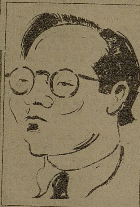
Sen, delegado de China

El Congreso de Escritores, celebrado entre explosiones de obuses, ha tenido momentos como éste, en que algunos delegados observan el paso de nuestros aviones.