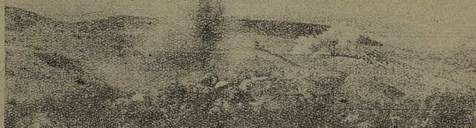
Las explosiones de los quiques del pueblo preparan la toma de Villanueva de la Cañada.