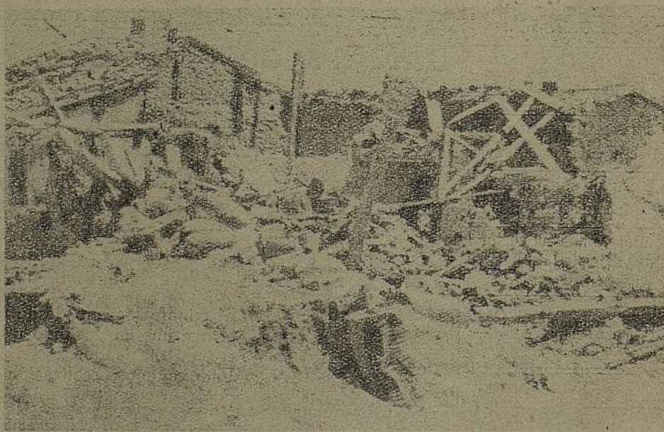
Villanueva de la Cañada es nuestro! Nada ha podido detener el empuje de nuestros soldados, que pisan, victoriosos, las calles del pueblo.