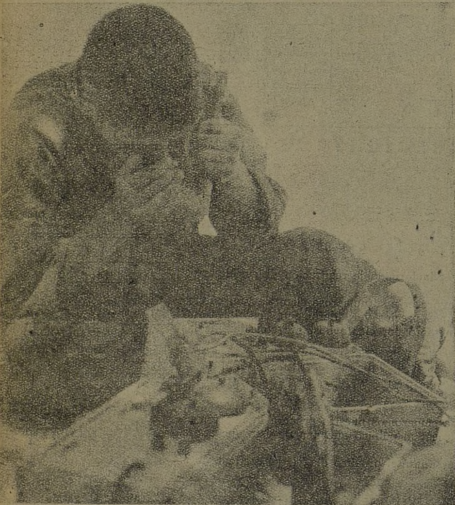
El servicio de Transmisiones, en plena línea de fuego, ha contribuido eficazmente a las últimas victorias del pueblo.