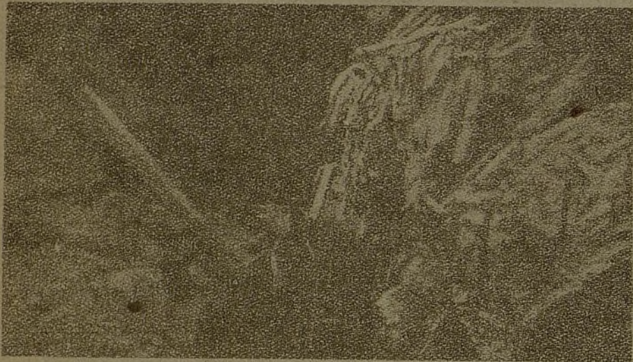
En los sectores cercanos a Madrid se van tomando día tras día nuevas posiciones al enemigo. Esta trinchera se tomó últimamente al enemigo