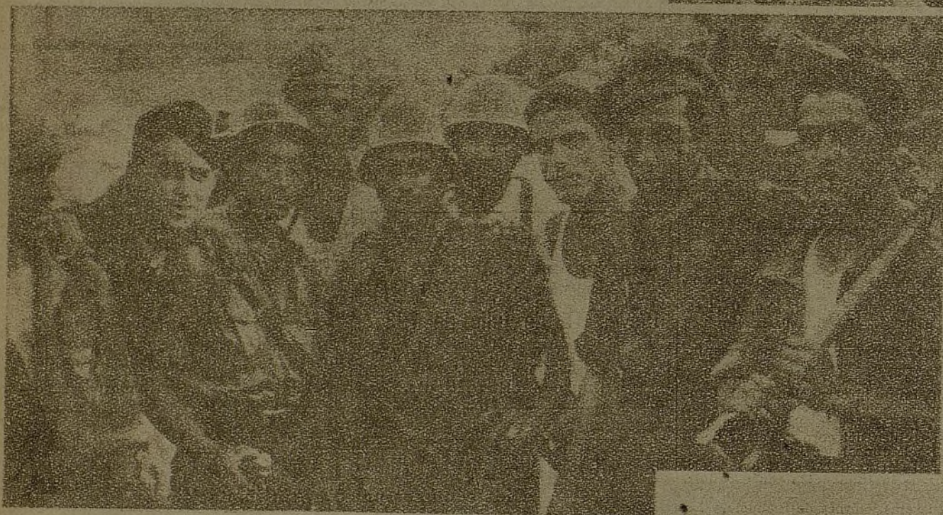
Un grupo de soldados, junto a su capitán, que tomó parte en el asalto a algunas trincheras enemigas, efectuado por nuestras fuerzas