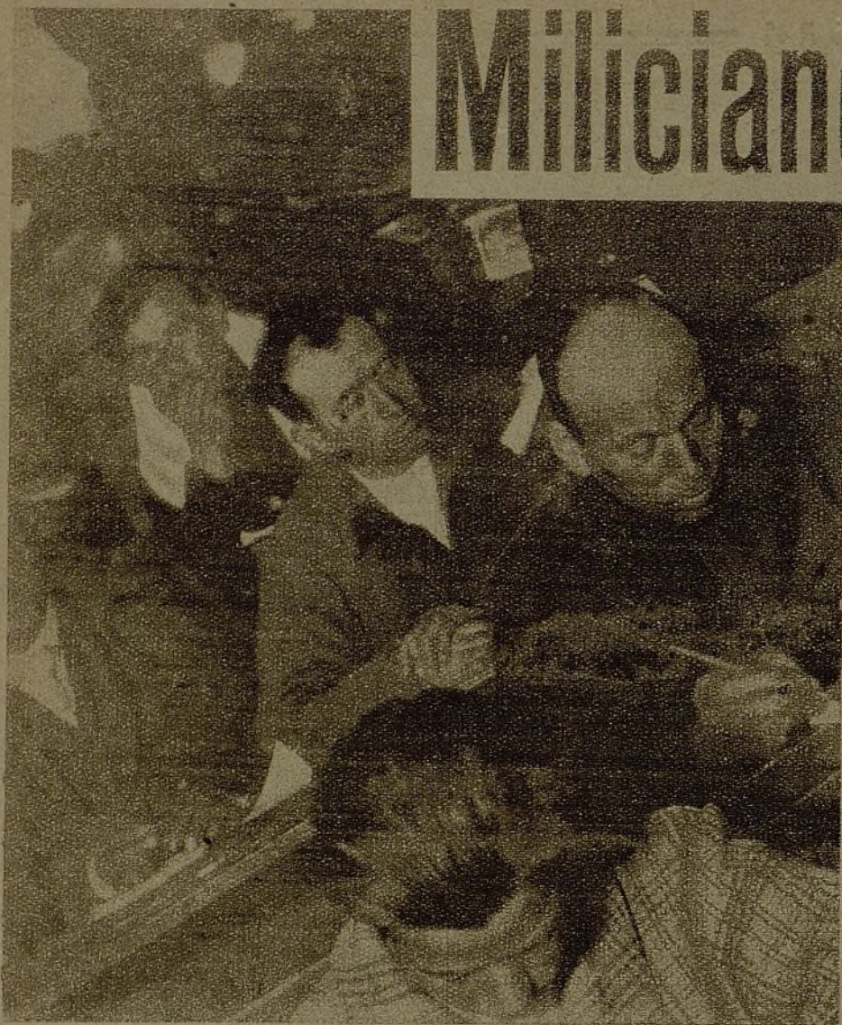
Los campesinos y trabajadores analfabetos son ya alumnos adelantados y diligentes bajo la inmediata vigilancia de los maestros. Va mejorando el estilo de la carta a la novia, a la madre y a la hermana