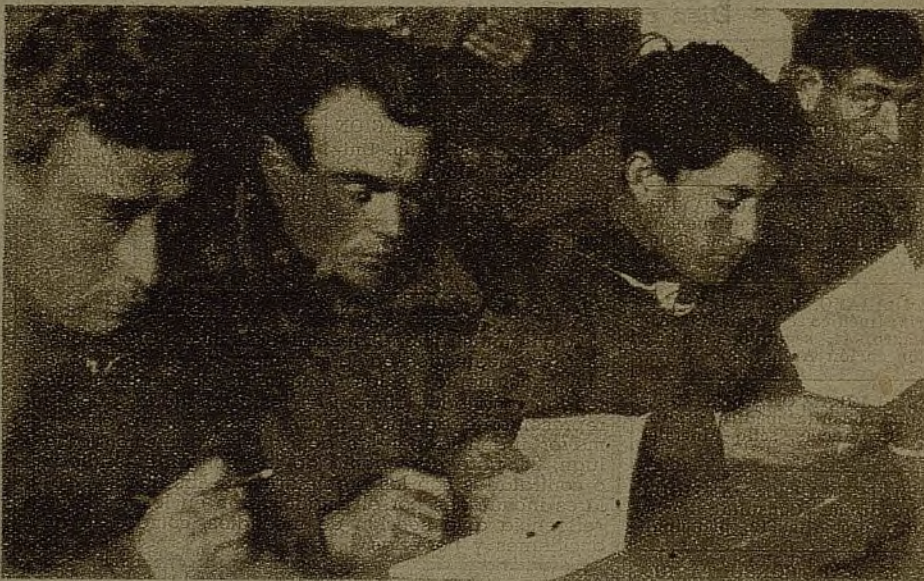
El afán de aprender se une aquí al afán de vencer. Así se levanta, entre el fuego del combate, la cultura de la nueva España