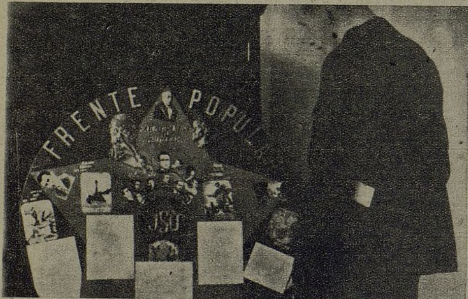
Donde quiera que hay juventud que lucha o trabaja, está representada la J. S. U. He aquí el periódico mural de los jóvenes de estos talleres