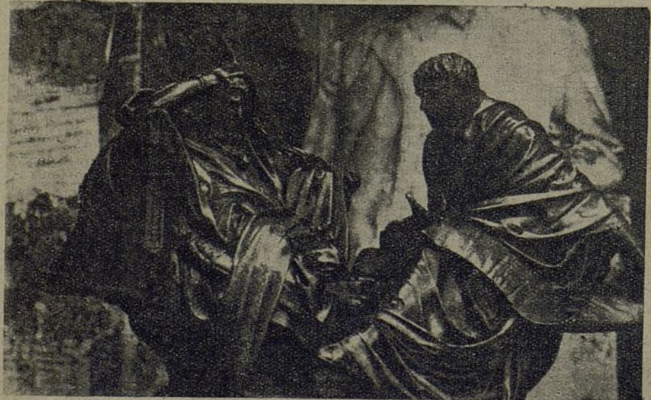
Una muestra de las antiguas actividades de la fundición. Eran otros tiempos, en que el arte no estaba amenazado por explosiones de obuses y metralla

Es tenaz la resistencia que hay que vencer para hacer hablar a uno—cualquiera—de estos hombres de la producción.