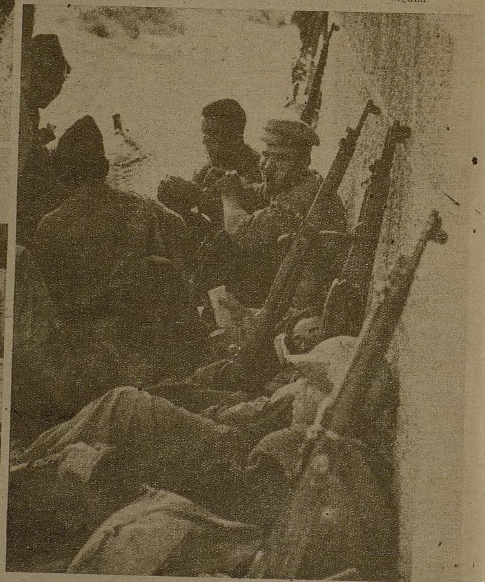
A pesar de los duros contraataques enemigos, aun tienen tiempo nuestros soldados de descansar de las fatigas de los combates, a la sombra bienhechora de alguna pared