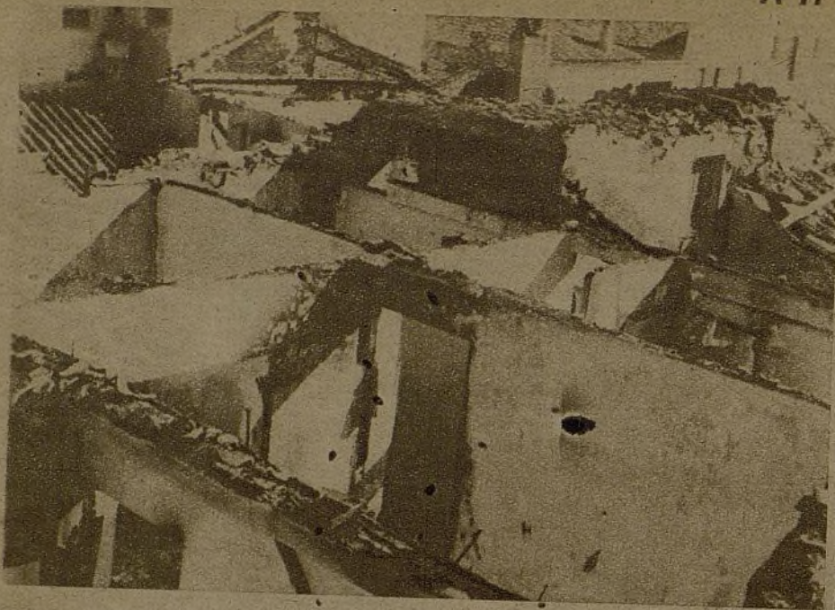
Todo el mundo está ya bien convencido de la criminalidad de los métodos fascistas, pero ahí va una prueba más: los restos del Asilo de Ancianos, de Guadalajara, después de una incursión de los aviones negros