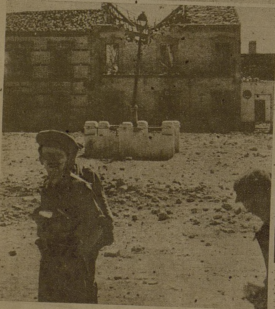
La plaza principal de un pueblo recién conquistado, que muestra aún los efectos de la lucha de horas antes, y que sigue y seguirá en nuestro poder, pese a los titánicos esfuerzos del enemigo por reconquistarla