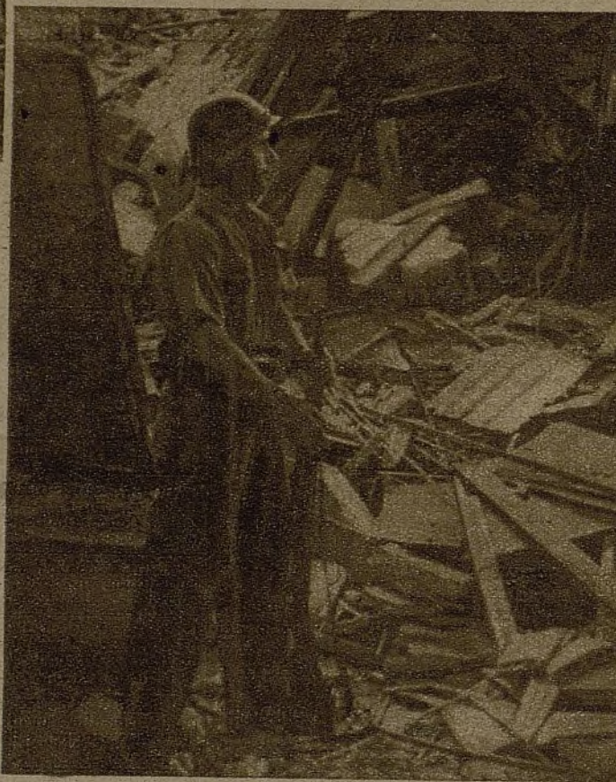
Firmeza. Decisión. Energía. Este soldado del pueblo es de los que no retrocederán nunca. Por el contrario, es de los que saben que "¡Pasaremos!"