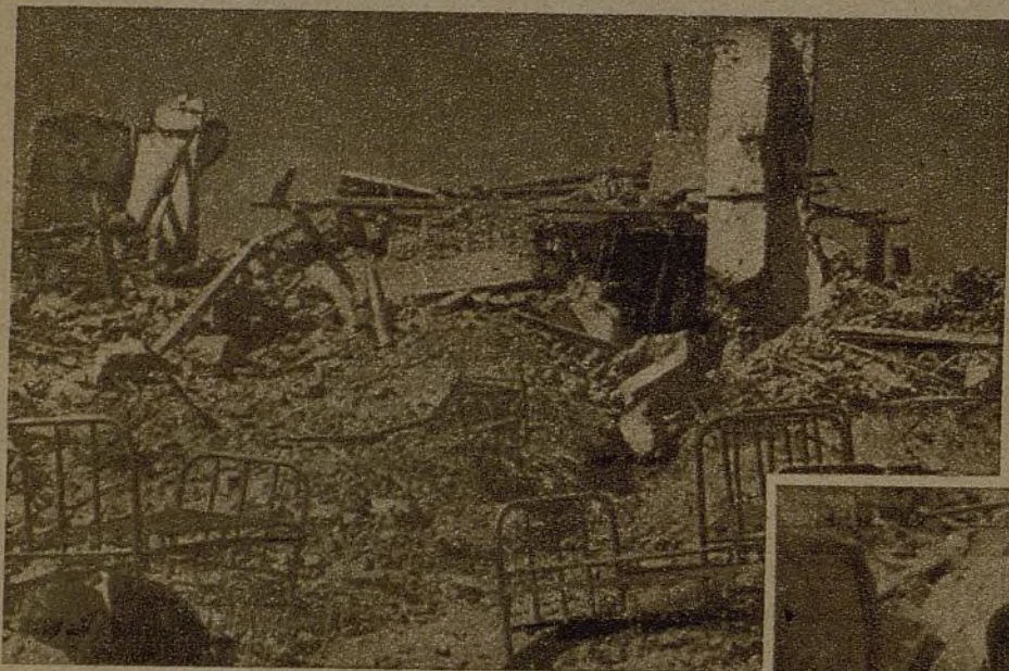
Nuevas casas conquistadas por la dinamita y las bayonetas de los camaradas de la Brigada 42. Este frente se extiende, cada vez más, prodigiosamente