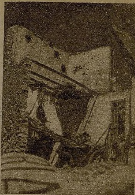
Esos muros agrietados, estas vigas al aire no volverán a cobijar más los yugos y las flechas de los reaccionarios españoles (!!). Son de quien siempre han sido, de las manos que las construyeron: de los trabajadores

"Manolo" es un civilón, de unos cuarenta años, jefe a lo que parece de su banda, que al llegar la noche ya tiene ganas de conversación. Los muchachos le dejan despacharse a su gusto. Única-