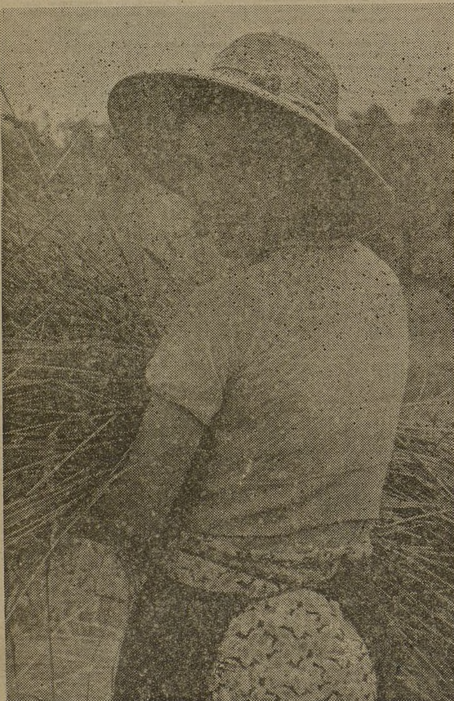
Ni una braza de mies quedará sin segar mientras haya muchachas que, como ésta, se dediquen a la ruda tarea con la sonrisa en los labios