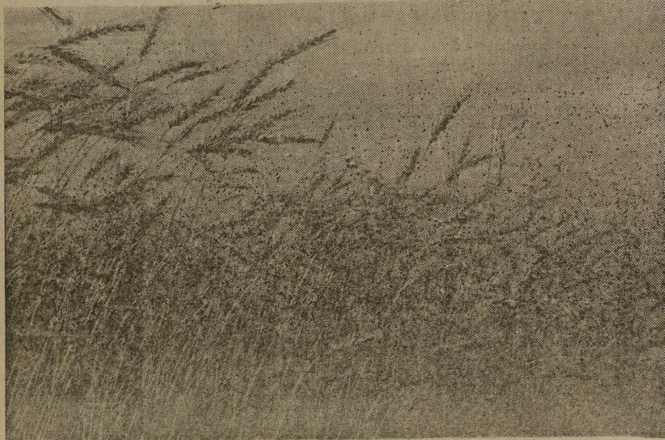
El sol ha dorado la espiga. Ni un solo grano de trigo puede perderse. El futuro de nuestra guerra lo exige así