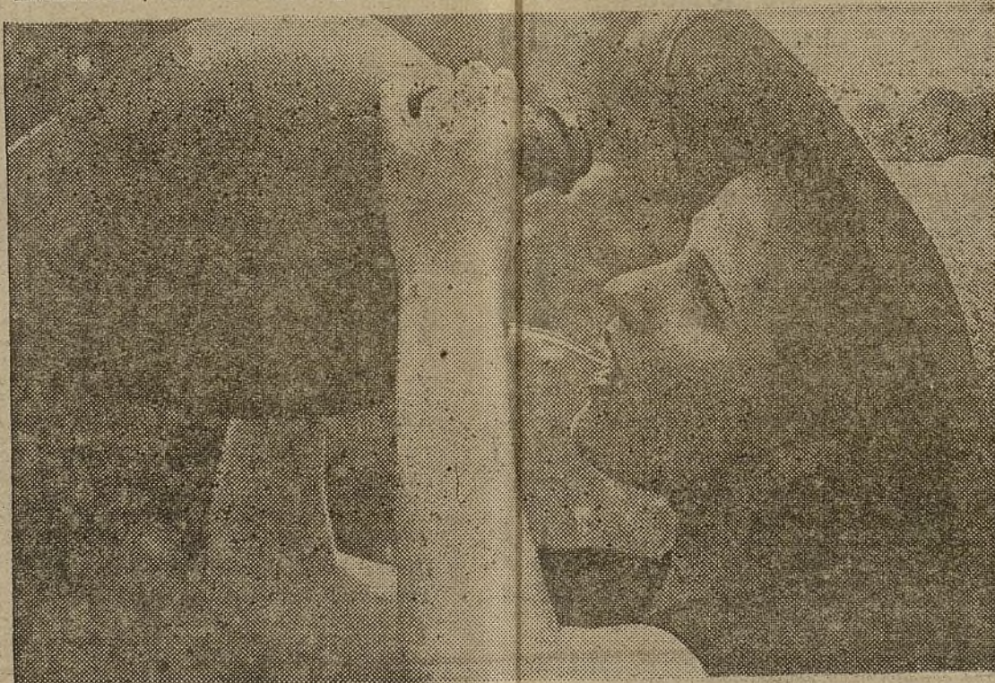
El sol reseca los labios y la garganta. Un trago de agua fresca es el único medio para contrarrestar los efectos del calor

Otro día, que marcó una fecha decisiva, vinieron de Madrid algunos jóvenes—muchachos y muchachas—, bien vestidos, a quienes ellas tomaron también por "señoritos".