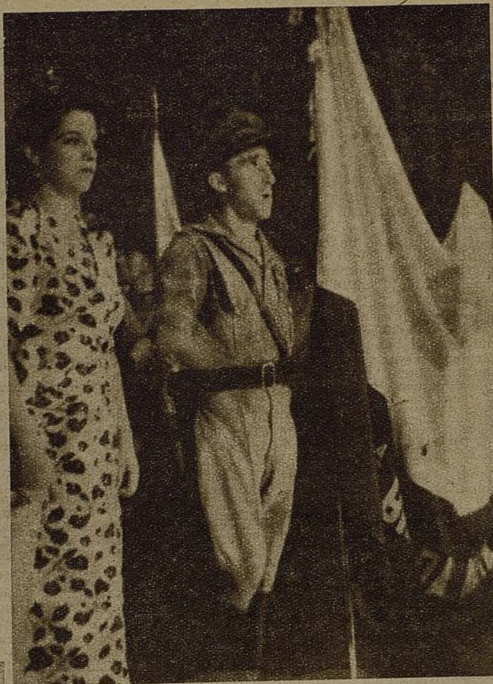
Los jóvenes mercantiles del Sector Sur apadrinaron a la 36 Brigada, regalándole una bandera. En la foto, la madrina y el comandante López

DE LA REUNION QUE CELEBRAN EN VALENCIA LAS REPRESENTACIONES DE LAS ORGANIZACIONES JUVENILES ESTA PENDIENTE TODA LA JUVENTUD QUE LUCHA Y TRABAJA. DE ELLA DEBEN SALIR LAS BASES FIRMES DE LA UNIDAD DE TODA LA JUVENTUD. NOSOTROS ESPERAMOS QUE LOS ALLI REUNIDOS SABRAN RECOGER LAS ASPIRACIONES DE LAS MASAS JUVENILES