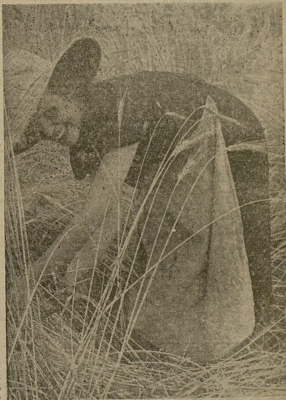
Los brazos de los jóvenes campesinos que luchan en los frentes han sido sustituidos este año por los de las muchachas en la recogida de la cosecha