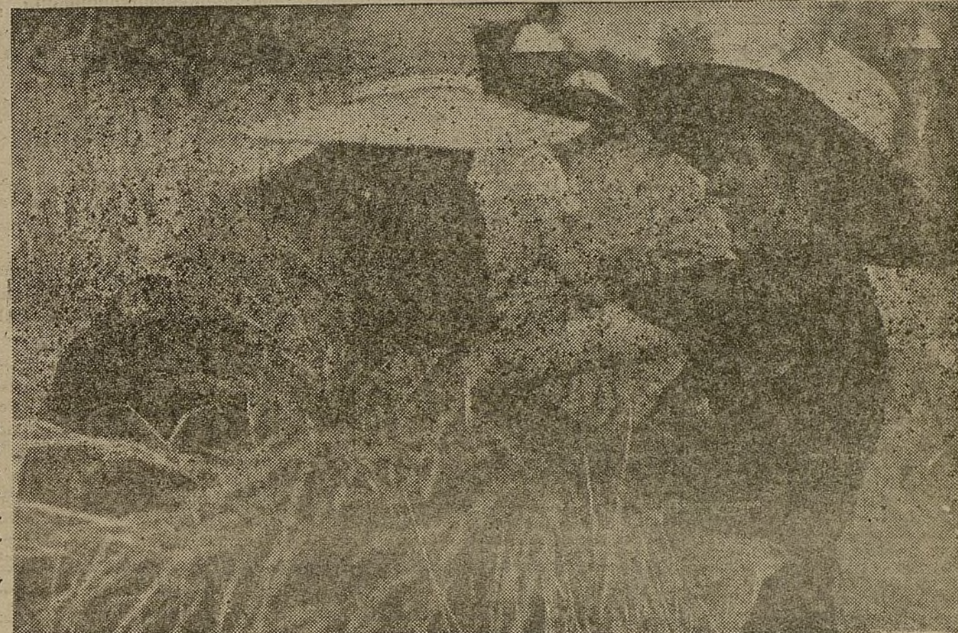
Este año la cosecha ha sido recogida con más entusiasmo y alegría que nunca. ¡Por primera vez, la cosecha es completamente de los campesinos!

Llega la Prensa diariamente, y estas campesinas, hace meses incultas, leen hoy en reunión los periódicos y comentan las noticias y los artículos. Ellas conocen sus obligaciones al pie de la letra y aprovechan cualquier ocasión para hacerlo constar así a todo el mundo.