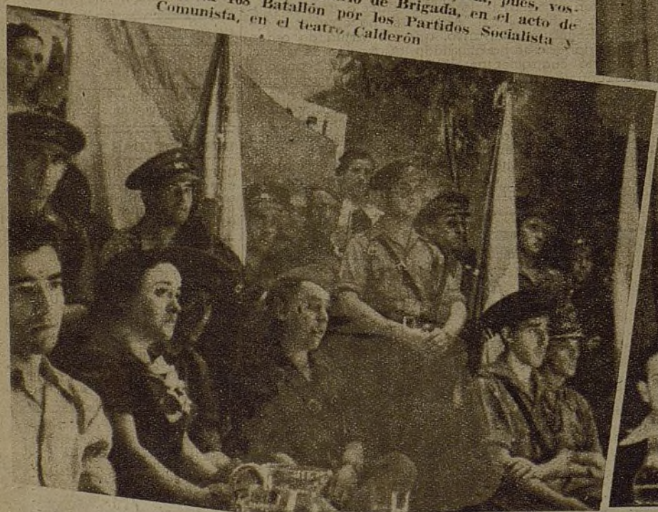
La presidencia en el acto de entrega de una bandera a la 36 Brigada, que se celebró el domingo en el cine Progreso