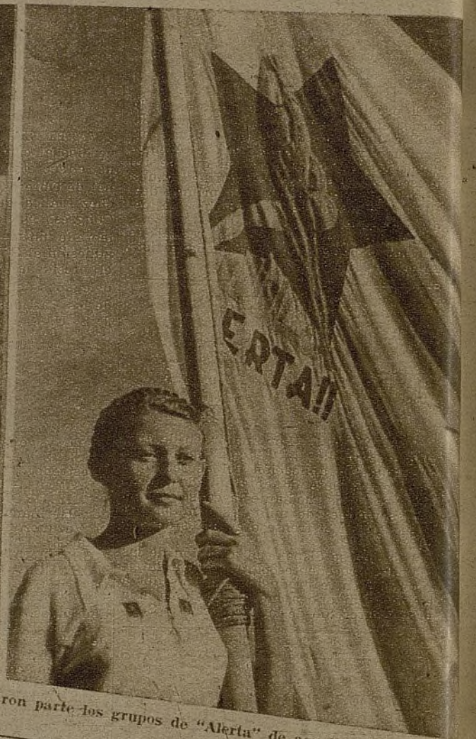
En el festival celebrado el día 1 de agosto en Valencia en honor de la U. R. S. S. y Méjico, tomaron parte los grupos de "Aleria" de aquella capital