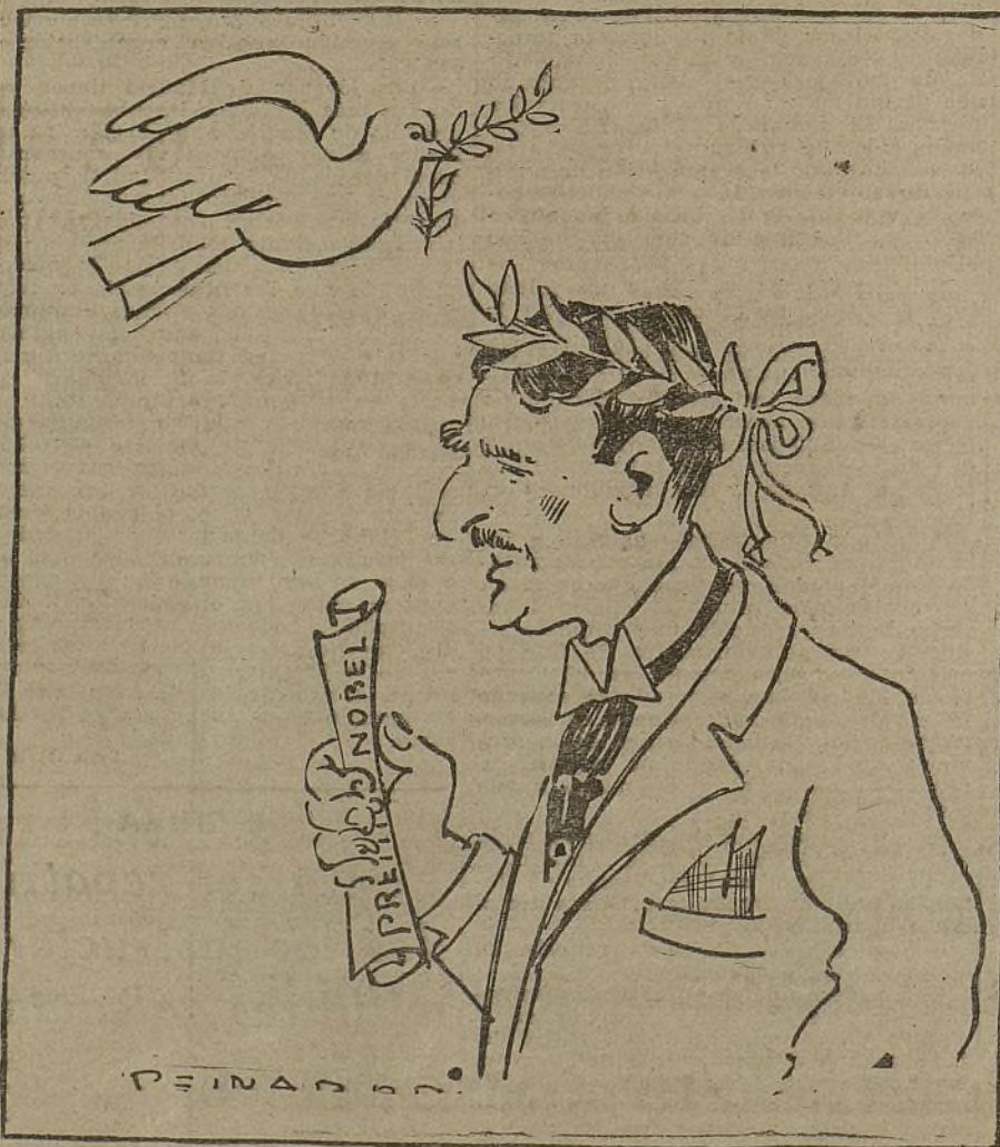
LA POLOMA.—¡Qué dureza de cara! Yo me voy.

y muchas más informaciones de la más viva actualidad que hacen de este número un verdadero extraordinario, al precio corriente de 40 céntimos.