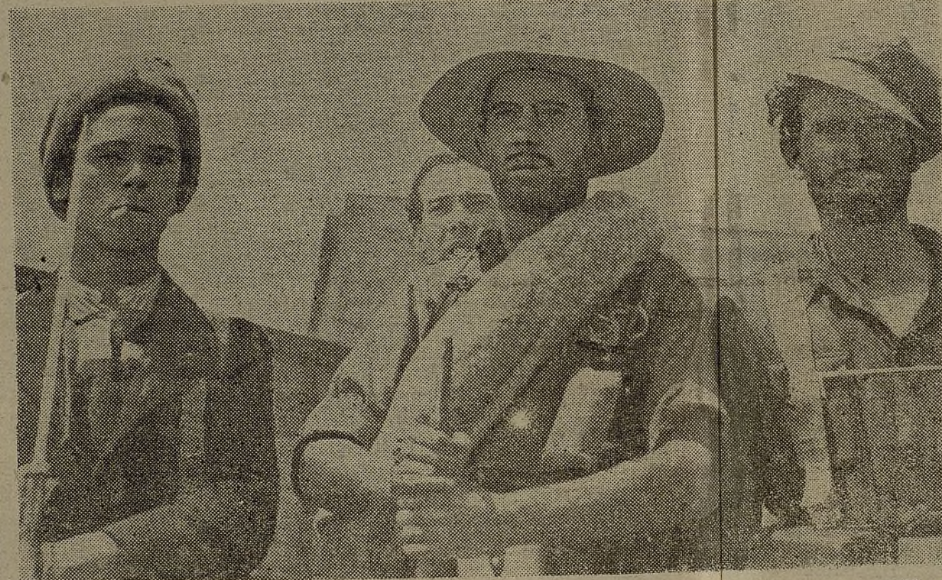
Estos hombres de rostros rudos y de vestir descuidado fueron los héroes que supieron contener las primeras acometidas del enemigo, supliendo con voluntad indomable las deficiencias de aquellos tiempos

el fascismo, a aquellos primeros grupos de muchachos abnegados que prefirieron dar su vida antes que verse sometidos a la barbarie y la tiranía.