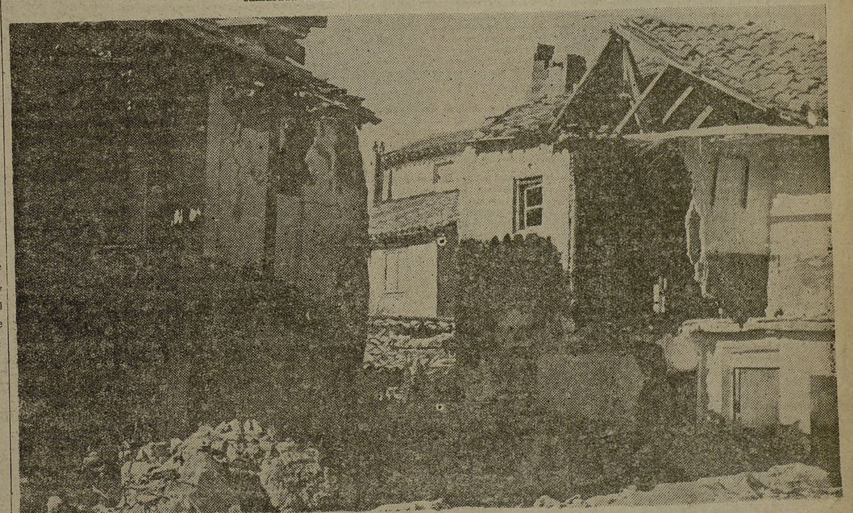
Alcalá de Henares... Uno de tantos episodios de los primeros días de lucha contra la rebelión. La aviación de Franco podrá libremente ametrallar nuestros pueblos, ensangrentar las calles tranquilas, deshacer sus familias humildes...