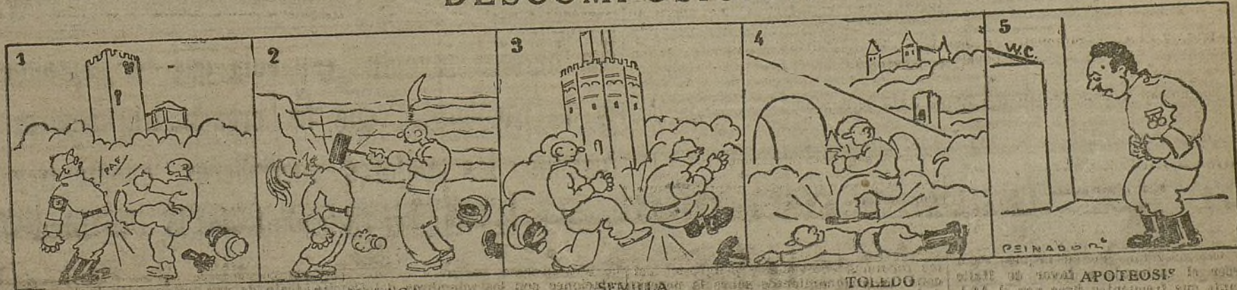
GRANADA Y MOTRIL