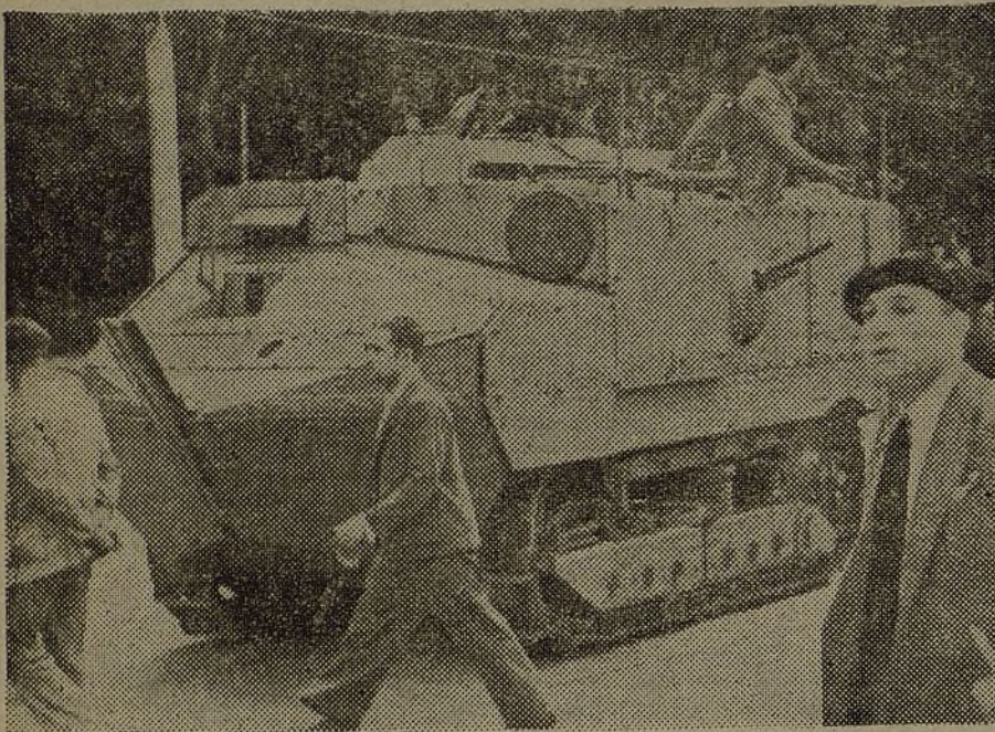
Un "tanque" que participó en el asalto al cuartel de la Montaña. Un blindaje improvisado sobre un vulgar tractor constituyó nuestra primera máquina de guerra. Han cambiado algo las cosas...