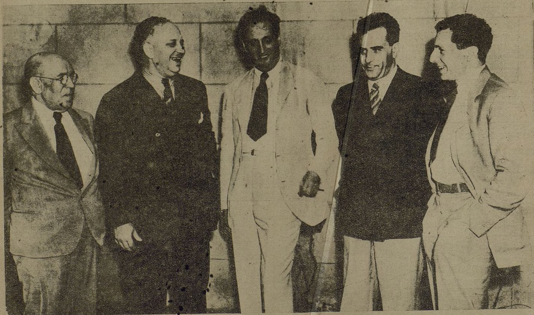
Los cónsules españoles se reunieron en Washington para honrar la memoria de los soldados leales muertos en el año de guerra civil española