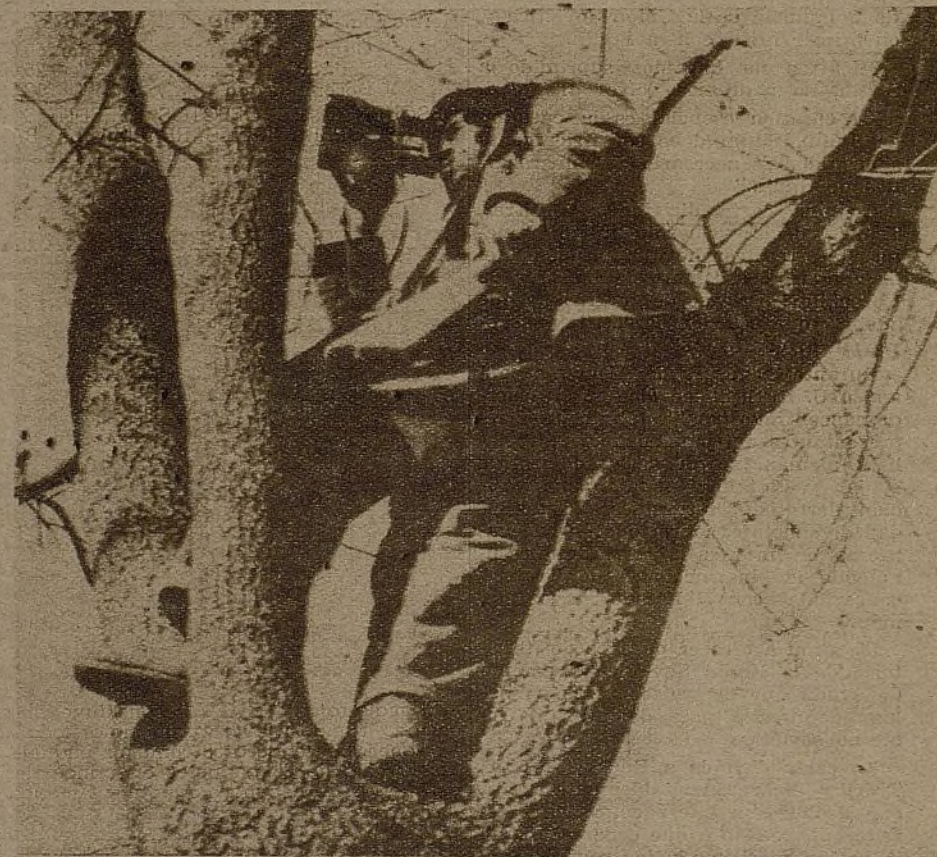
Pero siempre un soldado está vigilando los movimientos del enemigo para, en caso de peligro, dar el alerta a sus compañeros