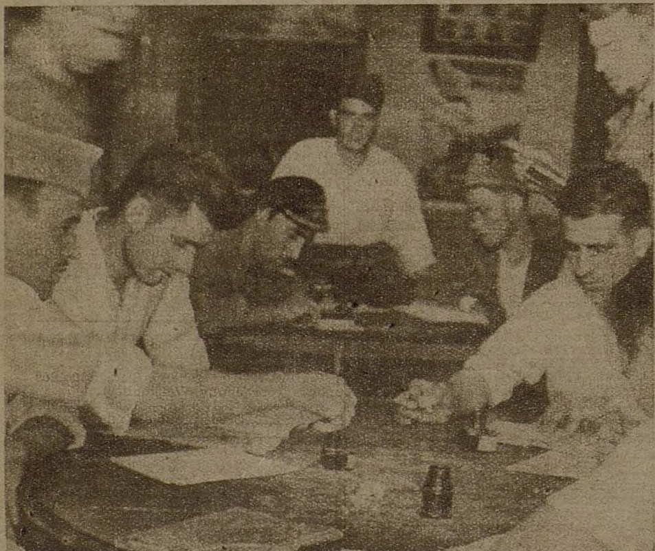
La cultura ya es del pueblo. Este la recogió el 18 de julio, entre el primer silbar de la pólvora, durante el asalto al cuartel de la Montaña. Hoy no hay frente ni primera línea que no tengan su terreno acotado para la instalación del Hogar del Combatiente