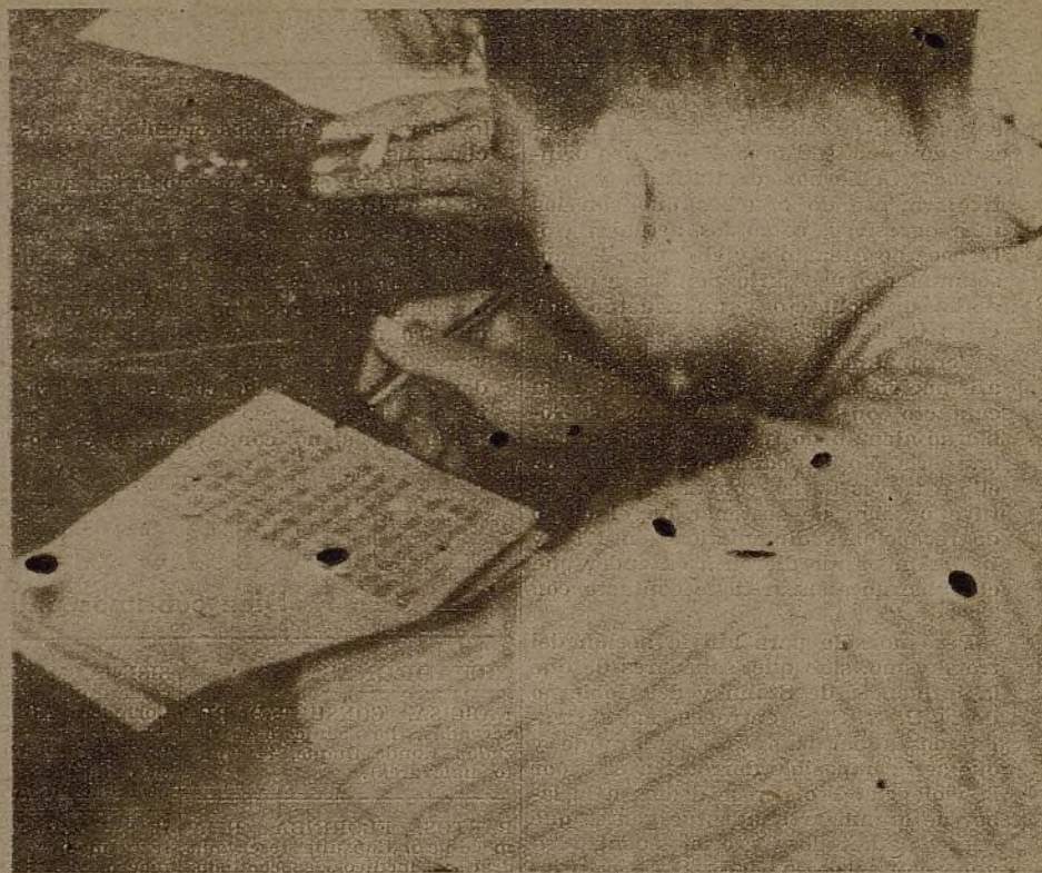
En la cartilla popular, editada por el Ministerio de Instrucción, aprenden nuestros soldados las primeras letras; estos mismos soldados que, terminada la guerra, podrán ser médicos, arquitectos, escritores, porque tal es la voluntad del pueblo... y de su juventud