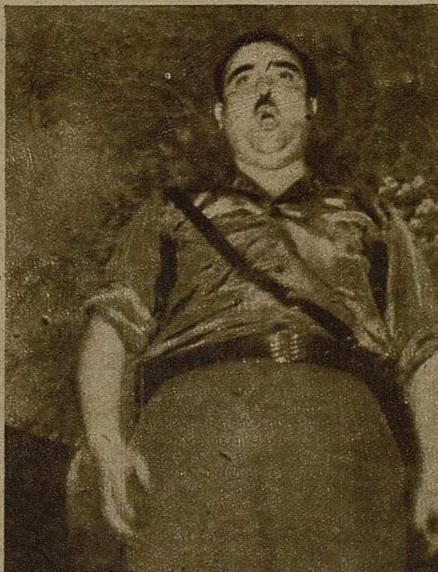
Piñera, en el acto de la 42 Brigada