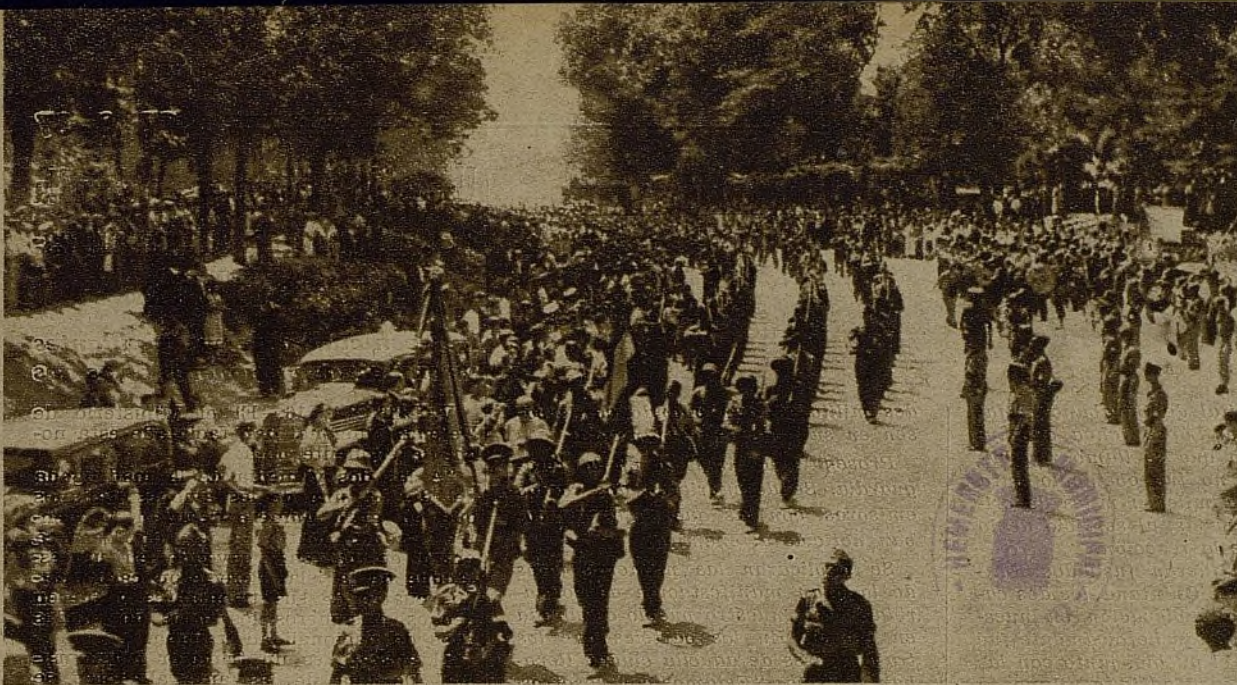
Los soldados de la 44 Brigada desfilan ante el pueblo de Madrid después del acto de la entrega de una bandera, donada por la Casa de Valencia