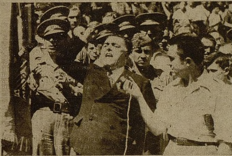
El representante de la Casa Valenciana, en su intervención