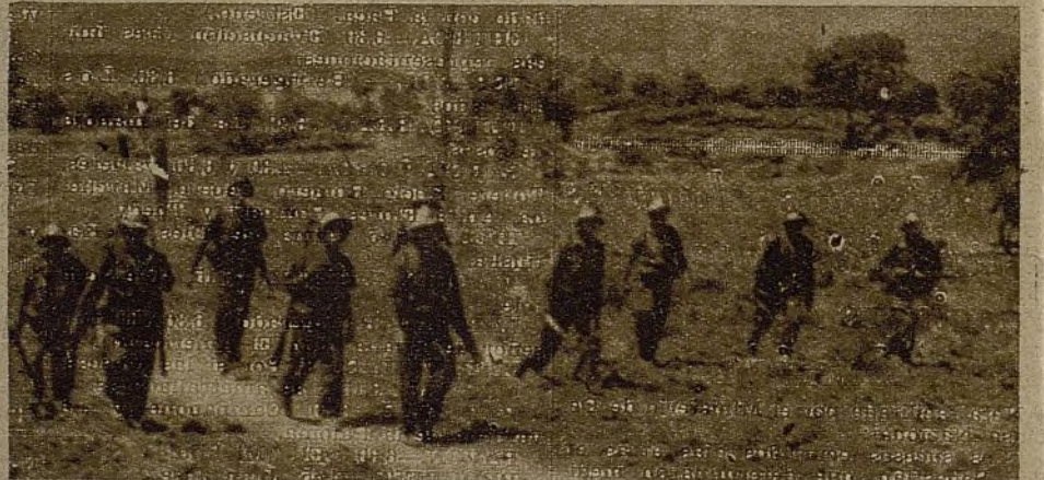
Después del ejercicio militar, estos combatientes se ducharán y, seguidamente, darán su acostumbrada hora de clase. ¿Cuándo tuvieron o gozaron de estos cuidados en la época del Ejército capitalista?