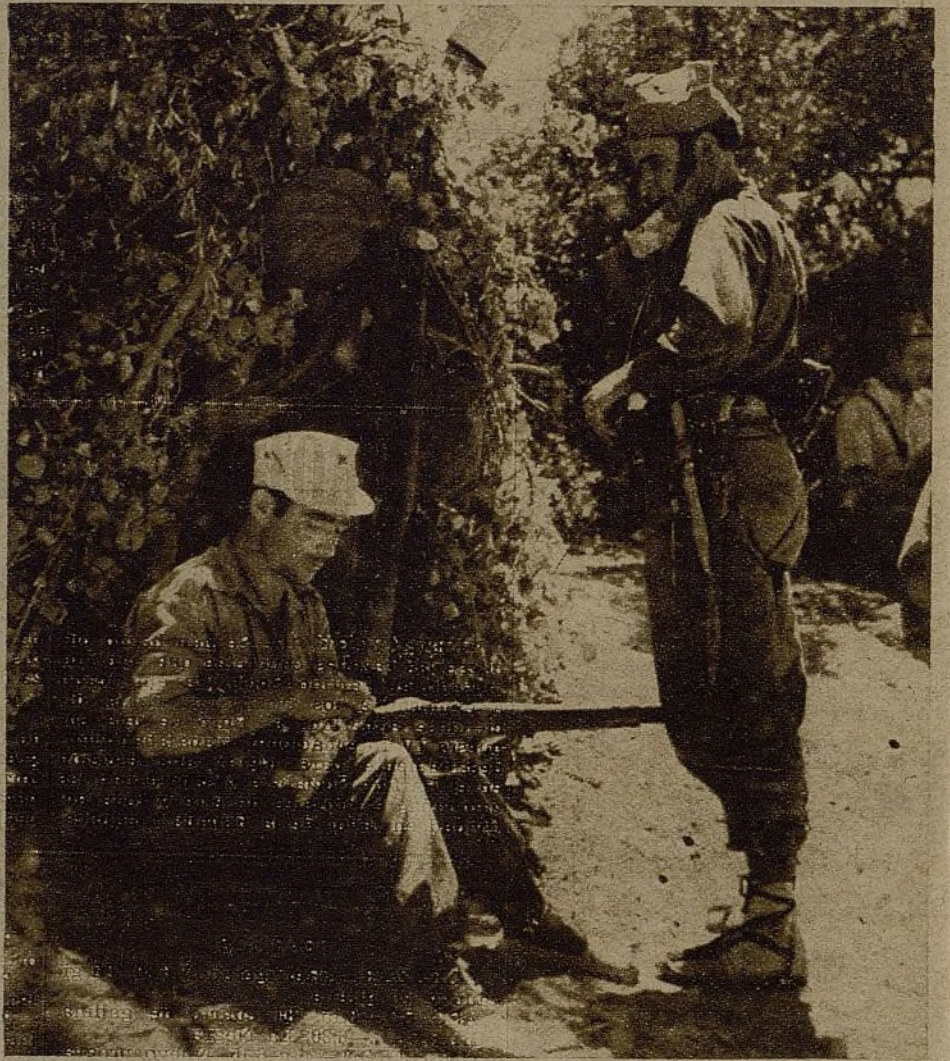
Aun en pleno descanso se sigue cuidando del fusil como a las niñas de los ojos. Veinte minutos diarios sirven para tenerlo, además de limpio y brillante, seguro contra cualquier eventualidad