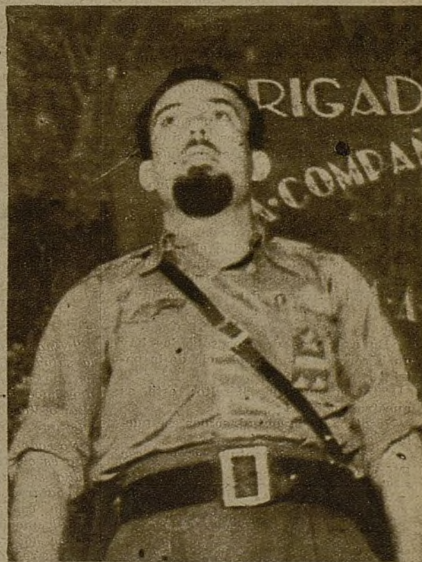
Ino, en el acto de la 42 Brigada