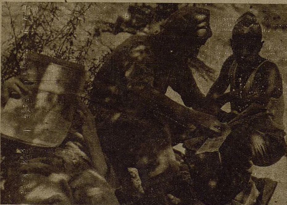
El momento de la llegada de nuestro diario es esperado siempre con interés. Los movimientos de la retaguardia son desde aquí seguidos y comentados con justeza.