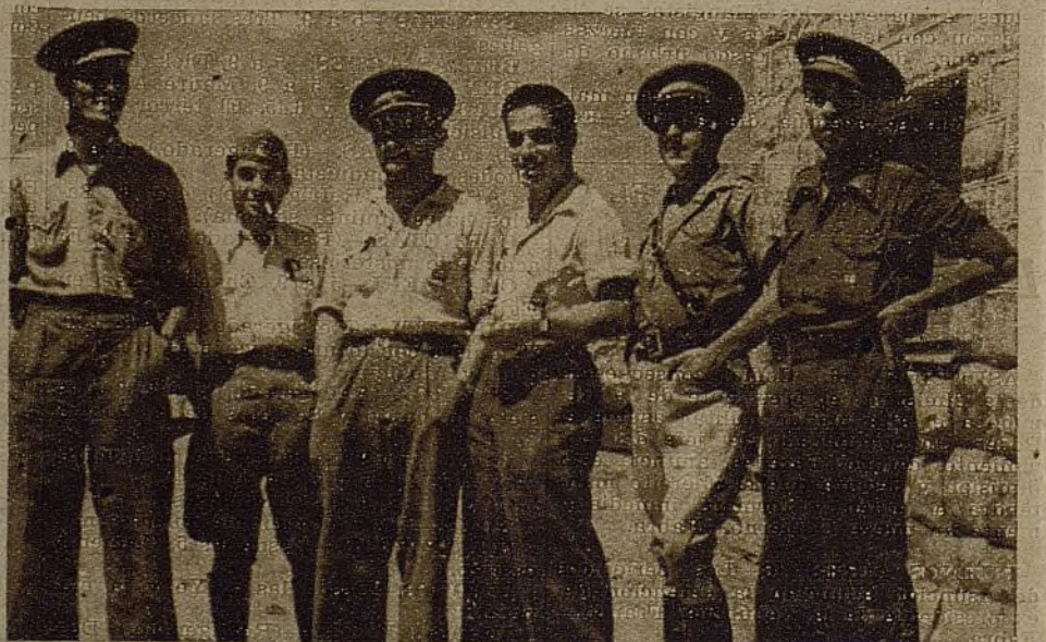
Cuadros de nuestro Ejército. Así como ellos sean serán los soldados, los camaradas a sus órdenes. Y esto bien lo saben los mandos jóvenes de la Brigada