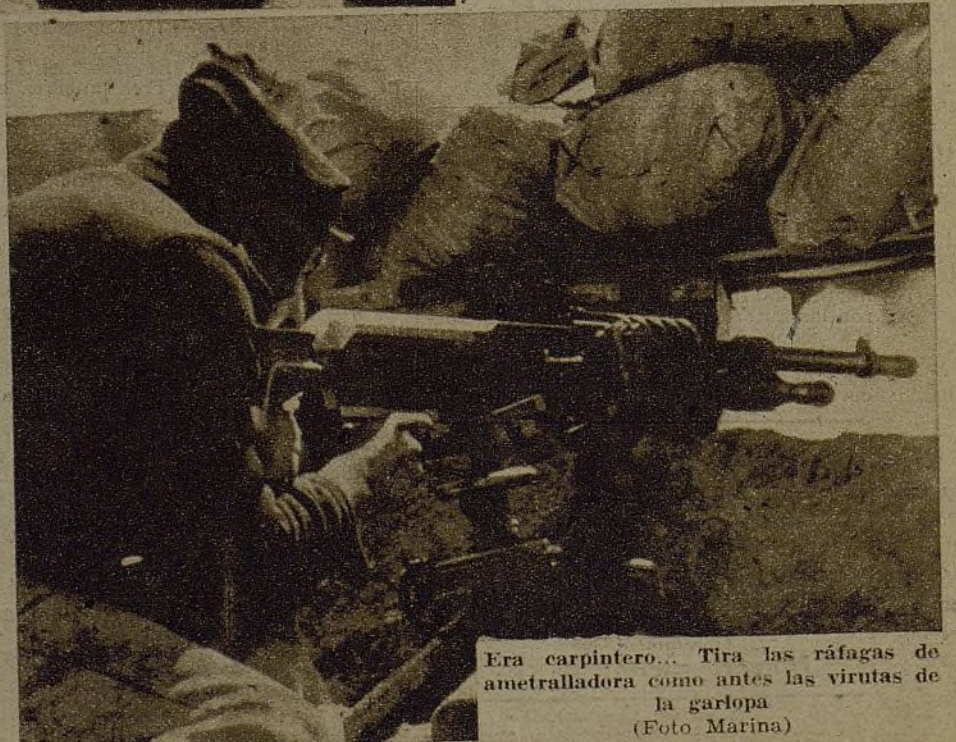
Era carpintero... Tira las ráfagas de ametralladora como antes las virutas de la garlopa