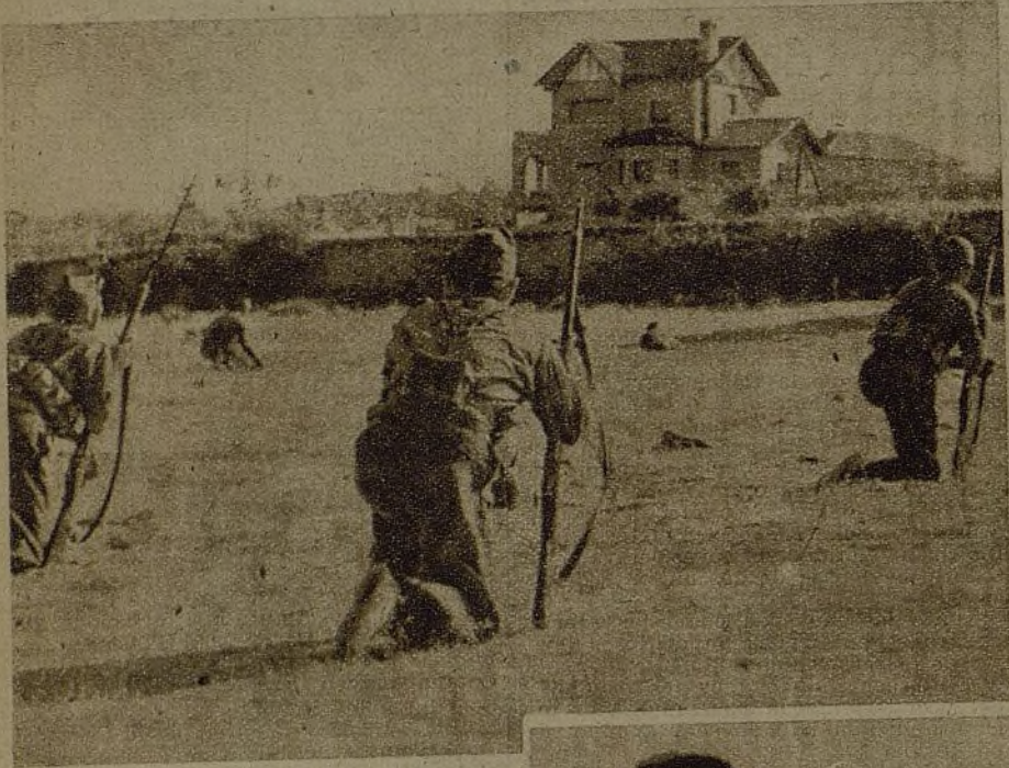
En los ratos de descanso nuestros soldados se capacitan militarmente