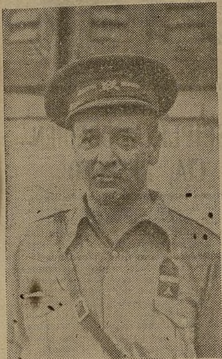
El hombre propone...

Bienvenida sea la orden: "Hay que hacer un reportaje." Nos viene de la dirección de AHORA, el gran diario de la juventud. Vamos a cumplirla.