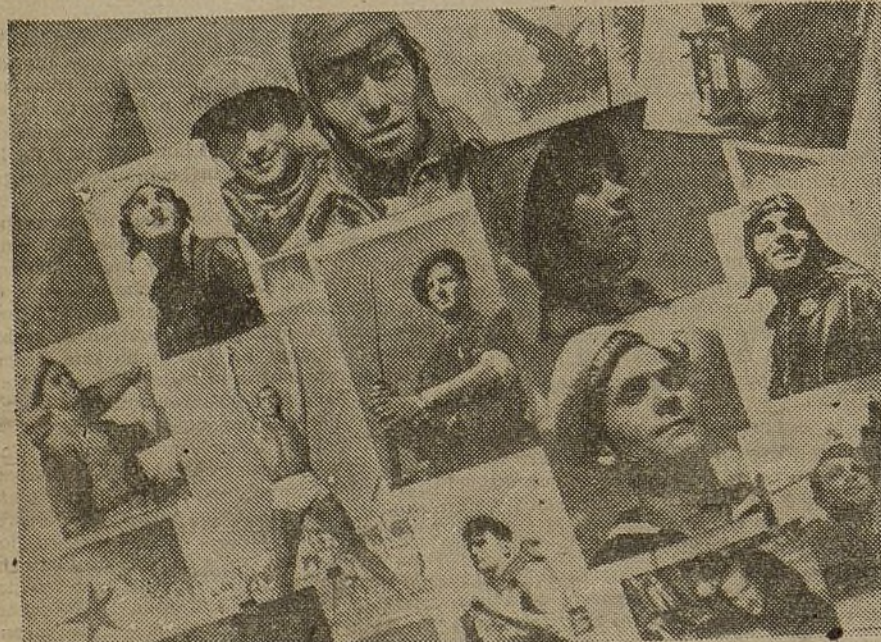
El heroísmo de los marinos, aviadores, tanquistas, de todos los combatientes de nuestro Ejército; la abnegación de la juventud que trabaja en el campo y la fábrica han sido recogidos en la gran Exposición de la Juventud