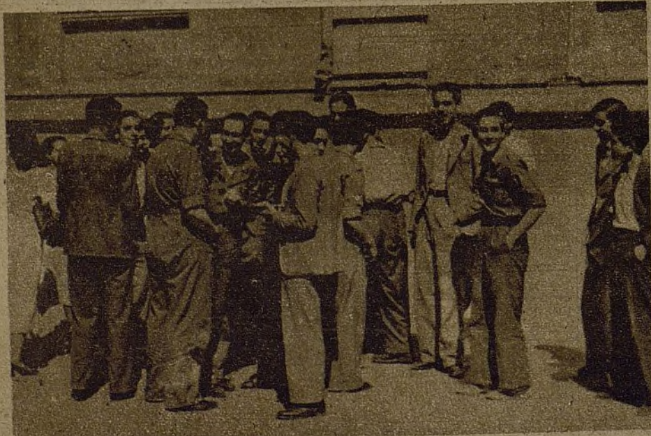
La juventud estudiantil comenta con alegría el decreto del ministro de Instrucción, que les ha abierto las puertas de la Universidad, facilitándoles el término de sus estudios

Pero junto a todo esto hay otra cosa que saben bien: que ellos solos no forman el "todo" estudiantil de España, sino que, al ser declarado el estudio FUNCION SOCIAL por el ministro de Instrucción, tan querido por todos nosotros, han de sumarse a ellos esos cientos y cientos de chicos de la ciudad y del campo, de manos curtidas por bieldos y martillos, de vientres surcados de hambre material y espiritual, de los que no solamente saldrán ingenieros, médicos, arquitectos capaces de comprender la política de la clase obrera y de realizarla conscientemente, como ha dicho el camarada Stalin, sino que crearán también una nueva y entusiasta generación de sabios que