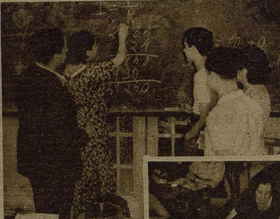
De esta juventud estudiosa han de salir los que han de cimentar, en la paz, el porvenir glorioso que aguarda a nuestra Patria en el mundo

"La revolución, al conquistar la libertad y el bienestar para la nueva generación, ha provocado en toda la juventud el deseo de saber, de poseer una cultura, de desarrollar su inteligencia y su capacidad creadora." (De las Bases de Alianza.)