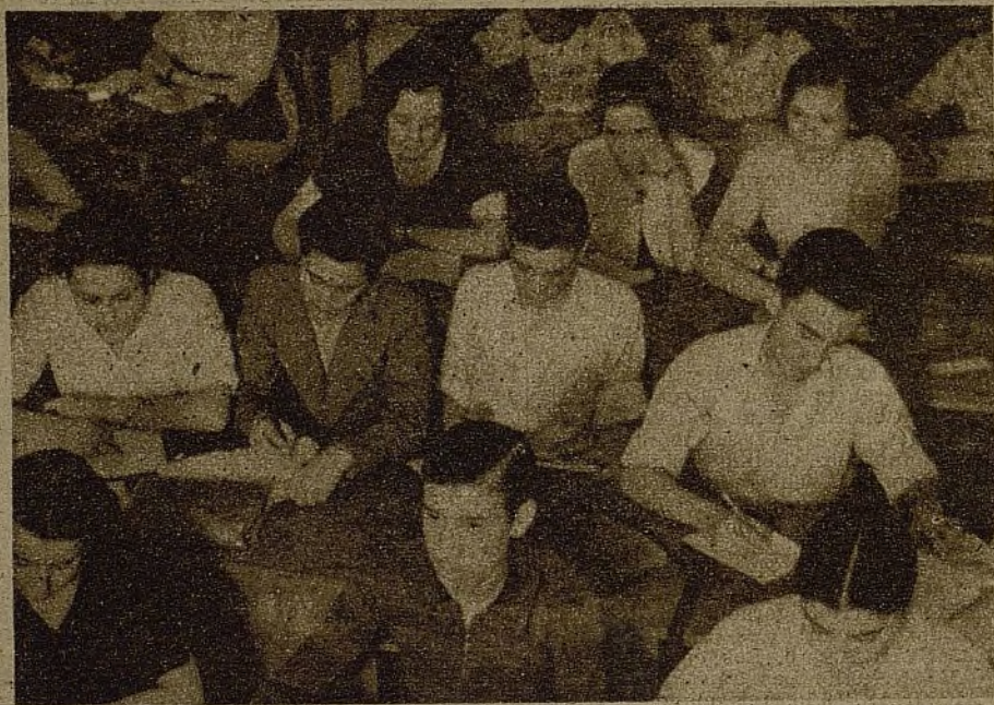
Las más difíciles fórmulas matemáticas son resueltas por nuestros muchachos, lo mismo que la técnica y la matemática de la guerra es asimilada por aquellos otros que con sus armas nos han de llevar a la victoria