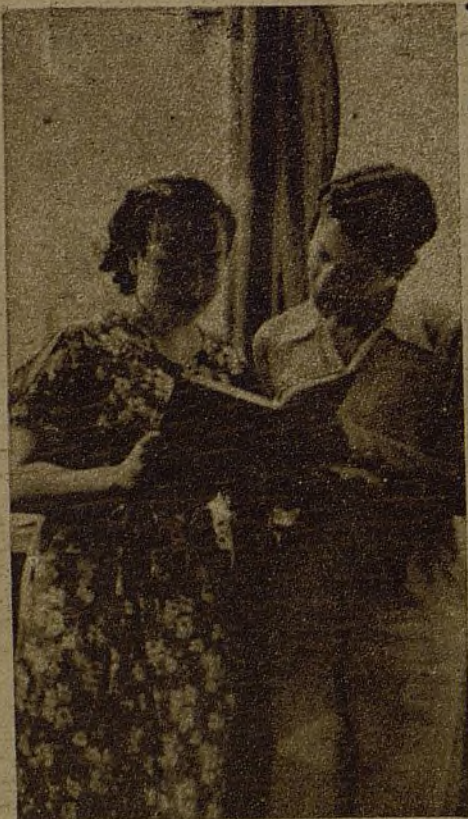
El Gobierno ha abierto las puertas de la Universidad a la juventud obrera. Cientos de muchachos y muchachas tomarán los libros para extraer de ellos cuantas enseñanzas necesitan