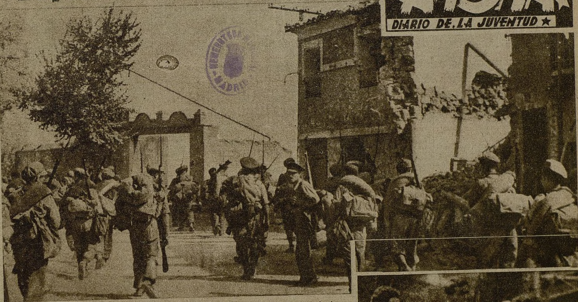
Con el avance de nuestras tropas en Aragón, pueblos que hasta hoy padecieron bajo la bota del fascismo, han pasado a poder de la República