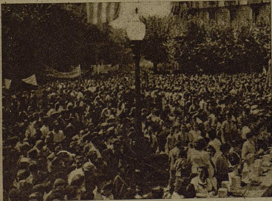
Barcelona ha tributado su acostumbrado homenaje anual ante la estatua del "conseller" Casanova, representante de las libertades catalanas. Un aspecto de la plaza, llena de banderas y entusiasmo