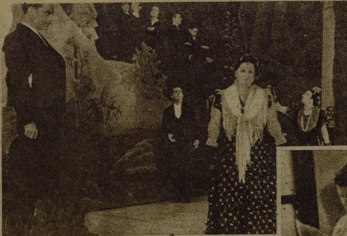
Aunque el poeta Federico García Lorca haya sido víctima del odio fascista a la cultura, su obra la guarda nuestro pueblo con cariño y admiración. He aquí un momento del romance de Alcázar Fernández "Responso lírico a Federico", presentado por el grupo artístico que actúa en el Español