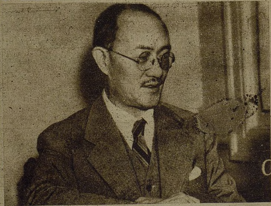
C. T. Wang, embajador chino en los Estados Unidos, ha hablado al pueblo americano. Y ha contado el heroísmo de una juventud que, como la nuestra española, no se dejará avasallar por el imperialismo fascista. El ha dicho: "La actual destrucción de Shanghai es el resultado directo de la bárbara ambición del Japón de ser un Estado continental".